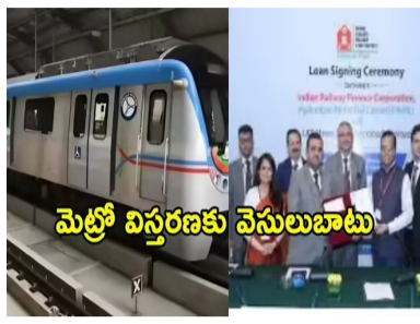
ఎల్ఆర్ఎడీ, హైదరాబాద్ మెట్రో సంస్థ బృందాలకు ఆయన కృతజ్ఞతలు తెలిపారు. సమర్థవంతమైన, సుస్థిరమైన ప్రజా రవాణా వ్యవస్థను విస్తరించడమే తమ ప్రభుత్వ లక్ష్యమని స్పష్టం చేశారు. హైదరాబాద్ మెట్రో రైల్ ఫేజ్-1, మూడు కారిడార్లలో 57 స్టేషన్లతో 69.2 కిలోమీటర్ల మేర విస్తరించి ఉంది. పబ్లిక్-ప్రైవేట్ పార్ట్నర్ షిప్ కింద అభివృద్ధి