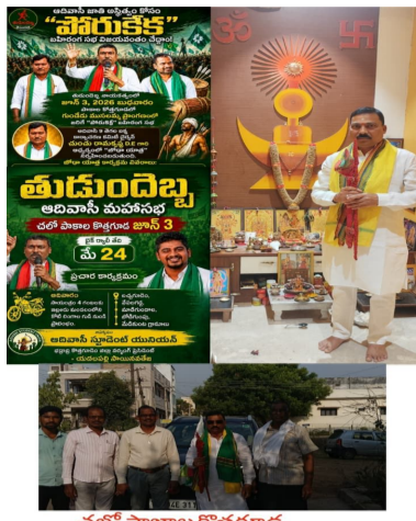
చలో పాఠశాల కోతగూడ

46 డిగ్రీల ఎండ ఒక వక్ర అనారోగ్య సమస్యలు ఉన్న జాతికి వచ్చిన లంబాదా పీడ ఒదిలించటం కోసం ఓర్వతో సాగుతున్న యాత్ర ఇది రండి కదిలి రండి అంటిమ యుద్ధంలో తాడో పేడో తేలుకుండాం. నేను కదులుతున్న మీరు కదలండి నాకోసం నీకోసం కాదు ఆదిమ తెగల రక్షణ కోసం జూన్ -3 చరిత్రలో మరొక మైలురాయి అప్పాయిలి పోడు భూమిల రక్షణకు అండగా ఉంటాలి నిరుద్యోగులకు ధైర్యం ఇచ్చి ఏజెన్సీ ఉద్యోగం అప్పాయిలి లంబాడిల తొలగింపుకు ఉపాధింబం ఒక మార్గ దర్శనం అప్పాయిలి అంటిమ పోరాటం అప్పిత్వం కోసం అని కదలండి జోషి యాత్ర అంటే లంబాడిలా గుండెలో గుబులు యాత్ర.