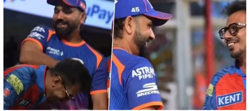
ఎదురొచ్చే పంజాబ్ కింగ్స్.. ఈ విజయంతో ఓటమిల పరంపరకు బ్రేక్ ఇచ్చింది. కెప్టెన్ శ్రేయాన్ అయ్యర్ సెంచరీ రాణించడంతో పంజాబ్ ఘన విజయం సాధించింది. ఇదే మ్యాచ్ లో యుజ్వేంద్ర చాహాల్ రెండు వికెట్లు తీసుకుని మ్యాచ్ విజయంలో కీలక పాత్ర పోషించాడు. మ్యాచ్ అనంతరం యుజ్వేంద్ర చాహాల్ మాట్లాడుతూ ఓ స్టేట్ మెంట్ ఇచ్చాడు. 'రాజస్థాన్ రాయల్స్ పై రోహిత్ శర్మ 200 స్కోర్ చేస్తాడని నేను అనుకుంటున్నాను. అదే సమయంలో వైభవ్ సూర్యవంశీ డకౌట్ అయ్యారు. మేం ప్లే ఆఫ్స్ కి క్యాపిటల్స్ కావాలి' అంటూ చాహాల్ అన్నాడు. ముంబై ఇండియన్స్ తో జరిగే మ్యాచ్ లో రాజస్థాన్ రాయల్స్ పంజాబ్ కింగ్స్ పోటీలో పాటు కోల్కతా నైట్ రైడర్స్ కు ప్లే ఆఫ్స్ అవకాశం ఉంటుంది. ప్రస్తుతం పాయింట్ల పట్టికలో పంజాబ్ కింగ్స్ 15 పాయింట్లతో నాలుగో స్థానంలో కొనసాగుతుంది. 14 పాయింట్లతో రాజస్థాన్ రాయల్స్ ఐదు, 13 పాయింట్లతో కోల్కతా నైట్ రైడర్స్ ఏడో స్థానంలో ఉన్నాయి. దబుల్ డబ్బర్ లో భాగంగా ముంబై జరగనుంది.

రోహిత్ శర్మ - యుజ్వేంద్ర చాహాల్ బాండింగ్ గురించి ప్రత్యేకంగా చెప్పాల్సిన అవసరం లేదు. రోహిత్ - చాహాల్ ఎప్పుడు కలిసినా ఓ ఫస్ట్ మూవెంట్ కచ్చితంగా ఉంటుంది. అయితే, లక్ష్మీపై విజయం తర్వాత పంజాబ్ కింగ్స్ 15 పాయింట్లతో నాలుగో స్థానానికి వెళ్లింది. ప్లే ఆఫ్స్ లో పంజాబ్ నిలవాలంటే ముంబై ఇండియన్స్ తో జరిగే మ్యాచ్ లో రాజస్థాన్ రాయల్స్ ఓడిపోవాలి. దాంతో రోహిత్ శర్మ 200 కొట్టి పంజాబ్ ను ప్లే ఆఫ్స్ కు పంపిస్తాడంటూ చాహాల్ ఫస్ట్ స్టేట్ మెంట్ ఇచ్చాడు. పంజాబ్ కింగ్స్ ఐపీఎల్ ప్లే ఆఫ్స్ భవిష్యత్తు ముంబై ఇండియన్స్ చేతులో ఉంది. వాంఖడె వేదికగా ముంబై ఇండియన్స్ - రాజస్థాన్ రాయల్స్ మ్యాచ్ ఫలితం ఆధారంగానే పంజాబ్ కింగ్స్ ప్లే ఆఫ్స్ రేసులో ఉంటుందా? లేక ఇండియాన్ వరుతుందా? అనేది ఆధారపడి ఉంది. ఈ హై ఓల్డ్ టైమ్స్ ముందు యుజ్వేంద్ర చాహాల్ చేసిన స్టేట్ మెంట్ ఇప్పుడు వెరల్దగా మారింది. లక్ష్మీ సూపర్ జెయింట్స్ తో ఇకనూ స్టేడియం వేదికగా జరిగిన మ్యాచ్ లో పంజాబ్ కింగ్స్ ఘన విజయం సాధించింది. అప్పటి వరకు వరుసగా ఆరు ఓటమలు