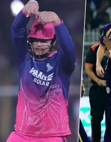
ఆడనుండగా.. సర్వైవర్స్ ఎలిమినేటర్ మ్యాచ్ ఆడనుంది. ఇక లక్ష్మీ సూపర్ జెయింట్స్, ముంబై ఇండియన్స్ ఎప్పుడో ఎలిమినేట్ కాగా.. తాజాగా చెన్నై సూపర్ కింగ్స్, ఢిల్లీ క్యాపిటల్స్ ఎలిమినేట్ అయ్యాయి. ఇక మిగిలింది మూడో జట్టు. ఆ మూడు జట్లలో ఒకటి నాలుగో స్థానంలో నిలవనుంది. లక్ష్మీ సూపర్ జెయింట్స్ పై గ్రాండ్ విక్టరీ

ఐపీఎల్ 2026 లీగ్ మ్యాచ్ లో ఈ రోజులో ముగియనున్నాయి. ప్రస్తుతం ప్లే ఆఫ్స్ రేసులో పంజాబ్ కింగ్స్, రాజస్థాన్ రాయల్స్, కోల్కతా నైట్ రైడర్స్ జట్లు ఉన్నాయి. పంజాబ్ 15 పాయింట్లతో ఉండగా, రాజస్థాన్ 14, కోల్కతా 13 పాయింట్లతో ఉన్నాయి. రాజస్థాన్ రాయల్స్ మధ్యస్థంగా జరిగే మ్యాచ్ లో ముంబై ఇండియన్స్ పై విజయం సాధిస్తే ఎవరితో సంబంధం లేకుండా ప్లే ఆఫ్స్ కు వెళ్లనుంది. లేకపోతే రాత్రి జరిగే మ్యాచ్ వరకూ ఎదురుచూడాల్సి వస్తుంది.