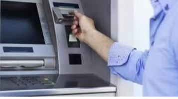
ఉద్యోగుల భవిష్య నిధి సంస్థ ఈపీఎఫ్ఓ తన చందాదారులకు సంకెళ్ల డిజిటల్ అనుభూతిని అందించేందుకు సిద్దమవుతోంది. త్వరలోనే యూపీఐ ఆధారిత పీఎఫ్ బదిలీలు, విత్ డ్రాయల్స్ సేవలను ప్రారంభించేందుకు ఈపీఎఫ్ఓ వేగంగా అడుగులు వేస్తోంది. దీనివల్ల ఉద్యోగులు తమ పీఎఫ్ సొమ్మును నేరుగా, అత్యంత వేగంగా తమ బ్యాంకు ఖాతాల్లోకి బదిలీ చేసుకోవచ్చు. అయితే ఈ సౌకర్య సేవను ఎలాంటి అంతరాయం లేకుండా అందుకోవాలంటే ఈపీఎఫ్ఓ

చందాదారులు తమ అకౌంట్స్ అత్యంత పునాదులను 5 వివరాలను అప్డేట్ చేసుకోవాలి ఉంటుంది. లేదంటే పీఎఫ్ డ్రాయింగ్స్ రిజెక్ట్ అయ్యే ప్రమాదం ఉంటుంది. మరి అందుకు సంబంధించిన వివరాలు తెలుసుకుందాం. ఈపీఎఫ్ఓ తీసుకువస్తున్న ఈ కొత్త డిజిటల్ విషయం ద్వారా ఉద్యోగులు తమ విత్ డ్రా చేసుకోవడానికి పీఎఫ్ బ్యాంకింగ్ ను అప్డేట్ చేయాలి. కేవలం యూపీఐ పీఎంబీ చేయడం ద్వారా క్షణాల్లో సొమ్మును అకౌంట్లోకి తెచ్చుకోవచ్చు. కానీ, ఈ ప్రక్రియ అంతా డిజిటల్ అప్డేట్ చేసిన పై ఆధారపడి ఉంటుంది కాబట్టి, మీ ఖాతాలో 5 అంశాలు సరిగ్గా ఉన్నాయో లేదో ఇప్పుడే చెక్ చేసుకోండి. 1. యూపీఎన్ యాక్టివేషన్, పాస్ వర్క్ యూపీఐ సేవలు ప్రారంభం కావాడనికీ ముందే మీ యూనిట్ వల్ల అకౌంట్ నంబర్ యాక్టివ్ మీ ఉంటే లేదో చూసుకోవాలి. చాలా మంది తమ పాస్ వర్డులను మర్చిపోతుంటారు లేదా పాత