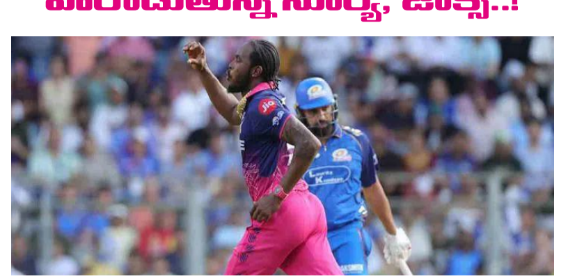
భారీ ఛేదనలో ముంబై ఇండియన్స్ కు రాజస్థాన్ రాయల్స్ పేసర్ ఆర్డర్ (2-14) చుక్కలు చూపించాడు. బ్యాటర్లు 32 పరుగులు చేసిన ఈ స్క్వేడ్లో బంతితోనూ విజృంభించి తొలి ఓవర్లోనే రోహిత్ శర్మ (0)ను డకౌట్ చేసిన ఆర్డర్ (2-14) తర్వాతి ఓవర్లో సమన్ ధిర్ (6)ను బౌల్డ్ చేసి రెండో వికెట్ అందించాడు. బర్డర్ ఓవర్లో రికెట్స్ (12)కవర్లో వైభవ్ చేతికి చిక్కగా. 24 రికెట్స్ (12) బర్డర్ బౌలింగ్ లో వైభవ్ చేతికి