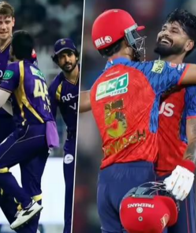
తర్వాత పంజాబ్ కింగ్స్ 15 పాయింట్లతో నాలుగో స్థానంలోకి వచ్చింది. అయితే, పంజాబ్ కింగ్స్ ప్లే ఆఫ్స్ కి వెళ్లడమా? ఇంటి దారి పట్టడమా? అనేది మాత్రం ఇవాళ జరిగి దబుల్ డబ్బర్ మ్యాచ్ ల మీద ఆధారపడి ఉంటుంది. మధ్యస్థంగా జరిగే మ్యాచ్ లో ముంబై - రాజస్థాన్, రాత్రి కోల్కతా - ఢిల్లీ జట్లు తలపడనున్నాయి. ఈ రెండు మ్యాచ్ ల

ఫలితాలే పంజాబ్ భవిష్యత్తును తేల్చునుంది. రాజస్థాన్ రాయల్స్ జట్టు ప్రస్తుతం 14 పాయింట్లతో ఐదో స్థానంలో ఉంది. ముంబై ఇండియన్స్ తో జరగనున్న మ్యాచ్ లో రాజస్థాన్ రాయల్స్ విజయం సాధిస్తే.. ఏ జట్టు మీద ఆధారపడకుండా ప్లే ఆఫ్స్ లో ఆడుగు పెట్టనుంది. రాత్రి జరిగే కోల్కతా - ఢిల్లీ మ్యాచ్ కూడా నామమాత్రంగానే జరుగుతుంది. దాంతో పాటు పంజాబ్ కూడా ఇండియాని వదులుతుంది. రాజస్థాన్ ఓడిపోతే అప్పుడు ప్లే ఆఫ్స్ ఛాన్స్ లు పంజాబ్, కోల్కతా నైట్ రైడర్స్ 13 పాయింట్లతో ఆరో స్థానంలో కొనసాగుతాయి. రాత్రి జరిగే మ్యాచ్ లో కోల్కతా ఢిల్లీతో తలపడనుంది. ఒకవేళ రాజస్థాన్ ముంబైపై ఓడిపోతే కేకేఆర్ కు ఛాన్స్ ఉంటుంది. ఢిల్లీతో జరిగే మ్యాచ్ లో కోల్కతా భారీ తేడాతో గెలిస్తేనే ప్లే ఆఫ్స్ కు వెళ్లనుంది. పంజాబ్ కింగ్స్ నెట్ రన్స్ లో 0.309 ఉండగా.. కోల్కతా నెట్ రన్స్ లో 0.011గా ఉంది. దాంతో ఈ రోజు ప్లే ఆఫ్స్ రేసు రసవత్తరంగా మారనుంది.