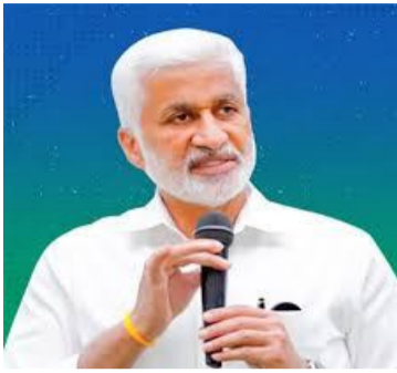
పెరుగుతోంది. ధరలు రోజు రోజుకూ చుక్కలను తాకుతూ మధ్యతరగతి జీవి నష్టం విరుస్తున్నాయి. ఈ నేపథ్యంలో మాజీ ఎంపీ

అమరావతి: పెరుగుతున్న ద్రవ్యోల్బణాన్ని దృష్టిలో పెట్టుకుని మాజీ ఎంపీ విజయ సాయిరెడ్డి ఏపీ ప్రభుత్వానికి ముఖ్య సూచన చేశారు. రాష్ట్రంలోని పేద కుటుంబాలకు కనీస ఆదాయాన్ని అందించే.. సాంకేతిక ప్రాథమిక ఆదాయం పథకాన్ని అమలు చేయాలని సూచించారు. దీని వేరుగా రాష్ట్రంలోని 85 లక్షల కుటుంబాలకు వేరుగా ప్రయోజనం చేకూరుతుందని.. ప్రస్తుతం అమలు చేస్తున్న సంక్షేమ పథకాలకు అయ్యే ఖర్చు కంటే.. దీనిని అయ్యే వ్యయం తక్కువనూర్చు విజయ సాయిరెడ్డి. ఆయన జ్వాలాబతి పథకాన్ని 2019లో న్యాయ పేరుతో రాహుల్ గాంధీ ప్రకటించారు. ద్రవ్యోల్బణం