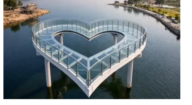
సిద్దిపేట జిల్లా హుస్సాబాద్ లోని చెరువులో కార్యక్రమం నాటి ఎల్లమ్మ చెరువులో దీనిని ఏర్పాటు చేస్తున్నారు. రాష్ట్ర ప్రభుత్వం ఎల్లమ్మ చెరువు సుందరీకరణ చేపట్టగా.. ఈ గ్లాస్ బ్రిడ్జిని 4.22 కోట్లతో 5 అడుగు వెడల్పు, 150 మీటర్ల పొడవుతో లవ్ సింబల్

సిద్దిపేట : తెలంగాణలో తొలి గ్లాస్ బ్రిడ్జి సిద్ధమవుతోంది. సిద్దిపేట జిల్లా హుస్సాబాద్ లోని చెరువులో దీనిని ఏర్పాటు చేస్తున్నారు. లవ్ సింబల్ ఆకారంలో చూడటానికి బావుంది.. ఈ బ్రిడ్జి పనులు ప్రస్తుతం కొనసాగుతున్నాయి. అయినా సరే జనాలు ఈ బ్రిడ్జిని చూడటానికి తరలి వస్తున్నారు. అన్ని కుదిరితే రెండు, మూడు నెలల్లో ప్రారంభించే అవకాశం ఉందని చెబుతున్నారు. ఈ గ్లాస్ బ్రిడ్జి దగ్గర ప్రజల కోసం ప్రత్యేక ఏర్పాట్లు చేస్తున్నారు. తెలంగాణలో తొలి గ్లాస్ బ్రిడ్జి రూపుదిద్దుకుంటోంది. రవాణా మంత్రి పొన్నం ప్రభాకర్ ప్రాతినిధ్యం వహిస్తున్న