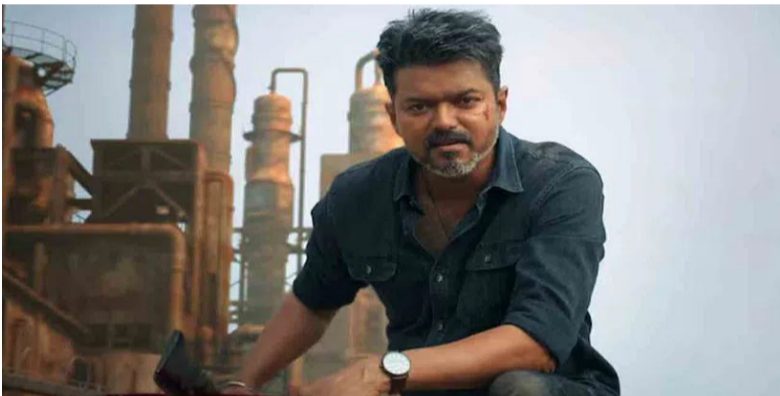
సోషల్ మీడియాలో వైరల్ అయింది. ముఖ్యంగా ఇంట్రాక్షన్ సీన్స్లో మార్పులు చేస్తున్నారని వార్తలు అభిమానుల్లో చర్చనీయాంశం అయింది. అయితే చిత్ర పర్షనల్లు ఈ వార్తలను పూర్తిగా ఖండించాయి. ఎన్నికల ఫలితాల తర్వాత కూడా సినిమాలో ఎలాంటి మార్పులు చేయలేదని, విజయ్ పేరుకు

తమిళ రాజకీయాల్లో సంవలనం సృష్టించిన స్టార్ హీరో విజయ్ ఇప్పుడు తమిళనాడు ముఖ్య మంత్రిగా బాధ్యతలు చేపట్టి ఆధ్యాత్మికంగా ప్రారంభించారు. ఆయన స్థాపించిన సంవలనం అసెంబ్లీ ఎన్నికల్లో ఘనవిజయం సాధించడంతో దక్షిణాది రాజకీయాల్లో భారీ చర్చకు దారి తీసింది. ఇదే సమయంలో విజయ్ చివరి సినిమాగా తెరకెక్కించిన 'జననాయగన్' పై అభిమానుల్లో ఆసక్తి మరింత పెరిగింది. మొదట ఈ చిత్రాన్ని జనవరిలో విడుదల చేయాలని ప్లాన్ చేసినప్పటికీ, సెన్సార్ సంబంధిత సమస్యల కారణంగా రిలీజ్ వాయిదా పడింది. ప్రస్తుతం ఈ అడ్డంకులను స్వయంగా విజయ్ పరిష్కరిస్తున్నారని, త్వరలోనే సినిమా విడుదలకు సంబంధించిన అధికారిక ప్రకటన వచ్చే అవకాశముందని సమాచారం. వీరీజీఆపం ఇక విజయ్ ముఖ్యమంత్రి అయిన తర్వాత, సినిమాలో ఆయన పేరుకు ముందు ఉండే 'దళపతి' బిరుదును తొలగించి 'ముఖ్యమంత్రి విజయ్'గా చూపించబోతున్నారనే ప్రచారం