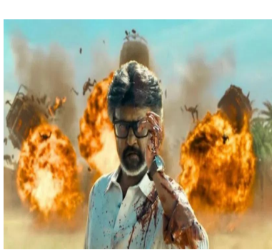
సమయంలో అనూహ్యంగా కరెంట్ షాక్ తగలడంతో సీలం జిల్లాకు చెందిన కార్మికుడు (28) అనే యువకుడు అక్కడికక్కడే ప్రాణాలు కోల్పోయాడు. ఈ ఘటనతో షూటింగ్ స్పాట్లో ఒక్కసారిగా విషాద వాతావరణం నెలకొంది. సమాచారం అందుకున్న కానెక్టర్ పోలీసులు వెంటనే అక్కడికి చేరుకుని దర్యాప్తు ప్రారంభించారు. మృతదేహాన్ని పోస్టుమార్టం నిమిత్తం ప్రభుత్వ ఆసుపత్రికి తరలించారు. ప్రాథమిక విచారణలో కరెంట్ లీకేజీ కారణంగానే ఈ ప్రమాదం జరిగినట్లు పోలీసులు గుర్తించినట్లు

సూపర్ స్టార్ రజనీకాంత్ హీరోగా దర్శకుడు నెల్లూర్ దిలీప్ కుమార్ తెరకెక్కించిన జైలర్ చిత్రం 2023లో విడుదలై బాక్సాఫీస్ వద్ద భారీ సంచలనం సృష్టించిన సంగతి తెలిసిందే. మోహన్ లాల్, శివరాజ్ కుమార్ కీలక పాత్రల్లో నటించిన ఈ చిత్రం ప్రపంచవ్యాప్తంగా రూ. 600 కోట్లకు పైగా వసూళ్లు సాధించి రికార్డులు క్రియేట్ చేసింది. మొదటి భాగం ఘన విజయం సాధించడంతో ఇప్పుడు జైలర్ 2ను మరింత భారీ స్థాయిలో తెరకెక్కిస్తున్నారు. సన్ పిక్చర్స్ నిర్మిస్తున్న ఈ సీక్వెల్లో రజనీకాంత్తో పాటు ఎన్టీ రాయ్, విద్యా బాలన్, మిథున్ చక్రవర్తి వంటి ప్రముఖులు నటిస్తున్నారని సమాచారం. ప్రస్తుతం సినిమా షూటింగ్ చివరి దశకు చేరుకుంది. అయితే తాజాగా 'జైలర్ 2' షూటింగ్ స్పాట్లో విషాదకర ఘటన చోటుచేసుకుంది. చెన్నైలో ఉన్న కోస్ట్ గార్డ్స్లోని పసయూర్ అధికారాన్ని ఫిల్మ్ సెటిల్లో ప్యావ్ చేస్తూ సన్నివేశాల చిత్రీకరణ జరుగుతుండగా ఈ ప్రమాదం జరిగింది. ఇంటి సెటిల్లో ఫ్యాన్లు బిగించే పనిలో ఉన్న