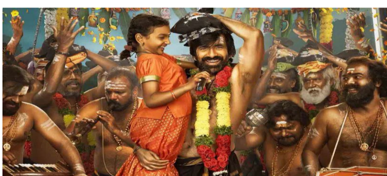
మాన్ మహారాజు రవితేజ హీరోగా, శివ నిర్వాణ దర్శకత్వంలో తెరకెక్కుతున్న భక్తి నేపథ్య చిత్రం 'ఇరుముడి' నుంచి ఒక అదిరిపోయే క్రేజీ అవినీట్ వచ్చింది. రెండు తెలుగు రాష్ట్రాల్లో ఎక్కడ అయ్యప్ప పడిపాటలు పులిపాల పల్లకి భజన పాటను సినిమాలో పెట్టాలని అభిమానులు నుండి, భక్తుల నుండి అత్యంత ప్రజాదరణ పొందిన ప్రెవేట్ భక్తి యూనిట్ స్పందించి, ఈ బనానిక్ సాంగ్ ను రీమిక్స్ రూపంలో ప్రేక్షకుల ముందుకు తీసుకురావడానికి సిద్ధమైంది.