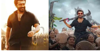
పోలీసులు అందులో 45 సవర్త రికవరీ చేసినప్పటికీ, ఆ బంగారాన్ని కోర్టు నుంచి ఇప్పిస్తానని చెప్పి బీబీ కృష్ణ ఆ పేద కుటుంబాన్ని చుట్టూ తిప్పుకుంటూ దబ్బులు గుంజేసుంటాడు. బీబీ కృష్ణ మోసాలకు వినిగిపోయిన మునిస్ట్రీ, కోర్టు అవరణలోని క్షేత్ర పాలకుడైన వీరభద్రుడిని పేదకుంటాడు. ఆ క్రమంలో బీబీ కృష్ణ.. వీరభద్రుడికి ఒక సవల్ ఇచ్చించుకుంటూ ఉంటాడు. ఇలాంటి ఉండగా.. ఏమాత్రం ఉపయోగించకుండా కేసుల ఒక సాధారణ లాయర్ గా ఈ కేసులో గెలిచి చూపించాలని సవల్ చేస్తాడు. మరి ఈ లివల్ బ్యాటిల్లో వీరభద్రుడు ఏం చేశాడు? మీను జీవితం ఎలాంటి మలుపు తిరిగింది? ఈ