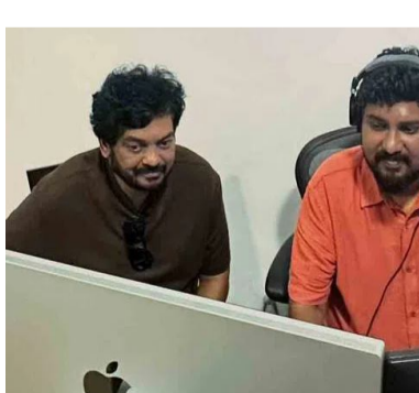
తోడవడంతో ఈ కాంబో థియేటర్లలో ఒక ఎక్స్ ప్రాజెక్ట్ విజువల్ ట్రీట్ ఇవ్వడం భార్యంగా కనిపిస్తోంది. ఈ భారీ చిత్రాన్ని పూరి కనెక్ట్ మరియూ జె.బి. మోషన్ పిక్చర్స్ బ్యానర్లపై

ద్వాషింగ్ డైరెక్టర్ పూరి జగన్నాథ్, ముక్త సెల్లన్ విజయ్ సేతుపతి కాంబినేషన్లో రాబోతున్న పాన్ ఇండియా యాక్షన్ ఎంటర్ టైన్మెంట్ 'స్లమ్ డాన్' -- 33 టెంపుల్ లోక్ ఇప్పటికే షూటింగ్ పూర్తిచేసుకున్న ఈ చిత్రం త్వరలోనే ప్రేక్షకుల ముందుకు రాబోతుంది. అయితే తాజాగా ఈ చిత్రానికి సంబంధించి పోస్ట్ ప్రొడక్షన్ శరవేగంగా జరుగుతున్నట్లు చిత్రబృందం ప్రకటించింది. ప్రస్తుతం ఈ క్రేజీ ప్రాజెక్టుకు సంబంధించిన పోస్ట్ ప్రొడక్షన్ మరీ యు రీ-రికార్డింగ్ పనులు అత్యంత శరవేగంగా జరుగుతున్నాయని, త్వరలోనే ఈ చిత్రం థియేటర్లలోకి రావడానికి సిద్ధమవుతోందని చిత్ర యూనిట్ తెలిపింది పూరి జగన్నాథ్ మార్క్ థియేటర్లలో గ్రాండ్గా విడుదల కానుంది.