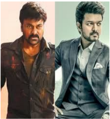
విజయ్ ను మొగ్గొకటి చిరంజీవి అభినందించారు. ఇటీవలే ముఖ్యమంత్రిగా బాధ్యతలు స్వీకరించిన విజయ్తో చిరంజీవి ఫోన్లో మాట్లాడారు. ఆయనకు అభినందనలు తెలిపారు. దివంగత నేత ఎంజీఆర్ తమిళ ప్రజల హృదయాల్లో ఎలాగైతే నిలిచిపోయారో, అలాగే విజయ్ కూడా ప్రజాకేంద్రీకృత

తమిళనాడు నూతన ముఖ్యమంత్రి జోసెఫ్ విజయ్ను మొగ్గొకటి చిరంజీవి ఫోన్ ద్వారా అభినందించారు. దివంగత నేత ఎంజీఆర్ తరహాలోనే విజయ్ కూడా ప్రజాదరణ పొందిన పాలన అందించాలని చిరంజీవి ఆకాంక్షించారు. దీనికి స్పందనగా విజయ్ కృతజ్ఞతలు తెలుపుతూ, చిరంజీవి తాజా చిత్రం 'మోగా 158'కు కుభాకాంక్షలు తెలిపారు. ఇద్దరు ఆగ్ర కథానాయకుల మధ్య జరిగిన ఈ ఆతీయ సంభాషణ ఇప్పుడు దక్షిణాది రాజకీయ, సిని వర్గాల్లో హాట్ టాపిక్ గా మారింది. 'ఎంజీఆర్'లా పాలించాలి.. సీఎం జోసెఫ్ విజయ్తో ఫోన్లో మాట్లాడిన చిరంజీవి మిగతా ముఖ్య మంత్రిగా కోల్పోవడం స్టార్ హీరో దళపతి విజయ్ పదవీ బాధ్యతలు చేపట్టిన సంగతి తెలిసిందే. ప్రమాణ స్వీకారం చేసిన రోజునుంచే సంవలన నిర్ణయాల్లో ఆందోలనం దృష్టిని ఆకర్షిస్తున్నాడు. సీనియర్ సీఎం స్థాయికి ఎదిగిన విజయ్ కు సీనియర్ ప్రముఖులందరూ శుభాకాంక్షలు తెలియజేస్తున్నారు. తాజాగా