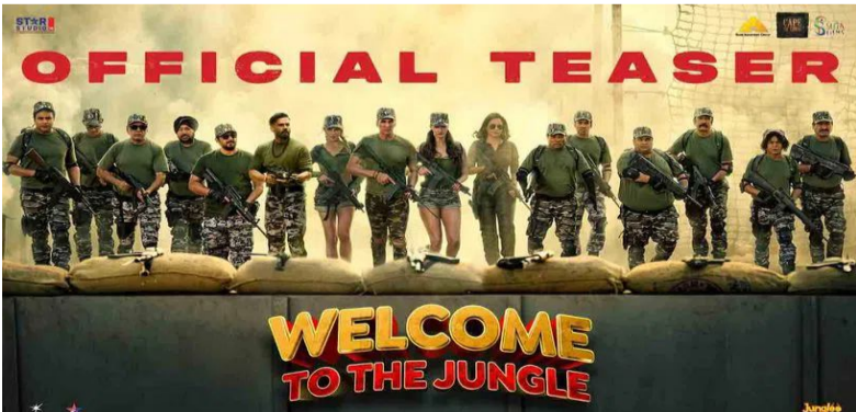
ఫెర్మాండెజ్, దిశా పటాని, జానీ లీవర్, ఖాన్ దర్శకత్వం వహించగా, ఫిరోజ్ ఎ. కపూర్ తదితరులు నటిస్తున్నారు. దాదాపు రెండు దశాబ్దాల తర్వాత అక్షయ్ కుమార్ -- రవీనా టాండన్ క్రేజీ కాంబినేషన్ ఈ సినిమాతో తిరిగి రావడం విశేషం. భారీ బడ్జెట్ మరియూ హై-టెక్నో వీవీఎక్స్

బాలీవుడ్ స్టార్ హీరో అక్షయ్ కుమార్ నటిస్తున్న మోస్ట్ అవేటెడ్ కామిక్ ఎంటర్టైన్మెంట్ 'వెల్కమ్ టు ది జంగిల్' అఫీషియల్ టీజర్ నేడు విడుదలైంది. ప్రముఖ 'వెల్కమ్' ప్రాంజెక్టులో భాగంగా మూడో భాగంపై ప్రేక్షకుల్లో భారీ అంచనాలు ఉండగా, తాజాగా విడుదలైన టీజర్ ఆ అంచనాలను మరింత పెంచేసింది. దట్టమైన అడవి నేపథ్యంలో సాగే యాక్షన్, అంతులేని కామెడీ, మరియూ భారీ విజువల్స్ ఈ టీజర్లో ప్రధాన ఆకర్షణగా నిలిచాయి. బాలీవుడ్ 'ఫిలామ్' అక్షయ్ కుమార్ తన పాత వింటేజ్ కామెడీ టైటిల్తో అలరించడానికి సిద్ధమయ్యారని ఈ టీజర్ చూస్తే స్పష్టమవుతోంది. ఈ సినిమా ప్రత్యేకత ఏమిటంటే, బాలీవుడ్ కు చెందిన దాదాపు 30 మందికి పైగా పాపూలర్ నటీనటులు ఇందులో ఒకే ప్రేమలో స్ట్రీట్ పేర్ చేసుకుంటున్నారు. ముఖ్య పాత్రల్లో అక్షయ్ కుమార్ తో పాటు సునీల్ తెల్లి, పరీష్ రావల్, అర్జున్ వార్మి, జాకీ ష్రాఫ్, రవీనా టాండన్, లారా రద్దీ, జాక్వెలిన్