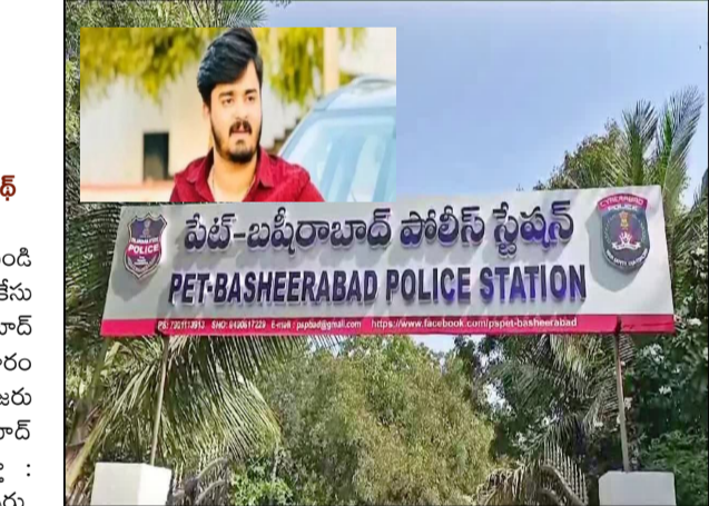
75, పోక్సో చట్టంలోని సెక్షన్ 11 రెడీవీ 12 కింద గత శుక్రవారం కేసు నమోదు చేశారు. తదనంతర పరిణామాల నేపథ్యంలో బాధితుల వాంగ్మూలం ఆధారంగా పోక్సో చట్టంలోని కలిపి 5(1) రెడీ వి 6 సెక్షన్ ను కూడా చేర్చారు.

హైదరాబాద్ : పోక్సో కేసులో పోలీసుల విచారణకు కేంద్రమంత్రి బండి సంజయ్ కుమారుడు బండి భగీరథ్ గైరహాజరు. పోక్సో కేసు విచారణ కోసం (బుధవారం) మధ్యాహ్నం 2 గంటలకు పేట్ బషిరాబాద్ పోలీసు స్టేషన్ లో హాజరు కావాలని ఆయనకు పోలీసులు మంగళవారం నోటీసులు జారీ చేసిన విషయం తెలిసింది. బండి భగీరథ్ హాజరు కాకుండా ఎల్లండి విచారణకు హాజరవుతానని పేట్ బషిరాబాద్ పోలీసులకు మెయిల్ పంపారు. పోలీసుల విచారణకు నహకరిస్తా : ఎల్లండి పోలీసుల ఎదుట విచారణకు హాజరవుతానని పేర్కొన్నారు. పోలీసుల విచారణకు పూర్తిగా నహకరిస్తామని మెయిల్ లో పేర్కొన్నారు. తన వద్ద ఉన్న అన్ని ఆధారాలను పోలీసులకు ఇస్తామని భగీరథ్ తెలిపారు. భాధితుల వాంగ్మూలం తర్వాత సెక్షన్లు మార్పు : బాధితుల తల్లి ఇచ్చిన కంప్లెంట్ ఆధారంగా బీఎన్ఎస్ లోని సెక్షన్ 74,