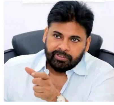
పవన్ కల్యాణ్ పిఠాపురం నియోజకవర్గంలోని ప్రభుత్వ పాఠశాలల్లో ఉన్నత విద్య అందించేందుకు చర్యలు ప్రారంభించారు.

ఉండేందుకు పూర్తి స్థాయి విద్యా భరోసా కల్పించాలనే లక్ష్యంతో ఈ కార్యక్రమాన్ని రూపొందించారు. విద్యార్థుల ఆసక్తికి తగ్గ కోర్సుల ఎంపిక.. విద్యార్థుల ప్రభుత్వ, ఆసక్తి, భవిష్యత్తు లక్ష్యాలను దృష్టిలో ఉంచుకుని కోర్సులను ఎంపిక చేసేలా ప్రత్యేక విధానం రూపొందించారు. ఇంజనీరింగ్, మెడిసిన్, సైన్స్, కామర్స్, ఆర్ట్స్ వంటి విభాగాల్లో విద్యార్థులు తమకు సన్నిహిత కోర్సులను ఎంపిక చేసుకునే అవకాశాన్ని కల్పించనున్నారు. ప్రతి విద్యార్థికి కౌన్సిలింగ్ నిర్వహించి, వారి సామర్థ్యానికి తగిన విద్యా మార్గదర్శకత్వాన్ని అందించేందుకు కూడా ఏర్పాట్లు చేస్తున్నట్లు సమాచారం. పవన్ కల్యాణ్ చొరవతో ముందుకొచ్చిన విద్యా సంస్థలు ముందుకు వచ్చినట్లు తెలుస్తోంది. ఈ కార్యక్రమం ద్వారా గ్రామీణ ప్రాంతాల్లోని ప్రతిభావంతులైన విద్యార్థులకు నాణ్యమైన విద్య అందుబాటులోకి వచ్చే అవకాశం ఉంది. పిఠాపురాన్ని రోల్ మోడల్ గా తీర్చిదిద్దే లక్ష్యంతో పిఠాపురం నియోజక వర్గాన్ని విద్య, ఆరోగ్యం, మౌలిక వసతులు, ఉపాధి వంటి అన్ని రంగాల్లో ఆదర్శ నియో