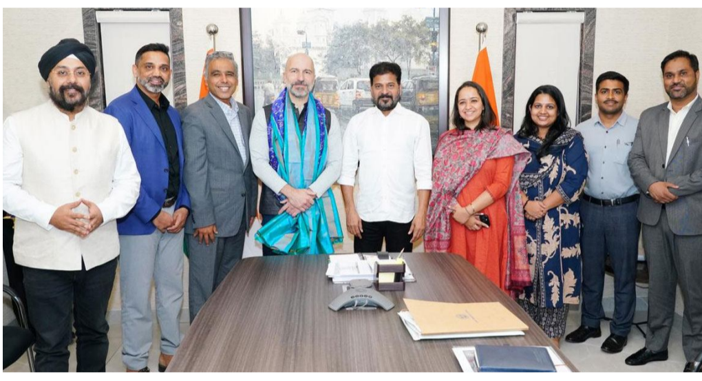
సూచనపై సమగ్ర అధ్యయనం చేస్తామని ఉబర్ ప్రతినిధులు సహకరిస్తుందని ఉబర్ ప్రతినిధులకు సీఎం రేవంత్ రెడ్డి హామీ తెలిపారు. వ్యాపార విస్తరణకు అనువిధాలుగా రాష్ట్ర ప్రభుత్వం ఇచ్చారు.