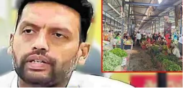
ప్రధాన లక్ష్యం. సి.క్యాంపు రైతు బజార్ లో ప్రస్తుతం ఉన్న రద్దీని దృష్టిలో ఉంచుకుని, అత్యధునిక సౌకర్యాలతో దీనిని విస్తరిస్తున్నాం. ఈ పనులను పన్ను తొప్పిది నెలల కాలం పరిమితిలో పూర్తి చేస్తాం. ఇందుకోసం అధికారం దిశా నిర్దేశం చేశాం.