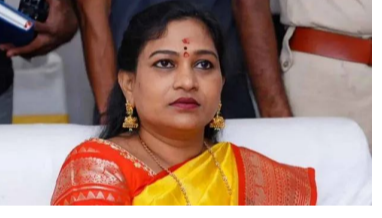
కృష్ణా జిల్లా, మే 11: గత ఐదేళ్లు వైసీపీ హయాంలో పోలీసులను నడిరోడ్డుపై నిలబెట్టారని హోంమంత్రి చంద్రబాబు అనిత, కొల్లు రవీంద్ర పాల్గొన్నారు. సోమవారం పెనమలూరు నియోజకవర్గం కంకిపాడు మండలంలో ఏర్పాటు చేసిన సూతన పోలీస్ స్టేషన్ భవనాన్ని హోంమంత్రి ప్రారంభించారు. ఈ సందర్భంగా