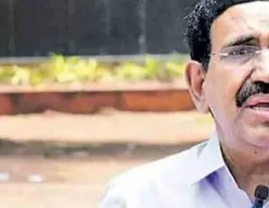
రోజు బహిరంగ సభగా జరగనుంది. ఏర్పాట్లు చేస్తున్నాం. కమిటీల ప్రతినిధుల సమావేశంలో బాధ్యతలపై దిశా నిర్దేశం చేస్తాం. మహానాడును చరిత్రలో నిలిపేలా

నెల్లూరు, మే 11: ఈనెల 13న ప్రారంభమయ్యే పార్టీ మహానాడుకు శరవేగంగా ఏర్పాట్లు జరుగుతున్నాయి. ఈ కార్యక్రమం జరగనున్న కిసాన్ సేజ్ ప్రాంతాన్ని పురపాలక శాఖ మంత్రి నారాయణ, ఎమ్మెల్యే ప్రశాం తిరెడ్డి, ఎమ్మెల్యే బీద రవిచంద్ర పరిశీలించారు. సభాప్రాంగణం, పార్కింగ్, భద్రతా ఏర్పాట్లపై సమగ్ర సమీక్ష చేశారు. మూడు రోజుల పాటు జరిగే మహానాడులో కీలక తీర్మానాలు చేస్తారని మంత్రి నారాయణ తెలిపారు. 'మహానాడు సుపరిపాలనకు దోహదపడే విధంగా నిర్వహించాలి. తొలి రెండు రోజులు పార్టీ డెలిగేట్స్, మూడో