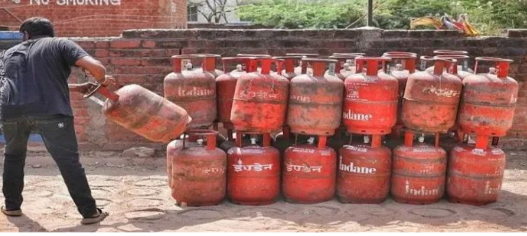
కంపెనీల గుర్తింపు పేరుతోనే వస్తాయని వెల్లడించాయి. అందులో 4 అంకెల ఓటీపీ మాత్రమే ఉంటుందని పేర్కొన్నారు. ఆ కోడ్ కేవలం నిలిండ్ల డెలివరీ సమయంలో సంబంధిత సిబ్బందికి చెప్పాలని స్పష్టం చేశాయి. ఫోన్ కాల్స్, వాట్సాప్ లేదా ఇతర అనుమానాస్పద లింకెడ్ ద్వారా ఎవరు ఓటీపీ అడిగినా స్పందించద్దని సూచించాయి.

ప్రెజ్ లియం ఇండియన్ ఆయిల్ కార్పొరేషన్ భారత్ పెట్రోలియం వంటి కంపెనీలు వినియోగదారులను అప్రమత్తం చేశాయి. గ్యాస్ నిలిండ్ల డెలివరీ పేరుతో నకిలీ ఎస్ఎమ్ఎస్ లు, వాట్సాప్ నంబర్లను పంపిస్తూ కేటు గ్యాస్ కస్టమర్ల నుంచి ఓటీపీ, డీఎస్ఎంఎస్ అధినిటీషన్ కోడ్ల ద్వారా సొమ్ము చేసుకునేందుకు ప్రయత్నిస్తున్నారని వివరించాయి. ఇటీవలి కాలంలో.. సైబర్ నేరగాళ్లు గ్యాస్ ఏజెన్సీ ప్రతినిధులుగా వర్తించుకుంటూ కస్టమర్లకు ఫోన్ చేస్తున్నారని వినియోగదారులకు సూచనలు వినియోగదారులను.. 'కేవలం ఆఫ్ లైన్ చేయాలి, ఆధార్ లింక్ చేయాలి.. తరువాత కనెక్షన్ నిలిపివేస్తాం' లాంటి మాటలతో ఓటీపీలు అడుగుతున్నట్లు తెలుస్తోంది. కొందరికి ఆఫ్ లైన్ లో ఎల్ ఓటీ డెలివరీ మెసేజ్ లాగా ఫేక్ నంబర్లు పంపి, అందులోని కోడ్ ను చెప్పాలని అడుగుతున్నారని చమురు సంస్థలు తెలిపాయి. అధికారిక డెలివరీ మెసేజ్ లు ఎల్లప్పుడూ ఆయా