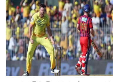
చెన్నై సూపర్ కింగ్స్ ప్రస్తుతం పాయింట్ల పట్టి కలలో ఐదో స్థానంలో కొనసాగుతోంది. లక్ష్మీ సూపర్ కెయింట్స్ పై విజయం తర్వాత ఆరో స్థానంలో ఉన్న సీఎస్సీ.. రాజస్థాన్ రాయల్స్ కిందకి నెట్టిసి ఐదో స్థానానికి వచ్చే సూపర్ కింగ్స్ ఆరు మ్యాచ్ లో గెలిచి, ఐదు మ్యాచ్ లో ఓడింది. మొత్తం 12 పాయింట్లతో ఐదో స్థానంలో కొనసా గుతోంది. పాయింట్స్ టేబుల్ లో సీఎస్సీకి పైన ఉన్న నాలుగు జట్లలో ఆర్గీబీ, సన్ రైజర్స్, గుజరాత్ టైటాన్స్ 14 పాయింట్లతో కొనసాగు తుం దా.. పంజాబ్ కింగ్స్ 13 పాయింట్లతో ఉంది. ప్లే ఆఫ్ లో ఏ జట్టు అయినా ఆరు గుపెట్టడం కచ్చితంగా 16 పాయింట్లు కచ్చితంగా

ఐపీఎల్ 2026లో తొలి మూడు మ్యాచ్ లు ఓడిన సీఎస్సీ. ఇప్పుడు వరుసగా మూడు మ్యాచ్ లు గెలిచి ప్లే ఆఫ్ రేసులో దూసుకెళ్లింది. చెన్నై సూపర్ కింగ్స్ ప్రస్తుతం 12 పాయింట్లతో ఐదో స్థానంలో ఉండగా.. ప్లే ఆఫ్ లో అడుగుపెట్టాలంటే ఇంకో నాలుగు పాయింట్లు కావాలి. సీఎస్సీ తన చివరి మూడు మ్యాచ్ లో రెండు కచ్చితంగా గెలిచి తీరాల్సింది. సీఎస్సీ తన చివరి మ్యాచ్ లను లక్ష్మీ సన్ రైజర్స్ హైదరాబాద్, గుజరాత్ టైటాన్స్ తో ఆడనుంది. వరుసగా మూడు పరాజయాలతో ఈ సీజన్ ను ఆరంభించిన చెన్నై సూపర్ కింగ్స్ ఇప్పుడు హ్యాట్రిక్ విక్టరీతో ప్లే ఆఫ్ రేసులోకి దూసుకెళ్లింది. అనలు అట్టడుగు స్థానంలో చివరి ఓవర్లో రొమారీయో షెవర్ట్ ఔటయ్యాక 15 రన్స్ అవసరమైన వేళ.. రాజ్ బవ వైడ్, నో బాల్ వేయగా నాలుగో బంతిని కవర్ డిశగా భువి స్టాండ్స్ లోకి పంపాడు. ఆ సిక్సర్ తో ముంబై ఆశలు ఆవిరయ్యాయి.. ఐదో బంతికి సింగిల్, ఆరో బంతికి రెండు పరుగులు రాగా బెంగళూరు 8 వికెట్ల తేడాతో గెలుపొందింది.