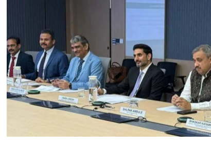
సింగపూర్/అమరావతి, మే 11: సింగపూర్ లో విద్య, ఐటీ శాఖల మంత్రి నారా లోకేశ్ పర్యటన కొనసాగుతోంది. సింగపూర్ లో జాయింట్ ఇన్వెస్ట్ మెంట్ ఫండ్ స్కీం కమిటీ సమావేశంలో మంత్రి పాల్గొన్నారు. ఈ సందర్భంగా అమరావతిలో వుంగోల్ తరహా ఇంటిగ్రేటెడ్ టౌన్ షిప్ నిర్మించనున్నట్లు తెలిపారు. భారత దేశంలో ముఖ్యమంత్రి నారా చంద్రబాబు నాయుడు కర్నూలు పర్యటన సందర్భంగా ఇచ్చిన హామీని నెరవేరుస్తూ.. సుమారు 6 కోట్ల రూపాయల వ్యయంతో ఈ విస్తరణ పనులను చేపట్టారు. ఈ సందర్భంగా మంత్రి లోకేశ్ మాట్లాడుతూ.. 'రైతులకు, వినియోగదారులకు మెరుగైన వసతులు కల్పించడమే ప్రభుత్వ దృష్టిలో మైన్ పాయింట్. ఇన్వెస్ట్ మెంట్ ఫండ్ స్కీం, ఇన్ఫ్రాస్ట్రక్చర్, పన్ను తెలిపారు.

సింగపూర్ లో ఫున్ స్కాగ్ తం. సింగపూర్ చేరుకున్న మంత్రి నారా లోకేశ్ కు ప్రవాసాంధ్రులు స్వాగతం పలికారు. రాయల్ ఎన్ ఫోర్స్ కంపెనీని రాష్ట్రానికి తీసుకురావడంపై మంత్రికి ప్రవాసాంధ్రులు ధన్యవాదాలు తెలిపారు. ప్రవాసాంధ్రులను ఉద్దేశించి లోకేశ్ మాట్లాడుతూ.. 'మీరంతా రాష్ట్రానికి బ్రాండ్ అంబాసిడర్లుగా మారాలి. మీరు పనిచేస్తున్న కంపెనీల్లో ఆంధ్రప్రదేశ్ లో జరుగుతున్న అభివృద్ధి, పన్ను తెలిపారు.