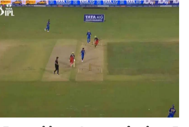
పిన్ మధ్యలోనే ఉండిపోయాడు. దీంతో లాంగ్ ఆన్ ఫీల్డర్ .. నాన్ ప్రయుక్త దిశకు బంతిని విసలేకపోయాడు. అంటే నాన్ ప్రయుక్త దిశగా విసిరి ఉంటే, బ్యాట్ రిటెయిన్ చేశాడు. దాని వల్ల మ్యాచ్ సూపర్ ఓవర్ లోకి వెళ్లింది. ఈ ఘటనకు కారణం వీడియో ఒకటి ఆన్ లైన్ లో పోస్ట్ చేశారు. ముంబై ఇండియన్స్ స్టాండ్ ఇన్ కెప్టెన్ సూర్యకుమార్ యాదవ్ మాట్లాడుతూ.. బవకు చివరి ఓవర్ ను ఇవ్వడాన్ని సమర్పించు కు న్నాడు. యువ క్రెడిటర్ ను నిందించలేదు. బవ మంచి ఆల్ రౌండ్ అని, చాలా ప్రాక్టీస్ చేశాడని, జట్టు విజయం కోసం అతను కృషి చేసినట్లు చెప్పాడు. ఈ ఓటమితో ముంబై ఇండియన్స్ జట్టు ప్లే ఆఫ్ రేసు నుంచి బయటపడింది.