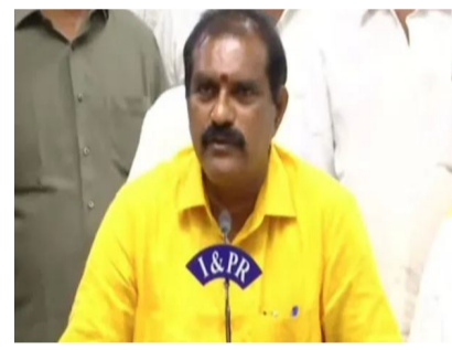
అనుసంధానం చేసుకుంటే అన్ని సమస్యలకు పరిష్కారం దొరుకుతుందని మంత్రి తెలిపారు. గోదావరి కావేరి ఏ విధంగా ఇంటర్ లింకింగ్ చేయాలన్న దానిపై యాక్స్ ప్లాన్ సిద్ధం చేస్తున్నామని చెప్పారు. గోదావరిలో ప్రతి సంవత్సరం సుమారు 3000 టిఎంసీల వరద నీరు వృధాగా సముద్రంలో కలుస్తోందన్నారు.

ఏపీని కరవు రహితంగా మార్చడంలో పోలవరం కీలకమని మంత్రి తెలిపారు. వైసీపీ పాలనలో పోలవరం ప్రాజెక్టును ప్రస్తావన చేశారని విమర్శించారు. పోలవరం సివిల్ వర్క్స్, ఆర్ అండ్ ఆర్ అంశాలను కేంద్ర మంత్రికి వివరించామన్నారు. తొలి దశలో 41.15 మిల్లర్ల ఎత్తుకు నీటిని నిల్వ చేసేందుకు అవసరమైన నిర్మాణాలు పూర్తి చేయడంలో కేంద్రం సహకరించాలని ముఖ్యమంత్రి కోరారున్నారు. గత ఏప్రిల్ నాటికి కొత్త డయాఫ్రమ్ వాల్ నిర్మాణం పూర్తయిందని తెలిపారు. తుంగభద్ర ప్రాజెక్టు గేట్లు ప్రమాదకర స్థితిలో ఉన్నాయని, వైసీపీ పాలనలో వాటిని పట్టించుకోలేదని మంత్రి ఆరోపించారు. గత ఏడాది 19వ గేటు కొట్టుకుపోయిందని.. కొత్త గేట్ల ప్రారంభోత్సవంపై కేంద్ర మంత్రితో చర్చించామని వెల్లడించారు. గోదావరి కావేరి