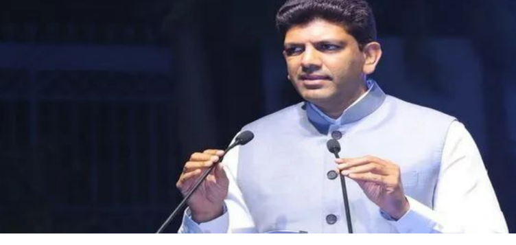
అవకాశాలు పెరుగుతాయని వివరించారు. నడికుడి లేదా పిడుగురాళ్ల స్టేషన్లలో వందేభారత్ ఎక్స్ ప్రెస్ (సికింద్రాబాద్ - తిరుపతి) నిలపాలని విజ్ఞప్తి చేశారు. లింగంపల్లి - విజయవాడ ఎక్స్ ప్రెస్ (12796) హబ్లింగ్ కోసం కేంద్రమంత్రికి ఎంపీ వినతిపత్రం అందజేశారు. విజయవాడ - బెంగళూరు మధ్య కొత్తగా వందేభారత్ కోరారు.

నాలు హైల్యాండ్ షైఫ్ట్ కింద ఉన్న రెండు లైన్ల సర్కిల్ రోడ్, యూటర్న్ ద్వారా వెళ్లాల్సి వస్తోందని తెలిపారు. దీంతో గంటల తరబడి డ్రాఫ్ట్ నిలిచిపోవడం, లక్షలాది మంది ప్రయాణికులు ఇబ్బంది పడుతున్నారని పెమ్మసాని చంద్రశేఖర్ పేర్కొన్నారు. అక్సిన్ వైప్లతో ఎంపీ లావు శ్రీకృష్ణదేవరాయలు భేటీ. రైల్వే శాఖ మంత్రి అక్సిన్ వైప్లతో తెలుగుదేశం ఎంపీ లావు శ్రీకృష్ణదేవరాయలు భేటీ అయ్యారు. ఈ సమావేశంలో పలు కీలక అంశాలపై చర్చించారు. పల్నాడు అభివృద్ధికి సంబంధించి కీలక రైల్వే ప్రాజెక్టులపై మాట్లాడారు. పిడుగురాళ్ల - సావల్యపురం నుంచి రామాదుపట్నం పోస్టుకు రైల్వేలైన్ నిర్మించాలని ఎంపీ విజ్ఞప్తి చేశారు. రామాదుపట్నం పోస్టు కనెక్టివిటీతో పల్నాడులో పారిశుధ్యం, ఉపాధి