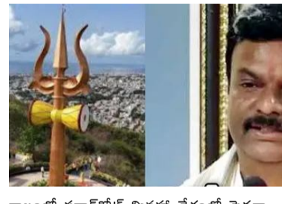
కాలంలో హాన్ కోట్ మినహా దేశంలో పెద్దగా