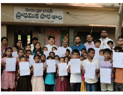
నమస్తే భారత్ :- మురిపెడ సీతారాంపురం ప్రాథ