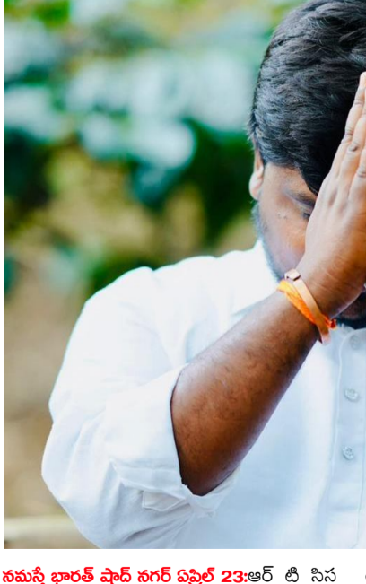
నమస్తే భారత్ షిర్ 6గర్ ఏప్రిల్ 23: ఆర్ టీ సి స

యదం తీవ్రంగా కలచివేసి విషయం. తమ డి మ్మె నేవద్దంలో వరంగల్ జిల్లా నర్సంపేట బ స్టాండ్ ఎదుట ఓ డ్రైవర్ ఆత్మహత్యాయత్నం చే యదం తీవ్రంగా కలచివేసి విషయం. తమ డి మ్మె నేవద్దంలో వరంగల్ జిల్లా నర్సంపేట బ స్టాండ్ ఎదుట ఓ డ్రైవర్ ఆత్మహత్యాయత్నం చే