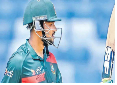
నమస్తే భారత్ :- సొంతగడ్డపై న్యూజిలాండ్తో జరి

గిన మూడు మ్యాచుల వన్డే సిరీస్ను బంగ్లాదేశ్ 2-1తో దక్కించుకుంది. తొలి వన్డేలో ఓడన్ పుట్టి రెండో మ్యాచ్లో పుంజుకున్న ఆ జట్టు.. గురువారం సిరీస్ విజేతను నిర్ణయించే యందుకు జరిగిన మూడో పోరులో ఆల్ రౌండ్ ప్రదర్శనతో సత్తాచాటి 55 రన్లు తేడాతో ప్రత్య థ్విని చిత్తుచేసింది. మొదట బ్యాటింగ్ చేస్తూ నజ్మల్ హోస్సేన్ శా