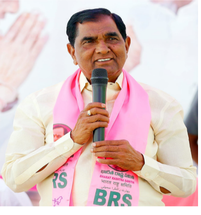
నమస్తే భారత్ పార్టీ నగర్ ఏప్రిల్ 23: అలంకారం