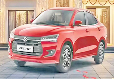
న్యూఢిల్లీ, ఏప్రిల్ 23: కార్ల తయారీలో అగ్రగామి సంస్థయైన మారుతి సుజుకి మరో రికార్డును