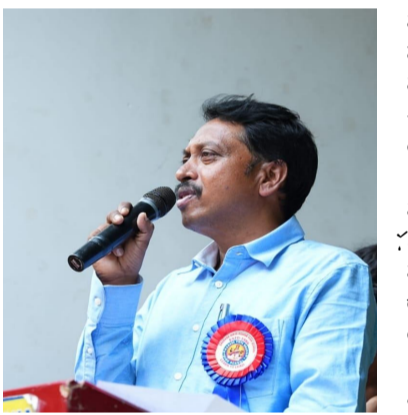
సామాజిక శాస్త్రవేత్త, జాతీయ డైరెక్టర్ ప్రపంచ