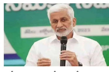
హామీలను అమలు చేయడంలో విఫలమైందని విమర్శించారు. రాజధానిని ఏకీకృత, దశల వారీగా నిర్మించాలని సూచించారు.

అమరావతి : ఏపీ రాజధానిపై మాజీ ఏపీ విజయసాయి రెడ్డి మరోసారి స్పందించారు. అమరావతి నిర్మాణానికి పలు సూచనలు చేస్తున్న వైసీపీ ప్రతిపాదించిన మార్గం నేరమానంపై విమర్శలు గుప్పించారు. ఈ క్రమంలో ఢిల్లీ నిర్మాణం తీరును ఆయన గుర్తు చేశారు. లక్షల కోట్ల అంచనాలతో అమరావతి ప్రణాళిక ఉండవచ్చు. అప్పులపై ఆధారపడి కాపీ టల్ సీడీని నిర్మించడం సరిదా న్నారు. రాజధాని రైతులకు ప్రభుత్వం ఇచ్చిన