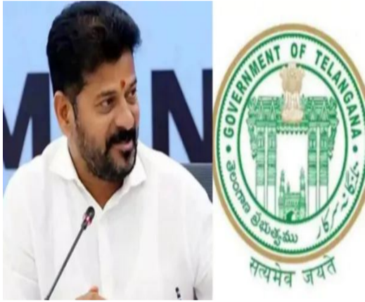
భూముల రక్షణ, కార్మికుల పెన్షన్లకు కృషి చేశారని మంత్రి గుర్తు చేశారు.

హైదరాబాద్, ఏప్రిల్ 19: తెలంగాణలోని భవన నిర్మాణ రంగం సహా అన్ని రంగాల కార్మికులకు రాష్ట్ర ప్రభుత్వం గుడ్ న్యూస్ చెప్పింది. కార్మికులను ఆదుకునేందుకు కాంగ్రెస్ ప్రభుత్వం కృషి చేస్తోంది. మంత్రి వివేక్ వెంకటస్వామి తెలిపారు. అందుకు తగినట్లుగా చర్యలు చేపడుతున్నట్లు పేర్కొన్నారు. ఏప్రిల్ 19 ఆదివారం సిద్దిపేటలోని కాంగ్రెస్ పార్టీ ఆఫీస్ లో నిర్వహించిన కార్యక్రమంలో మంత్రి వివేక్ వెంకటస్వామి మాట్లాడుతూ పలు కీలక హామీలు ఇచ్చారు. రాష్ట్రంలోని భవన నిర్మాణ రంగ కార్మికులను తెలంగాణ కాంగ్రెస్ ప్రభుత్వం ఆదుకుంటుందని అన్నారు. వారి పెన్షన్ల అంశంపై ఈ మేరకు మంత్రి వివేక్ వెంకటస్వామి సానుకూలంగా స్పందించారు. త్వరలోనే వీరికి పింఛన్లు అందించేలా చర్యలు తీసుకుంటామన్నారు. అంతేకాక రాష్ట్రంలోని ప్రతి జిల్లాలో కార్మిక సంఘాల కోసం ప్రత్యేక భవనాలను నిర్మిస్తామని హామీ ఇచ్చారు. సింగరేణి కార్మికుల సంక్షేమానికి మా నాన్న కాక వెంకటస్వామి తీవ్రంగా కృషి చేశారని.. అప్పట్లో సీఎం నరసింహారావుతో కొట్లాడి సింగరేణి