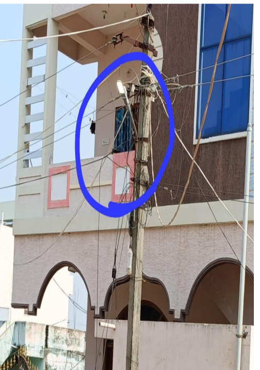
నమస్తే భారత్ :-మరిపెడ

పగటిపూట వెలిగిన వీధి దీపాలపై కౌన్సిలర్ ఆగ్రహం