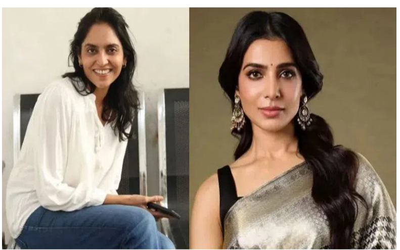
అక్కినేని ఫ్యామిలీ చిత్రానికి బెస్ట్ విషెస్ అందించిన సమంత.. మూవీ బ్లాక్ బస్టర్ అంటూ కామెంట్