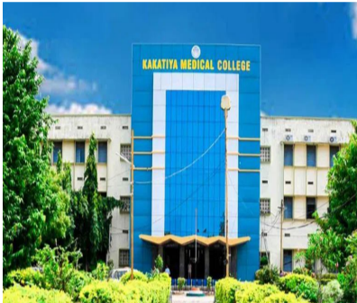
వరంగల్ : వరంగల్ లోని కాకతీయ మెడికల్ కాలేజీలో ర్యాగింగ్ కలకలం రేపింది. సోషల్ మీడియాలో సీనియర్లపై కామెంట్స్ చేసిన ధర్మ ఇయర్ విద్యార్థులకు యాంటీ ర్యాగింగ్ కమిటీ

చర్యలుకు సిఫారసు చేసింది. వాటిని కఠినంగా అదుపు చేసింది. ప్రాథమికంగా అందిన సమాచారం ప్రకారం వాట్సాప్ గ్రూప్ లో సీనియర్లపై కామెంట్స్ చేశారని ద్వితీయ సంవత్సరం విద్యార్థులను ర్యాగింగ్ పేరుతో ధర్మ ఇయర్ విద్యార్థులు మోకాళ్లపై కూర్చోబెట్టారు. బాధిత విద్యార్థులు ఈ విషయాన్ని కళాశాల యాంటీ ర్యాగింగ్ కమిటీకి వివరాలు తెలిపారు. ఫిర్యాదు ఆధారంగా కమిటీ విచారణ చేపట్టి కారకులను మూడు నెలల అకడమిక్ సస్పెన్షన్, శాశ్వత హాస్టల్ వసతిని రద్దు చేస్తూ చర్యలుకు సిఫారసు చేసింది. కమిటీ సిఫారసులను కళాశాల అదుపు చేసింది. అయితే, దీనికి సంబంధించిన పూర్తి వివరాలను అధికారికంగా ధ్రువీకరించలేదు.