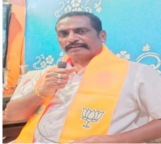
చేసేలా ప్రత్యేక చట్టాలు తీసుకురావడం ఇప్పటికే తెలిసింది.