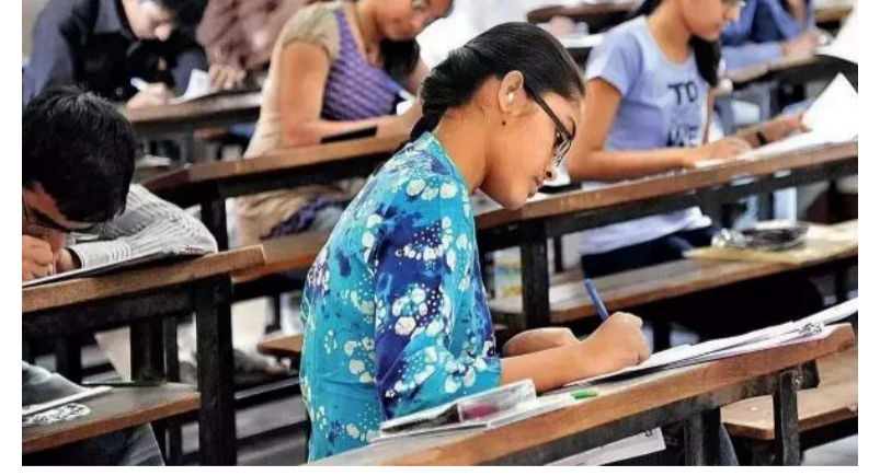
హాజరుకాని టీచర్లపై సస్పెన్షన్ వేటు తప్పదని అధికారులు హెచ్చరించారు. స్కాల్ సెంటర్లలో ఏర్పడిన సాంకేతిక సమస్యను తీరికం అధికారులతో మాట్లాడి పరిష్కరిస్తామని హామీ ఇచ్చారు. ఇప్పటి వరకే తరగతి ఫలితాలపై తీవ్ర ప్రభావాన్ని చూపే అవకాశం ఉంది. తొలుత ఏప్రిల్ 4వ వారంలో ఫలితాలు వెల్లడించాలని భావించినప్పటికీ మే మొదటి వారంలో పదో తరగతి ఫలితాలు విడుదల చేసే అవకాశం ఉందని అధికారులు చెబుతున్నారు. పన్నె వారం ఫలితాల తేదీ పైన స్పష్టత రానుంది.

మార్కులు నమోదు చేయాలి. అసిస్టెంట్ ఎగ్జామినర్లు పేపర్లు మూల్యాంకనం చేసిన అనంతరం మార్కులు ట్యూజీల ప్రక్రియకు ప్రత్యేకంగా కేటాయించిన స్పెషల్ అసిస్టెంట్లు మాత్రమే నమోదు చేయాలి. వాల్యూయేషన్ సెంటర్లలో అందుబాటులో ఉంచిన ట్యూజీలు, ఇంటర్నెట్ పనిచేయడం లేదని టీచర్లు తలపెట్టుకుంటున్నారు. ఈ ఏడాది పదో తరగతి పరీక్షలు మార్చి 16 నుంచి ఈ నెల 2వ తేదీ వరకు జరిగాయి. దాదాపు 6.20 లక్షల మంది విద్యార్థులు ఈ పరీక్షలు రాశారు. ఏప్రిల్ 16లోపు పూర్తి చేయాలని లక్ష్యాలు పెట్టుకున్నారు. కాగా, మూల్యాంకనం విధులకు దాదాపు 20 వేల మందిని ఆటోమేషన్ ద్వారా నియమించారు. అయితే విద్యార్థులు నుంచి చీఫ్ ఎగ్జామినర్లు, అసిస్టెంట్ ఎగ్జామినర్లు, స్పెషల్ అసిస్టెంట్ విధులు కేటాయించినా కొందరు ఎగ్జామినర్లు దుమ్ముకొడుతున్నారు. స్కాల్ లో టీచర్ల కొరత తీవ్రతరం కావడం విద్యార్థులు స్పందించింది. స్కాల్ విధులకు