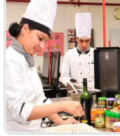
మహిళలు, యువతీ యువకుల నుంచి ఆన్ లైన్ లో దరఖాస్తులు ఆహ్వానించినది. పదో తరగతి, ఇంటర్, డిగ్రీ చేసిన మహిళలు, యువతీ యువకులు ఈ శిక్షణ కు ఆన్ లైన్ లో

హైదరాబాద్ : ఉపాధి.. ఉద్యోగాల కోసం వేచి ఉన్న వారికి నేషనల్ స్కెల్ అకాడమీ బిగ్ అప్ డే. హోటల్ మేనేజ్మెంట్, క్షాన్ కిచ్చెన్ & క్యాటరింగ్ సర్వీసెస్ కోర్సుల్లో శిక్షణ ద్వారా ఉద్యోగాల పైన కీలక ప్రకటన చేసింది. స్వయం ఉపాధి ద్వారా భవిష్యత్ నిర్మించుకునే అవకాశం కల్పిస్తోంది. ఇప్పటి వరకు ఆర్టిఫిషియల్ ఇంటెలిజెన్స్ లో శిక్షణ ఇచ్చిన ఈ సంస్థ ఇప్పుడు కొత్తగా హోటల్ రంగంలో మహిళలు, యువతీ యువకుల నుంచి ఆన్ లైన్ లో దరఖాస్తులను ఆహ్వానిస్తోంది. నేషనల్ స్కెల్ అకాడమీ ఫర్ హోటల్ మేనేజ్మెంట్ & క్యాటరింగ్ సర్వీసెస్ ట్రైనింగ్ ఆధ్వర్యంలో మహిళలకు, యువతీ యువకులకు హోటల్ మేనేజ్మెంట్, క్షాన్ కిచ్చెన్, క్యాటరింగ్ సర్వీసెస్ లో ఆన్ లైన్ / ఆఫ్ లైన్ శిక్షణ ఇవ్వనుంది. శిక్షణతో పాటుగా స్వయం ఉపాధి తో పాటు ఉద్యోగ అవకాశాలు పెంపొందించేందుకు అర్హత ఆసక్తి గల