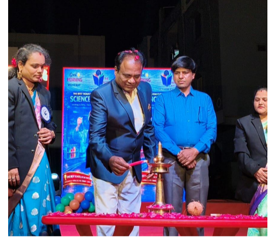
సాంస్కృతిక ప్రదర్శనలు అన్ని కలిసిపోతూ ఒక అందమైన విద్యోత్సవాన్ని సృష్టించాయి. ఆటపాటలలో ఆత్మవిశ్వాసం...