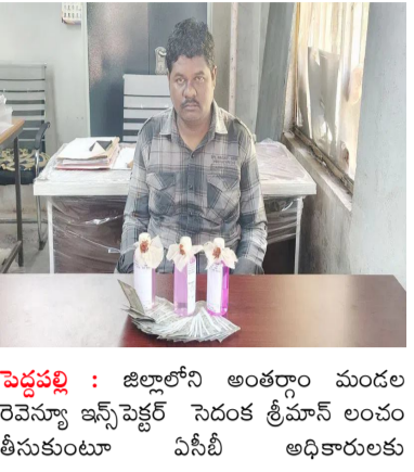
పెద్దపల్లి : జిల్లాలోని అంతర్గత మండల రెవెన్యూ ఇన్స్పెక్టర్ సెంద్రల్ ట్రీమాన్ లంచం తీసుకుంటూ ఏసీబీ అధికారులకు

రెవెన్యూడెడ్ గా పట్టుబడ్డారు. భూభారతి పట్టం, 2025 ప్రకారం, ఫిర్యాదుదారు తల్లికి చెందిన భూమికి సంబంధించి క్షేత్రస్థాయి విచారణ నిర్వహించి నివేదికను తహసీల్దార్ కు పంపించాలని ఆర్.బి.ను కోరగా అందుకు లంచం డిమాండ్ చేశాడు. దీంతో బాధితుడు ఏసీబీ అధికారులను ఆశ్రయించాడు. గురువారం తహసీల్ కార్యాలయం లో రూ.10 వేలు లంచం తీసుకుంటుండగా కరీంనగర్ యూనిట్ కు చెందిన ఏసీబీ అధికారులకు చిక్కింది. అతడిపై కేసు నమోదు చేసి కరీంనగర్ ఏసీబీ కోర్టులో హాజరు పరచామని అధికారులు వివరించారు.