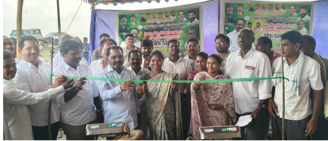
అందుబాటులోకి తెస్తున్నామని ఆయన పేర్కొన్నారు.ప్రభుత్వం రైతులకు అండగా ఉంటూ వడ్డకు బోనస్,మద్దతు ధర కల్పిస్తోందని,అలాగే సబ్సిడీపై వ్యవసాయ పనిముట్లను కూడా అందిస్తోందని వివరించారు.రైతులందరూ ఈ సౌకర్యాన్ని వినియోగించుకోవాలని ఆయన కోరారు.ఈ కార్యక్రమంలో,ఆత్మ

నమస్తేభారత్:బీకులపల్లి,ఏప్రిల్ 9 రైతు సంక్షేమమే ధ్యేయంగా రాష్ట్ర ప్రభుత్వం పనిచేస్తోందని ఇబ్బందు శాసనసభ్యులు కోరం కనకయ్య అన్నారు.గురువారం బీకులపల్లి మండలం బోడు గ్రామంలో బీతంపూడి ప్రాథమిక వ్యవసాయ సహకార సంఘం ఆధ్వర్యంలో ఏర్పాటు చేసిన వరి ధాన్యం మరియు మొక్కజొన్న కొనుగోలు కేంద్రాన్ని ఆయన ముఖ్య అతిథిగా పాల్గొని ప్రారంభించారు.ఈ సందర్భంగా ఎమ్మెల్యే మాట్లాడుతూ,గతంలో కేవలం మండల కేంద్రమైన బీకులపల్లిలో మాత్రమే కొనుగోలు కేంద్రం ఉండేదని,దీనివల్ల సుదూర ప్రాంతాల నుండి వచ్చే రైతులకు రవాణా ఖర్చులు,ఇబ్బందులు ఉండేవని గుర్తు చేశారు.రైతుల కష్టాలను గుర్తించి,వారి ముంగిటే కొనుగోలు సౌకర్యాన్ని తీసుకురావాలనే ఉద్దేశంతో బోడు గ్రామంలో ఈ కేంద్రాన్ని ఏర్పాటు చేసినట్లు తెలిపారు.రాష్ట్ర వ్యవసాయ శాఖ మంత్రి తుమ్మల నాగేశ్వరరావు సహకారంతో నియోజకవర్గంలో మరిన్ని కొనుగోలు కేంద్రాలను