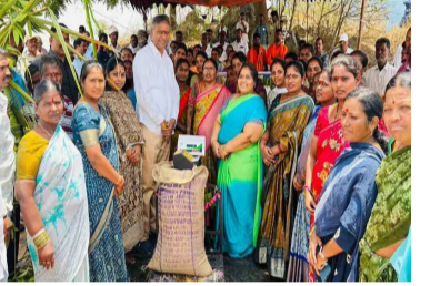
ప్రభుత్వ దృష్టికి తీసుకెళ్లాలని వెల్లడించారు. మిల్లర్లు ఇబ్బందులు పెడితే కచ్చితంగా వారితో మాట్లాడి పరిష్కరిస్తామని స్పష్టం చేశారు.

చేయాలన్నారు. మహిళా సంఘాలు మరింత బలోపేతం కావాలని మిల్లర్లు ఇబ్బందులు పెడితే చర్యలు తీసుకుంటామన్నారు. రైతుల ధాన్యం అమ్మిన తర్వాత చెల్లింపులు అలభ్యమైతే త్వరగా జమ చేయమని, ప్రతి కొనుగోలు కేంద్రంపై ప్రత్యేక దృష్టి పెడతామన్నారు. ధాన్యం అమ్మకాలలో ఎలాంటి సమస్యలు ఎదురైనా వెంటనే అధికారుల దృష్టికి తీసుకు రావాలని, అసెంబ్లీపై ఉన్నతాధికారులతో మాట్లాడి పరిష్కరిస్తామని హామీ ఇచ్చారు. పాత బకాయిలు ప్రభుత్వం వచ్చినప్పటి నుంచి రెండున్నరేళ్లుగా రైతుల సమస్యలను నిరంతరం