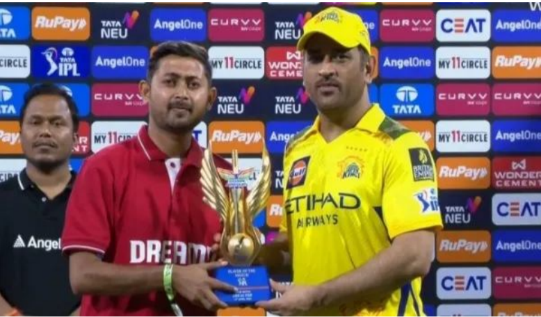
ధోనీ గ్రౌండ్ లోకి దిగటం ఖాయంగా కనిపిస్తోంది. ఒకట్రోడు రోజుల్లో ఈ టెస్టు పూర్తయ్యే ఛాన్స్ ఉందని జట్టు వెల్లడించింది. ధీనీ ఫిట్ నెస్ సాధిస్తాడని జట్టు కోర్

జూబియా కు ఈ సారి లీగ్ దశ ప్రారంభం కలిసి రాలేదు. ఇప్పటికే హ్యూటీక్ పరాజయాల సమాధి చేసుకుంది. ఈ టోర్నీకి స్టార్ క్రీడర్ ధోనీ దూరంగా ఉన్నారు. రెండు వారాల తరువాత ధోనీ టీంలో చేరుతారని ఐపీఎల్ ప్రారంభం వేళ ప్రకటించారు. కాగా.. ఇప్పుడు వరుస పరాజయాల తో ధోనీ రీ ఎంట్రీ మరింత ముందుగానే ఉండే అవకాశం కనిపిస్తోంది. దీంతో.. ధోనీ కమ్ బ్యాక్ పై చెన్నై జట్టు యాజమాన్యం స్పష్టత ఇచ్చింది. 2026 ఎన్నో అంచనాలతో బరిలోకి దిగిన సీఎస్కే ఇప్పటి వరకు అభిమానులకు నిరాశే మిగుల్చింది. ఆడిన మూడు మ్యాచులు ఓడిపోయింది. ఈ సమయంలో అభిమానులకు గాంత్ రిలీఫ్ ఇచ్చే న్యూస్ బయటకు వస్తోంది. కొంత సుంచి కోలుకుంటున్న ధోనీ ఇప్పటికే నెట్స్ లో ప్రాక్టీస్ మొదలు పెట్టారు. ఫిట్ నెస్ టెస్టు ఎదుర్కొనేందుకు సిద్ధమయ్యాడు. అందులో అంతా భాగంలే నెట్స్ మ్యాచ్ నుంచి