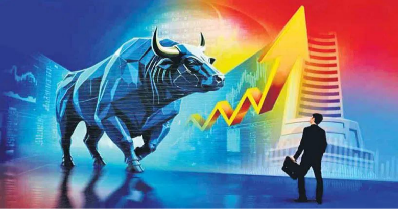
255.15 పాయింట్లు (1.12 శాతం) లాభంతో 22,968.25 పాయింట్ల వద్ద ముగిసింది. లాభాల కారణంగా ఇన్వెస్టర్ల సందవ ఒక్క రోజే

భారత స్టాక్ మార్కెట్లు సోమవారం లాభాల్లో ముగిశాయి. ఉదయం ట్రేడింగ్ నష్టాల్లో ప్రారంభమై సమస్యలకు, మధ్యాహ్నం సుంచి లాభాలబాటపట్టాయి. ట్రేడింగ్ ముగిసేసరికి సెన్సెక్స్ 787 పాయింట్లు లాభంతో ముగిసింది. ఉదయం సెన్సెక్స్ 73,477.53 పాయింట్ల వద్ద స్వల్ప నష్టంతో ప్రారంభమైంది. ఇంట్రాడేలో మరింత నష్టపోయి 72,728.66 పాయింట్ల కనిష్ట స్థాయికి చేరింది. ఇదే సమయంలో ఇరాన్-అమెరికా మధ్య కాల్పులు విరమణ అంశంలో ప్రకటన వెలువడటం మార్కెట్ పరాలకు కలిసొచ్చింది. మార్కెట్ లాభాలబాట పట్టింది. ఒక దశలో సెన్సెక్స్ 74,207.46 పాయింట్ల గరిష్టస్థితి తాకింది. చివరకు 74,106.85 వద్ద ముగిసింది. నిట్టి కూడా