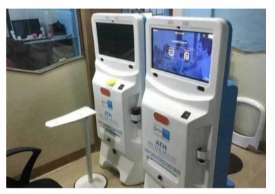
ఈ ప్రయోగాలు విజయవంతం కావడంతో రాష్ట్రవ్యాప్తంగా వీటిని విస్తరించడానికి ప్రభుత్వం సిద్ధమవుతోంది. ముఖ్యంగా ఔట్ పేషెంట్ల రద్దీ ఎక్కువగా ఉండే ప్రభుత్వ ఆసు పత్రుల్లో ఈ హెల్త్ ఏటీఎంలను ఏర్పాటు చేయాలని ప్రభుత్వ వర్గాలు ప్రణాళికలు రచిస్తున్నాయి. ఈ హెల్త్ ఏటీఎంల పనితీరు, రోగ నిర్ధారణలో వాటి కచ్చితత్వాన్ని నిర్ధారించడం కోసం చాలా విస్తృతమైన పరీక్షలను నిర్వహించారు. వీటిలో టెస్టులు చేయించు కున్న రోగులను మూలాలను మళ్ళీ దయా

హైదరాబాద్: ప్రజలకు మరింత మెరుగైన వైద్య సేవలను అందించడమే లక్ష్యంగా తెలంగాణ ప్రభుత్వం పలు కీలక చర్యలను చేపడుతుంది. ఈ క్రమంలోనే నిరుపేదలకు కూడా ఆరోగ్య సేవలను చేరువ చేయడం కోసం ప్రభుత్వ ఆసు పత్రు లలో అత్యధునిక వైద్య సదుపాయాలను అం దుబాటులోకి తీసుకురావడానికి ప్రయత్నం చేస్తోంది. ఈ క్రమంలోనే హెల్త్ ఏటీఎంలను రాష్ట్రంలోని ప్రభుత్వ ఆసుపత్రులలో ప్రవేశపెట్టడానికి నిర్ణయం తీసుకుంది.