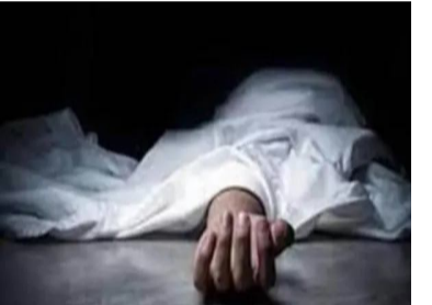
ప్రియుడిను సమయంలో భార్య వివాహితర సంబంధంపై కోపంతో ఉన్న భర్త ఆమెకానిక లోనై ఆమెపై దాడి చేశాడు.భార్య మృతి .. భర్తను అరెస్ట్ చేసిన పోలీసులుతీవ్ర ఆగ్రహంతో

అందరినీ షాక్ కి గురి చేసింది. మార్చి 30న భార్య ప్రియుడితో కలిసి వెళ్ళిపోయిందని భర్త పోలీసులకు ఫిర్యాదు చేశాడు. దీనిపై పోలీసులు అదృశ్యం కేసు నమోదు చేసి దర్యాప్తు ప్రారంభించారు. దర్యాప్తులో భాగంగా పోలీసులు ఆమె జద్దర్లో తన ప్రియుడితో ఉన్నట్లు గుర్తించారు.పోలీసుల సాయంతో భార్యను తిరిగి తీసుకొచ్చే క్రమంలో భర్త హతకంఠానంతరం పోలీసులు భర్తను వెంట తీసుకుని అక్కడికి వెళ్ళి మహిళను అదుపులోకి తీసుకున్నారు. ఆమె ఆమెను భర్తతో కలిసి తిరిగి తీసుకువస్తుండగా, మార్గమధ్యలో సదాశివపేట మండలం నందికండ్లి వద్ద భర్త ఊహించిన పూత కానికి పాల్పడ్డాడు. కారులో