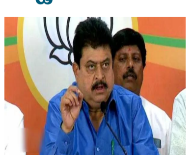
ఎన్నికలు ఎప్పుడు వచ్చినా, ఎదుర్కొనేందుకు తమ పార్టీ సిద్ధంగా ఉందని తేల్చి చిచ్చారు. రాజీయ జీహెంఎంసీ ఎన్నికల్లో 3 మేయర్ స్థానాలను బీజేపీ తన ఖాతాలో చేసుకుంటుందని డిమా వ్యక్తం చేశారు. గత మున్సిపల్ ఎన్నికల్లో ఆశించిన స్థాయిలో ఫలితాలు

హైదరాబాద్: తెలంగాణలో రాజకీయ రెక్కలు మారు తున్నాయి. కొత్త పాత్తులు తెర మీదకు వస్తున్నాయి. తాజాగా చోటు చేసుకుంటున్న పరిణామాలు సమీకరణాలను మార్చేస్తున్నాయి. దీంతో, రానున్న గ్రేటర్ తో సహా అన్ని ఎన్నికల్లో కొత్త పాత్తులు ఖాయమనే చర్చ మొదలైంది. గ్రేటర్ ఎన్నికల్లో ఏపీ తరహాలో ఎన్డీఏ పాత్తు ఉంటుందని కొంత కాలంగా పాలిటికల్ సర్కిల్స్ లో చర్చ జరుగుతోంది. ఈ పాత్తుల చేరువే బీజేపీ చీఫ్ తమ విధానం స్పష్టం చేసారు. పాత్తుల రెక్కలపై క్లారిటీ ఇచ్చారు. రాష్ట్రంలో ఎక్కడ ఎన్నికలు జరిగినా.. బీజేపీ ఒంటరిగానే పోటీ చేస్తుందని, ఎవరితోనూ పాత్తు పెట్టకోదని బీజేపీ రాష్ట్ర అధ్యక్షుడు సీఎం ఫాటో పెట్టిస్తారా అని ప్రశ్నించారు.