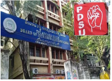
వెంటనే రద్దు చేయాలని డిమాండ్ చేసింది.

హైదరాబాద్, ఏప్రిల్ 6: వేసవి సెలవుల్లో కార్పొరేట్ కాలేజీలు తరగతులు నిర్వహించడంపై పీడీఎస్ యూ ఆగ్రహం వ్యక్తం చేసింది. ముందస్తు అడ్మిషన్లు చేపట్టడంపై నాంపల్లిలోని ఇంటర్ బోర్డు కార్యాలయం ముందు విద్యార్థి సంఘం ధర్మా నిర్వహించింది. కార్పొరేట్ కాలేజీలు రిజల్ట్ రాకముందే అడ్మిషన్లు తీసుకుని, ఫీజు రాయితీ పేరుతో తల్లిదండ్రులను మోసం చేస్తున్నాయని పీడీఎస్ యూ ఆరోపించింది. ఇలాంటి కాలేజీల గుర్తింపును వెంటనే రద్దు చేయాలని డిమాండ్ చేసింది.