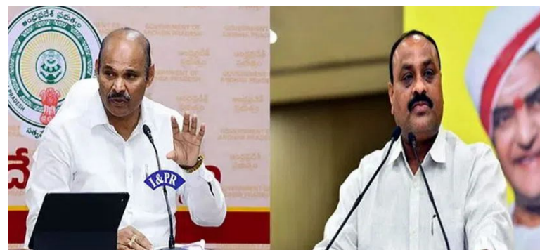
ఆరోపించారు. కూటమి ప్రభుత్వం అధికారంలోకి వచ్చిన వెంటనే ఆగిపోయిన రాజధాని నిర్మాణ పనులను తిరిగి ప్రారంభించామని ఆయన చెప్పారు.

వినాలనే ధోరణివేళ్లే ప్రజలు ఎన్నికల్లో తగిన తీర్పు ఇచ్చారని మండిపడ్డారు. చంద్రబాబుపై నమ్మకంతోనే రైతులు రాజధానికి భూములు ఇచ్చారని, అలాంటి రైతులను అవమానించిన వైసీపీకి భవిష్యత్తులో పుట్టగతులు ఉందవని హెచ్చరించారు. మరోవైపు శనివారం టీడీపీ కేంద్ర కార్యాలయంలో నిర్వహించిన మీడియా ప్రతినిధుల సమావేశంలో మంత్రి అచ్చెన్నా యువ మాట్లాడుతూ.. తెలుగు జాతిపైన, అమరావతిపైన జగన్‌కు ఎందుకంత కక్ష? అని ప్రశ్నించారు. జగన్ మొదట అమరావతిని రాజధానిగా అంగీకరించారని, అధికారంలోకి రాగానే మూడు రాజధానులంటూ ప్రాంతీయ విద్యేషాలు రెచ్చగొట్టారని అచ్చెన్నా యువ