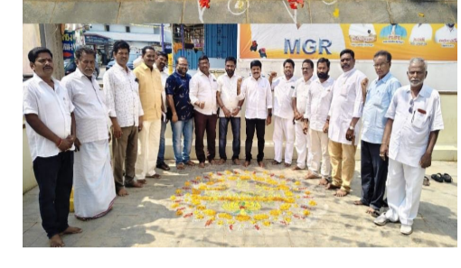
ఈ కార్యక్రమాన్ని పండుగలా భావించి, గడప ముందు ముగ్గులతో ఆనందోత్సాహాలను పంచుకుంటూ అమరావతికి మద్దతుగా తమ స్వరం వినిపించారు. ఈ మండల ఎన్నిక కూటమి నాయకులు పాల్గొన్నారు.