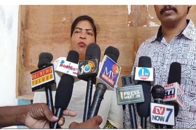
తెచ్చుకున్నారు. అసలు సంగతి ఏంటంటే ఉమ్మడి ఆస్తి అధికారాధా ఇందులో లేదని ఆర్డీబి లైవ్ న్యూస్ కు తెలిపారు. సాలూరు బొట్టిలి కోర్టులో కేసు నడుస్తుంది... కంప్యూటర్