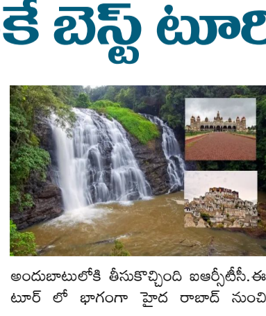
అందుబాటులోకి తీసుకుచ్చింది ఐఆర్టీసీ. ఈ టూర్ లో భాగంగా హైదరాబాద్ నుంచి

కర్ణాటక: కర్ణాటకలో అనేక టూరిస్టు ప్రాంతాలు ఉన్నాయి. తెలుగు రాష్ట్రాలకు కర్ణాటక చాలా దగ్గరగా ఉంటుంది. ప్రకృతి సౌందర్యం, చారిత్రక ప్రదేశాలు, ఆధ్యాత్మిక ప్రదేశాలకు నెలవుగా ఉంది. కర్ణాటకలో కూర్గ్, విక్రమగిరి లాంటి హిల్ స్టేషన్లు, హంపి, మైసూర్ లాంటి చారిత్రక ప్రదేశాలు ఉన్నాయి. అయితే తక్కువ ధరకే కర్ణాటక టూర్ వెళ్లిద్దామా..? వర్తమా కుల కోసం తక్కువ ధరకే అద్భుతమైన ప్యాకేజీని