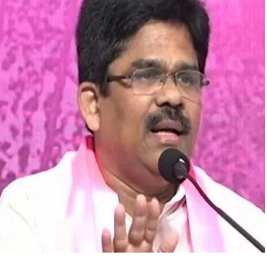
హైదరాబాద్ : బీఆర్ఎస్ అధినేత, తెలంగాణ తొలి ముఖ్యమంత్రి కేసీఆర్ గజెల్లె క్యాంపు కార్యాలయం విధ్వంసం కాంగ్రెస్ అరాచక పాలనకు అద్దమని రాష్ట్ర కల్చర్ కార్పొరేషన్

మాజీ చైర్మన్ పల్లె రవి కుమార్ గౌడ్ (ఆర్ఎం) చారు. ఈ సందర్భంగా ఎమ్మెల్యే క్యాంపు కార్యాలయంపై దాడిని ఆయన ఖండించారు. కాంగ్రెస్ గూండాల దాడి అధికార దుర్హంకారమేనని ఆరోపించారు. రాష్ట్రంలో కొనసాగుతున్న అరాచక పాలనకు అద్దం పడుతున్నదని రుద్దుబట్టారు. ఎమ్మెల్యే క్యాంపు కార్యాలయాన్ని ధ్వంసం చేయడం అంటే ప్రభుత్వ ఆస్తులను ధ్వంసం చేయడమేనని అన్నారు. ప్రభుత్వ ఆస్తులకు రక్షణ లేకపోతే సామాన్యులకు రక్షణ ఎక్కడ ఉంటుందని అనుమానం వ్యక్తం చేశారు. అధికారం కోసం ప్రజలకు ఇచ్చిన హామీలు నెరవేరడం చేతగాక రేవంత్ రెడ్డి ప్రభుత్వం దౌర్జన్యకాండకు పాల్పడుతున్నదని మండిపడ్డారు. దౌర్జన్యాల, అణచివేతలు, దాడులతో అవుతుందని పేర్కొన్నారు.