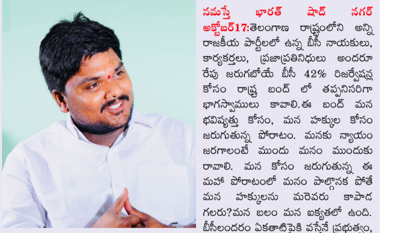
సమస్తే భారత్ షాద్ నగర్ అక్టోబర్ 17: తెలంగాణ రాష్ట్రంలోని అన్ని రాజకీయ పార్టీలలో ఉన్న బీసీ నాయకులు, కార్యకర్తలు, ప్రజాప్రతినిధులు అందరూ రేపు జరగబోయే బీసీ 42% రిజర్వేషన్ల కోసం రాష్ట్ర బండ్ లో తప్పనిసరిగా భాగస్వాములు కావాలి. ఈ బండ్ మన భవిష్యత్తు కోసం, మన హక్కుల కోసం జరగుతున్న పోరాటం. మనకు న్యాయం జరగాలంటే ముందు మనం ముందుకు రావాలి. మన కోసం జరగుతున్న ఈ మహా పోరాటంలో మనం పాల్గొనక పోతే మన హక్కులను మరచారు కాపాడ గలరు? మన బలం మన బకత్తో ఉంది. బీసీలందరం ఏకతాటిపైకి వస్తేనే ప్రభుత్వం, అన్ని వర్గాల నాయకులు మన డిమాండ్ ను గౌరవిస్తారు. రేపటి బండ్ లో ప్రతి బీసీ సోదరుడు, సోదరి, యువకుడు, విద్యార్థి, కార్యకర్త ఎవరి అయినా తమ వంతు పాత్రను నిర్వహించాలి. ఇది కేవలం రాజకీయ పోరాటం కాదు ఇది సమాజ న్యాయం కోసం బీసీ సమాజం చేస్తున్న చరిత్రాత్మక ఉద్యమం! మన బకత్తోనే 42% రిజర్వేషన్ల వాస్తవం అవుతాయి.