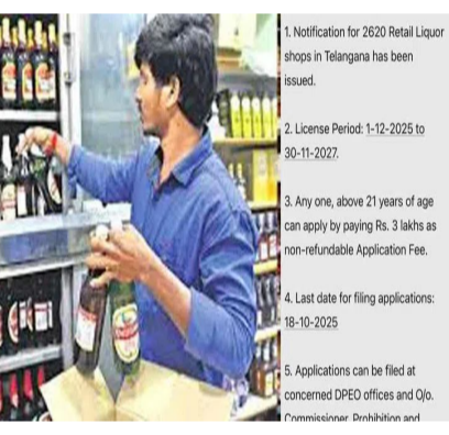
1. Notification for 2620 Retail Liquor shops in Telangana has been issued. 2. License Period: 1-12-2025 to 30-11-2027. 3. Any one, above 21 years of age can apply by paying Rs. 3 lacs as non-refundable Application Fee. 4. Last date for filing applications: 18-10-2025. 5. Applications can be filed at concerned DFO offices and QOs. (Commissioner, Excise and O.T.)

హైదరాబాద్ : రాష్ట్రంలో 2,620 మద్యం దుకాణాల కోసం కాంగ్రెస్ ప్రభుత్వం దరఖాస్తులు స్వీకరిస్తున్న సంగతి తెలిసిందే. దరఖాస్తుల స్వీకరణకు శనివారం వరకు రోజు. నిన్నటి వరకు కేవలం 25 వేల మద్యం దరఖాస్తులే వచ్చినట్లు ఎక్సైజ్ శాఖ అధికారులు వెల్లడించారు. బుధవారం వరకు 9,600 దరఖాస్తులు రాగా గురువారం ఒక్క రోజే 10 వేల దరఖాస్తులు వచ్చాయి. చివరి రోజు కావడంతో.. అనుకున్న స్థాయిలో దరఖాస్తులు రావేమో అని అధికారులు దిగులు చెందుతున్నట్లు సమాచారం. రియల్ ఎస్టేట్ పడిపోవడం, బిజినెస్ తగ్గిపోవడం లాంటి కారణాలు ఉన్నా కూడా వ్యాపారులు సిండికేట్ లాగా ఏర్పడి పోటీ లేకుండా దరఖాస్తులు వేస్తున్నారని అనే ఆరోపణలు ఉన్నాయి. గతేడాది మద్యం దుకాణాల కోసం 1.31 లక్షల దరఖాస్తులు రాగా ఈసారి దారుణంగా డిమాండ్ పడిపోయింది. ఈసారి లక్ష లోపే మద్యం దరఖాస్తులు ఉండొచ్చని అంచనా వేస్తున్నారు. దరఖాస్తులు చేయండి ప్లీజ్. మద్యం దరఖాస్తుల కోసం అధికారులు పదదాని పాట్లు పడుతున్నారు. మద్యం దుకాణాల కోసం దరఖాస్తు చేసుకోండి అని గతంలో దరఖాస్తు చేసుకున్న వారి ఫోన్లపై ఎక్సైజ్ శాఖ అధికారులు %హామీ%లు పెట్టి వేడుకుంటున్నారు. గతంలో పోలిస్టే దరఖాస్తులు ఈ సారి తక్కువగా వస్తుండంతో.. మద్యం టెండర్ల కోసం దరఖాస్తులు పెంచడానికి మెనేజీలు చెల్లీ మరీ తిప్పలు పడుతున్నారని అధికారులు.