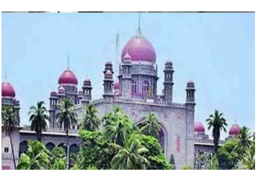
పిటిషన్ వాదనలను ధర్మాసనం ఏకీభవించలేదు. ఈ కేసులో ఇంజనీర్ పిటిషన్లు, పిటిషన్లు కూడా హైకోర్టు కొట్టి వేసింది.

రంగారెడ్డి జిల్లా :మహేశ్వరం భూదాన్ భూముల వ్యవహారం పై తెలంగాణ హైకోర్టు తీర్పు కీలక తీర్పు ఇచ్చింది. ల్యాండ్ ను కొనుగోలు చేసిన ఐఎస్, ఐపీఎస్ అధికారులపై చర్యలు తీసుకోవాలని వేసిన పిటిషన్ ను హైకోర్టు కొట్టివేసింది. సర్వే నెంబర్ 194, 195 భూదాన్ భూమిని అక్రమంగా మ్యూటీషన్ చేసి అన్యక్రంతం చేశారంటూ పిటిషన్ తరఫున లాయర్ హైకోర్టు వాదించారు.రంగారెడ్డి జిల్లా మహేశ్వరం భూదాన్ భూముల వ్యవహారం పై తెలంగాణ హైకోర్టు తీర్పు కీలక తీర్పు ఇచ్చింది. ల్యాండ్ ను కొనుగోలు చేసిన ఐఎస్, ఐపీఎస్ అధికారులపై చర్యలు తీసుకోవాలని వేసిన పిటిషన్ ను హైకోర్టు కొట్టివేసింది. సర్వే నెంబర్ 194, 195 భూదాన్ భూమిని అక్రమంగా మ్యూటీషన్ చేసి అన్యక్రంతం చేశారంటూ పిటిషన్ తరఫున లాయర్ హైకోర్టు వాదించారు. అయితే