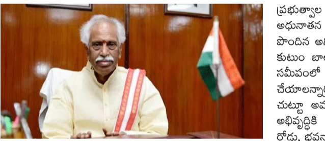
అనుకుని ఎయిమ్స్ నిర్మాణానికి తెలంగాణ ప్రభుత్వం 200 ఎకరాలను కేటాయించింది తెలిపారు. ఎంబీబీఎస్ తొలి బ్యాచ్ విద్యార్థులు ఇటీవలే గ్రాడ్యుయేట్లు అయ్యారన్నారు. ఎయిమ్స్ బీబీనగర్ చుట్టూ మౌలిక సదుపాయాలు కల్పించాలని, 163 జాతీయ రహదారిపై ప్రతి నిత్యం 250కి పైగా బస్సులు సమస్యలన్నింటా ల్యాండ్ కావడం, టెక్నో అవగాహన అవసరమైన కార్యక్రమాల కోసం వినియోగించనున్నారు. దీంతో పాటుగా మరో 280.3 ఎకరాల భూమి కూడా అవసరమని ఎయిర్పోర్ట్ అథారిటీ ఆఫ్ ఇండియా (ఏఐఐ) గుర్తించింది. ఈ భూమి సేకరణ

బీబీనగర్, అక్టోబర్ 17: బీబీనగర్ ఎయిమ్స్ అభివృద్ధిపై ముఖ్య మంత్రి రేవంత్ రెవంత్ కి హామీలతో ప్రదేశ్, హర్యానా రాష్ట్ర మాజీ గవర్నర్ బండారు దత్తాత్రేయ లేఖ రాశారు. ఈ నెల 13వ తేదీన దత్తాత్రేయ బీబీనగర్ ఎయిమ్స్ను సందర్శించి అధ్యాపకులు, విద్యార్థులు, రోగులతో మాట్లాడిన విషయం తెలిసింది. తన చర్యలలో భాగంగా రాష్ట్ర ముఖ్యమంత్రికి ఎయిమ్స్ అభివృద్ధికి పలు సూచనలను చేస్తూ లేఖ పంపారు. తెలంగాణ రాష్ట్రాన్ని సీఎం రేవంత్ నుండి సర్దుబాటు చేయాలని బీబీనగర్ ఎయిమ్స్? ఎక్కువ మందికి సంరక్షణలో అత్యున్నత సేవలందించగలదన్నారు. తెలంగాణ ప్రభుత్వం, భారత ప్రభుత్వం మధ్య సహకార సమాఖ్య స్థాపించి బీబీనగర్ ఎయిమ్స్ అభివృద్ధి అవుతుందని తాను విశ్వసించుతున్నట్లు తెలిపారు. ప్రతి ఏటా పది లక్షల మంది పోస్ట్ సేవలకు కేంద్ర బిందువుగా అవతరిస్తుందన్నారు. సర్వీసు రోడ్డు ద్వారా బస్సులు ప్రయాణించేలా చూడాలని పేషెంట్ ఇన్స్టిట్యూట్ వనల్ ర్యాంకింగ్ (ఫ్రీమ్ వర్క్ (ఎన్ఐఐఆర్ఎస్)) లో అత్యున్నత ర్యాంక్ సాధించనుందన్నారు. ప్రధాని సరేంద్ర మోడి, కేంద్ర ఆరోగ్య కుటుంబ సంక్షేమ మంత్రిత్వ శాఖ అధ్యక్షులతో 2019 లో తెలంగాణ ప్రజలకు ఇచ్చిన బహుమతి బీబీనగర్ ఎయిమ్స్ అన్నారు. హైదరాబాద్-హరంగల్ జాతీయ రహదారి 163కు