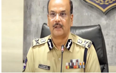
బండ్ వల్ల ప్రజలకు ఎలాంటి ఇబ్బంది లేకుండా చూసుకోవాలన్నారు. సాధారణ ప్రజలకు నమస్కలు ఎదురవకుండా, బాధ్యతాయుతంగా వ్యవహరించాలని డీజీపీ శివధర్ రెడ్డి సూచించారు. బీసీ రిజర్వేషన్ కోసం రాష్ట్ర బీసీ జేపీసీ సంఘం ఈ నెల 18న బండ్ కు పిలుపునిచ్చిన సంగతి తెలిసిందే. శనివారం చేపట్టబోయే బండ్ ఫర్ జస్టిస్ కు ఆయా రాజకీయ పార్టీలు తమ సంపూర్ణ మద్దతును ప్రకటించారు. ఈ బండ్ కు విజయవంతం చేయాలని బీసీ సంఘాల జేపీసీ ప్రజలను కోరంది.

హైదరాబాద్ : బండ్ కు శాంతియుతంగా జరుపుకోవాలని రాష్ట్ర డీజీపీ శివధర్ రెడ్డి సూచించారు. బండ్ పేరుతో అవాంఛనీయ ఫుటనలకు, పట్ల వ్యతిరేక కార్యక్రమాలకు పాల్పడతే కఠిన చర్యలు తీసుకుంటామని హెచ్చరించారు. పోలీసులు, నిఘా బృందాలు అవ్యతిరేకమైన పర్యవేక్షిస్తాయని పేర్కొన్నారు. బండ్ వల్ల ప్రజలకు ఎలాంటి ఇబ్బంది లేకుండా చూసుకోవాలన్నారు. సాధారణ ప్రజలకు నమస్కలు ఎదురవకుండా, బాధ్యతాయుతంగా వ్యవహరించాలని డీజీపీ శివధర్ రెడ్డి సూచించారు. బీసీ రిజర్వేషన్ కోసం రాష్ట్ర బీసీ జేపీసీ సంఘం ఈ నెల 18న బండ్ కు పిలుపునిచ్చిన సంగతి తెలిసిందే. శనివారం చేపట్టబోయే బండ్ ఫర్ జస్టిస్ కు ఆయా రాజకీయ పార్టీలు తమ సంపూర్ణ మద్దతును ప్రకటించారు. ఈ బండ్ కు విజయవంతం చేయాలని బీసీ సంఘాల జేపీసీ ప్రజలను కోరంది.