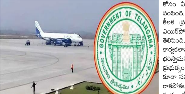
కానుంది. ఇప్పటికే మామునూరు విమానాశ్రయం పరిధిలో 696 ఎకరాల భూమి అందుబాటులో ఉంది. దీనిలో విమానాశ్రయం అభివృద్ధికి.. మరీ ముఖ్యంగా ఏ-320 రకం విమానాలు.. సురక్షితంగా ల్యాండ్ కావడం, టెక్నో అవగాహన అవసరమైన కార్యక్రమాల కోసం వినియోగించనున్నారు. దీంతో పాటుగా మరో 280.3 ఎకరాల భూమి కూడా అవసరమని ఎయిర్పోర్ట్ అథారిటీ ఆఫ్ ఇండియా (ఏఐఐ) గుర్తించింది. ఈ భూమి సేకరణ

హరంగల్, అక్టోబర్ 17: తెలంగాణలో విమానయానం అభివృద్ధి కోసం రాష్ట్ర ప్రభుత్వం అనేక చర్యలు తీసుకుంటుంది. ప్రస్తుతం రాష్ట్రంలో కేవలం హైదరాబాద్ మాత్రమే విమానాశ్రయాలు ఉన్నాయి. ఈ క్రమంలో రాష్ట్ర ప్రభుత్వం మిగతా జిల్లాల్లో కూడా ఎయిర్పోర్టులు ఏర్పాటు చేయాలని భావిస్తోంది. దీనిలో భాగంగా ఇప్పటికే హరంగల్ జిల్లాలో ఉన్న మామునూరు విమానాశ్రయం పునఃప్రాసారణలో తెలంగాణ ప్రభుత్వం ప్రత్యేక చర్యలు తీసుకుంటుంది. ఎయిర్పోర్ట్ అథారిటీ ఆఫ్ ఇండియా (ఏఐఐ) కూడా ఈ విమానాశ్రయం ఏర్పాటుకు ఆమోదం తెలిపింది. ఈ క్రమంలో విమానాశ్రయం ఏర్పాటుకు ఇప్పటికే ఉన్న 696 ఎకరాలతో పాటుగా ఎయిర్పోర్ట్ అభివృద్ధికి మరో 280.3 ఎకరాల భూమి అవసరమని ఏఐఐ గుర్తించింది. ఏఐఐ ఈ భూమిని.. రన్వే విస్తరణ, ఏటీసీ భవనం, టెర్మినల్ నిర్మాణానికి ఉపయోగించనుంది. ఈ భూసేకరణ కోసం ప్రభుత్వం గతంలో రూ.205 కోట్ల విడుదల చేసింది. ఇక తాజాగా జిల్లా కలెక్టర్ ప్రతిపాదన మేరకు మరో రూ.90 కోట్లు మంజూరు చేసేందుకు ఆదేశాలు జారీ చేసింది. దీంతో విమానాశ్రయం భూసేకరణ ప్రక్రియ వేగవంతం