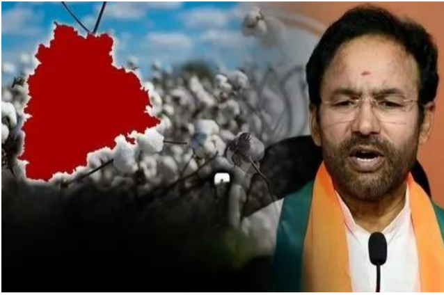
కేంద్రంలో అమ్ముకోవచ్చని అన్నారు. పత్తి శుద్ధి, రవాణా కోసం జిన్సింగ్ మిల్లలను ఎంపిక చేయడం జరిగిందన్నారు. హై డెన్సిటీ ఫ్లాంటేషన్ వల్ల పంట దిగుబడి డబుల్ అవుతుందని తెలిపారు. మహారాష్ట్ర ఆకాశ ప్రాంత ప్రజలు హై డెన్సిటీ ఫ్లాంటేషన్ చేస్తున్నారని.. హై డెన్సిటీ ఫ్లాంటేషన్ అవగాహన కోసం అవసరమైతే రైతులను మహారాష్ట్రకు తీసుకెళ్లాలని చెప్పారు. వచ్చే ఏడాది నుంచి మన రైతులు హై డెన్సిటీ ఫ్లాంటేషన్ చేసేలా పని చేస్తామన్నారు. కిసాన్ యాప్ దీపావళి నుంచి అందుబాటులోకి వస్తుందని తెలిపారు. పచ్చిపత్తి కనీస మద్దతు ధర వంద శాతం పెరిగిందన్నారు. సకీల విత్తనాలు విషయంలో ప్రభుత్వం కఠినంగా

హైదరాబాద్, అక్టోబర్ 17: కేంద్ర ప్రభుత్వం పత్తిని పూర్తి స్థాయిలో కొనుగోలు చేస్తుందని కేంద్రమంత్రి కిషన్ రెడ్డి స్పష్టం చేశారు. శుక్రవారం మీడియాతో మాట్లాడుతూ.. తెలంగాణలో పరిశోధన పాటు అత్యధికంగా సాగువుతున్న పంట పత్తి అని.. రాష్ట్రంలో 45లక్షల ఎకరాల్లో పత్తి సాగు అవుతోందని తెలిపారు. 22 లక్షలకు పైగా రైతులు పత్తిని పండిస్తున్నారు. గతేడాది మాదిరిగానే ఈ ఏడాది కూడా కాటన్ కార్పొరేషన్ ఆఫ్ ఇండియా కొనుగోలు చేస్తుంది వెల్లడించారు. రాష్ట్ర ప్రభుత్వం కూడా పూర్తి స్థాయిలో సహకారం అందిస్తోందన్నారు. పత్తి రైతులు దశా రుల చేతిలో పడి మోస పోవద్దని సూచించారు. కేంద్ర ప్రభుత్వం చివరి క్వింటాల్ వరకు కొనుగోలు చేస్తుంది ప్రకటించారు. క్వింటాల్ పత్తి రూ.8,110 ధరకు సీసీబి ద్వారా కొనుగోలు చేస్తుందన్నారు. తెలంగాణలో పత్తి సాగు ఉత్పత్తి పెరుగుతోందని.. పత్తి ఉత్పత్తిలో దేశంలోనే తెలంగాణ ముందు ఉందన్నారు. కొనుగోలు కేంద్రాలను మరో 12 పెంచాను.. మొత్తం 122 కొనుగోలు కేంద్రాలు పని చేస్తున్నాయని తెలిపారు కేంద్ర మంత్రి. పత్తి సాగు ఉత్పత్తిలో సంస్కరణలు తీసుకువస్తున్నామన్నారు. తొమ్మిది ప్రాంతీయ భాషల్లో పత్తి సాగుకు సంబంధించి కిసాన్ యాప్స్ తీసుకొచ్చామని.. యాప్లో రైతులు సమాచారం చేసుకుంటే.. స్లాట్ ద్వారా పత్తిని కొనుగోలు