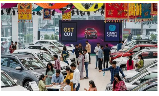
వినియోగదారులు హైలైడ్ కార్లను ఇష్టపడుతున్నారని, పెట్రోల్ కార్లు 30 శాతం మంది, ఎలక్ట్రిక్ కార్లకు 21శాతం మంది ప్రాధాన్యం ఇచ్చినట్లుగా సర్వే తెలిపింది.భారత్ లో యూఎస్ వీల ఆధిపత్యం కొనసాగిస్తుందని.. 64శాతం మంది యూఎస్ వీలను కొనుగోలు చేయనున్నట్లుగా సర్వేలో చెప్పారు. మార్కెట్ లో ఎన్ యూవీల వాల్యూ 65శాతం ఉంది. ఇది రెండేళ్ల కిందట దాదాపు 50శాతం మాత్రమే ఉంది. 34శాతం మంది కొనుగోలుదారులు భద్రత అత్యంత ప్రాధాన్యం అంశమని పేర్కొన్నారు. కఠినమైన భద్రతా నిబంధనలు, క్రాష్ టెస్ట్ పై అవగాహన, అధునాతన సెక్యూరిటీ ఫీచర్స్ తో కూడిన కార్లను

యావత్ దేశం దీపావళి పండుగకు సిద్ధమైంది. ఈ క్రమంలో వాహన మార్కెట్ కు భారీగా డిమాండ్ పెరుగుతున్నది. పండుగ సీజన్ లో పెద్ద సంఖ్యలో జనం కార్లను కొనుగోలు చేసేందుకు ఆసక్తి చూపిస్తున్నారు. ఈ క్రమంలో గ్రాంట్ థార్సన్ ఇండియా నిర్వహించిన ఓ సర్వే నిర్వహించింది. దేశవ్యాప్తంగా 2800 మంది అభిప్రాయాలు సేకరించింది. సర్వే ప్రకారం.. మారుతున్న జీవనశైలి, కొత్త సాంకేతిక పరిజ్ఞానం, జీవన్మయ 2.0 వంటి ప్రభుత్వ సంస్కరణలు మార్కెట్ కు బూస్ట్ ఇచ్చాయని సర్వే పేర్కొంది. సర్వేలో పాల్గొన్న 41శాతం మంది రాబోయే మూడునాలుగు నెలల్లో కొత్తగా కారును కొనుగోలు చేయాలని యోచిస్తున్నట్లుగా చెప్పారు. 72శాతం మంది జీవన్మయ మార్పులతో కార్ల కొనుగోలును వాయిదా వేసినట్లు చెప్పారు. గ్రాంట్ థార్సన్ విశ్లేషకుడు సాకేత్ మెహ్రా మాట్లాడుతూ.. ఈ పండుగ సీజన్ లో అమ్మకాలకు అవకాశం మాత్రమే కాదని.. వినియోగదారుల ప్రవర్తనలో మార్పులను ప్రతిబింబిస్తుందన్నారు. వాహనాల కొనుగోలుదారులు భద్రతతో పాటు ప్రీమియం ఫీచర్స్ కోసం ఆదనంగా చెల్లించేందుకు సిద్ధంగా ఉన్నారన్నారు. జీవన్మయ సంస్కరణలతో వాహనాల ధరలు తగ్గాయని, డిజిటల్ ఫ్లాట్ ఫారమ్ లు ప్రజలు కార్లను కొనుగోలు చేసే విధానాన్ని పూర్తిగా మార్చివేశారున్నారు. 38 శాతం మంది