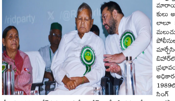
చేశారు. 1989 లోకీసభ ఎన్నికల్లో రాజీవ్ గాంధీ సారథ్యంలోని కాంగ్రెస్ మెజార్టీ సాధనలో విఫలమైంది. బోఫోర్లో కుబ్జకాం తర్వాత కాంగ్రెస్ కు రాజీనామా చేసిన వీపీ సింగ్ జనతాదళ్ పార్టీని ఏర్పాటు చేశారు. బీజేపీ మద్దతుతో కేంద్రంలో వీపీ సింగ్ సారథ్యంలో యువైబిడి ప్రెజ్ ప్రభుత్వం ఏర్పాటైంది. 1990 ఆగస్టులో వీపీ సింగ్ సర్కార్ బీసీలకు విద్యా ఉద్యోగాల్లో 27శాతం రిజర్వేషన్లు కల్పించాలన్న మందల్ కమిషన్ సిఫార్సులను అమలుచేయాలని నిర్ణయించింది. దీంతో దేశవ్యాప్తంగా పెద్దఎత్తున ఆందోళనలు ఉద్వేగపడిన ఎగిసిపడ్డాయి. రిజర్వేషన్లకు వ్యతిరేకంగా ఎంతో మంది యువకులు ఆత్మాహుతికి

బీహార్ : బీహార్ అంటే లాలూ, లాలూ అంటే బీహార్ అనే విధంగా మూడు దశాబ్దాలు అక్కడి రాజకీయాలను శాసించారు ఆర్డీకి అధినేత లాలూప్రసాద్ యాదవ్. ముస్లిం-యాదవ్ ఓటు బ్యాంకుతో బీహార్ రాజకీయాలను ఒంటితేలితో నడిపారు. అందుకు మందీర్, మందల్ అంశాలు ఆయనకు ఎంతోగానో ఉపయోగపడ్డాయి. ప్రస్తుతం అనారోగ్య సమస్యలతో బాధపడుతున్న ఆయన, వెనకబడితే కార్యాచరణ తన కుమారుడు, రాజకీయ వారసుడు తేజస్వీయ్యాదవ్ ను ముందుకు నడుపుతున్నారు. ముస్లిం-యాదవ్ ఫార్ములాతో ఆర్డీకి పూర్వజైవం తేవటం సహజం తన కుమారుడు, రాజకీయ వారసుడు తేజస్వీ యాదవ్ ను సీఎం చేసేందుకు కార్యాచరణతో ముందుకు వచ్చిన శైలిలో వ్యూహాలు రచిస్తున్నారు. 1990లో మందీర్, మందల్ అంశాలు దేశ రాజకీయాలను పూర్తిగా మార్చాయి. వెనుకబడిన తరగతులకు రిజర్వేషన్లు కల్పించాలన్న మందల్ కమిషన్ సిఫార్సులను అమలు చేయాలని అప్పటి ప్రధాని వీపీ సింగ్ నిర్ణయించగా, బీజేపీ సీనియర్ నేత లాల్ కృష్ణ అద్వాణీ అతియవై ఎల్పీ అద్వాణీ అయోధ్యలో రామమందిరం నిర్మించాలని డిమాండ్ చేశారు. ఒకరు రాజకీయాల్లో వీపీ కార్డును కీలకంగా మార్చగా, మరొకరు ఇద్దరు ఎంపీలు ఉన్న బీజేపీని ప్రపంచంలోనే అతిపెద్ద రాజకీయపార్టీగా అవతరించేందుకు కారణమయ్యారు. అయితే ఆ 2 అంశాలను తనకు అనుకూలంగా మార్చుకున్న లాలూ, 3 దశాబ్దాలపాటు బీహార్ ఎన్నికల్లో వరుస విజయాల సమోదం