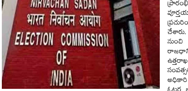
ప్రారంభించే పని జరుగుతోందని.. ప్రారంభంపై తుది నిర్ణయం ఎన్నికల కమిషన్ తీసుకుంటుందని ప్రధాన ఎన్నికల కమిషనర్ జ్ఞానేష్ కుమార్ గత సోమవారం తెలిపారు. ఈ నెల ప్రారంభంలో

దేశవ్యాప్తంగా ఓటరు జాబితా సృష్టణ ఇంటినిస్పెక్టివిటీ రివిజన్ ప్రక్రియను కేంద్ర ఎన్నికల కమిషన్ దశలవారీగా ప్రారంభించే అవకాశం ఉన్నది. వచ్చే ఏడాది అసెంబ్లీ ఎన్నికలు జరుగుతున్న రాష్ట్రాల్లో సర్ ప్రక్రియ ప్రారంభమయ్యే అవకాశం ఉందని ఈసే అధికారులు తెలిపారు. సైనిక ఎన్నికలు, ఎన్నికలు జరుగుతున్న జరుగుతున్న రాష్ట్రాల్లో సృష్టణ డ్రైవ్ ఉండదని పేర్కొన్నారు. ఎన్నికల యంత్రాంగం సైనిక సంస్థల ఎన్నికలతో బిజీగా ఉంది. దాంతో సర్పై దృష్టి పెట్టలేమని ఈసే చెబుతున్నది. వచ్చే ఏడాది అసెం, కేరళ, పుదుచ్చేరి, తమిళనాడు, పశ్చిమ బెంగాల్ రాష్ట్రాల అసెంబ్లీ ఎన్నికలు జరుగుతున్న విషయం తెలిసింది. ఈ ఐదు రాష్ట్రాలతో పాటు తొలి దశలో ఈ ఐదు రాష్ట్రాల్లో సృష్టణ ఇంటినిస్పెక్టివిటీ రివిజన్ ప్రక్రియ ప్రారంభించే ఛాన్స్ ఉంది. ఇప్పటికే బీహార్ లో సర్ ప్రక్రియ పూర్తయ్యింది. 7.472 కోట్ల పేర్లతో తుది జాబితాను సెప్టెంబర్ 30న ఈసే ప్రచురించింది. అన్ని రాష్ట్రాల్లో ఓటర్ల జాబితా సవరణను