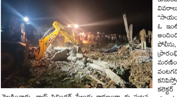
వెల్లింది. గ్యాస్ సిలిండర్ పేలుడు కారణంగా ఈ ఘటన జరిగిందని అంచనా వేశారు. సీఎం యోగి ఆదిత్యనాథ్ ముఖ్యమంత్రి యోగి ఆదిత్యనాథ్ ఈ ఘటనపై దిగ్రాంతి వ్యక్తం చేశారు. జిల్లా అధికారులకు తక్షణ సహాయక చర్యలు చేపట్టాలని, గాయపడిన వారికి తగిన వైద్యం అందించాలని అదేకాలు జారీ చేశారు. అటు ఈ ఘటనపై ఆరా తీసే మృతుల

ఉత్తరప్రదేశ్ : ఉత్తరప్రదేశ్ లోని అయోధ్య సమీప గ్రామంలో భారీ పేలుడు సంభవించింది. ఈ ఘటనలో ఐదుగురు దుర్మరణం చెందగా పలువురు గాయపడ్డారు. పగ్గా గ్రామంలో భారీ పేలుడు సంభవించి ఓ ఇల్లు కుప్పకూలింది. ఈ ఘటనలో పలువురు శిధిలాల కింద చిక్కుకుపోయారు. వెంటనే ఘటనాస్థలానికి చేరుకున్న రెస్క్యూ సిబ్బంది సహాయక చర్యలు చేపట్టారు. అయోధ్య జిల్లాలోని పూరా కలందర్ పోలీస్ స్టేషన్ పరిధిలోని పగ్గా గ్రామంలో గురువారం సాయంత్రం భారీ ప్రమాదం జరిగింది. ఒక్కసారిగా పేలుడు శబ్దం రావడంతో ఒక ఇల్లు కూలిపోయింది. ఈ ప్రమాదంలో చిక్కుకుని ఐదుగురు దుర్మరణం చెందారు. సమాచారం అందుకున్న వెంటనే పోలీస్ అధికారులు, రక్షణ బృందాలు అక్కడికి చేరుకుని రక్షణ చర్యలు ప్రారంభించాయి. బుల్ డోజర్ సహాయంతో శిధిలాలను తొలగించే సేవలు కొనసాగుతున్నాయి. ముందు జాగ్రత్తగా ముందు జాగ్రత్తగా మట్టుపట్టాల జిల్లాలోని వారిని భాగీ చేయించారు. క్షతగాతులను ఆస్పత్రికి తరలించారు. శిధిలాల కింద పలువురు చిక్కుకున్నారని, రెస్క్యూ ఆపరేషన్ కొనసాగుతున్నట్లు అధికారులు