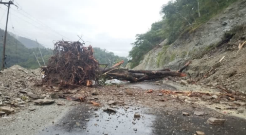
వర్షాలు కురుస్తున్నాయి. తీస్తా, మాల్ వంటి పర్వత ప్రాంత నదులు ప్రమాదకర స్థాయిలో ప్రవహిస్తున్నాయి. లోతట్టు ప్రాంతాలు నీలమునిగాయి. సిలిగూడి, బెంగాల్, డూయర్స్ ప్రాంతాల్లో కమ్యూనికేషన్, రవాణా సంబంధాలు దెబ్బతిన్నాయి. ఇదిలా ఉండగా వర్షాలు తగ్గు ముఖం పట్టే వరకు దార్జిలింగ్లోని వర్షాటక ప్రదేశాలను తాత్కాలికంగా మూసివేస్తున్నట్లు పేర్కొన్నారు. ఉత్తరాది జిల్లాల్లో సహాయక చర్యలకు తీవ్ర ఆటంకం ఏర్పడుతోంది. కొండచరియలు విరిగిపడి ప్రమాదం ఉందనే హెచ్చరికలతో దార్జిలింగ్లోని బైగర్ హిల్, రాక్ గార్డెన్లో సహాయక చర్యలకు ప్రదేశాలను మూసివేయాలని స్థానిక యంత్రాంగం నిర్ణయించింది. దార్జిలింగ్ టూమ్ బ్రెన్ సర్వీసులను నిలిపి

దార్జిలింగ్ : శనివారం రాత్రి నుంచి ఎడతెరిపిలేకుండా కురుస్తున్న భారీ వర్షాల కారణంగా బంగాల్ దార్జిలింగ్ జిల్లాలోని మిరిక్తో పాటు సుఖియా పాహార ప్రాంతాల్లో మట్టిపెళ్లలు విరిగిపడి 17 మందికి పైగా మృతిచెందినట్లు తెలుస్తోంది. మృతుల్లో పలువురు చిన్నారులు ఉన్నట్లు పోలీసులు తెలిపారు. వెంటనే అక్కడకు చేరుకున్న వివేక్ నిర్మాణ సిబ్బంది సహాయక చర్యలు చేపట్టారు. గాయ పడ్డవారిని రక్షించి ఆస్పత్రులకు తరలించారు. నదులు ప్రమాదకర స్థాయిలో ప్రవహిస్తున్నాయి. విచారణ వ్యక్తం చేసిన ప్రధాని మోదీమోక్షి ప్రైవేట్ బంగాల్ దార్జిలింగ్ ఫుటనపై ప్రధాని మోదీ విచారణ వ్యక్తం చేశారు. మృతుల కుటుంబాలకు ప్రగాఢ సంతాపం తెలిపారు. క్షతగాత్రులు త్వరగా కోలుకోవాలని ఆకాంక్షించారు. బాధితులకు అన్ని రకాల సహాయ చర్యలు అందించేందుకు కట్టుబడి ఉన్నామని హామీ ఇచ్చారు. భారీ వర్షాల దృష్ట్యా దార్జిలింగ్ ప్రాంతంలో పరిస్థితిపై నిశిత పరిశీలన చేస్తున్నామని పేర్కొన్నారు. మిరిక్, కర్పియాంగ్ పట్టణాలను కలిపే దుడియా ఇసుప వంతెన కూలి వాహనాలు రాకపోకలు నిలిచి పోయాయి. కొండచరియలు విరిగిపడి డాంగ్, సిక్కిం మధ్య రోడ్డు తెగిపోయాయి. దార్జిలింగ్-సిలిగూడి మధ్య ప్రధాన రహదారి దెబ్బతింది. ఫలితంగా కాలింపాంగ్ జిల్లాలోని లావా-గోరబత్ డ్రైవ్ గుండా రాకపోకలు సాగించాలని ప్రయత్నాలు చేపట్టారు. పోలీసులు సూచించారు. ముర్షిదాబాద్, బీర్బూమ్, నాడియా జిల్లాలతో పాటు దార్జిలింగ్, కాలింపాంగ్, కూన్ బెహార్, జైపుర్, అబిష్కాంబుల్ లో భారీ