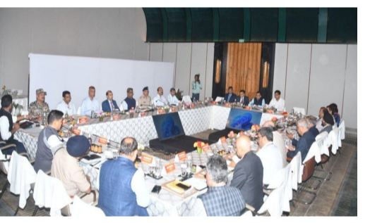
మాట్లాడుతూ చెప్పారు. ఎలక్షన్ కమిషన్ డిఎమ్ మొత్తం రెండ్రోజులూ బిహార్లోనే ఉందని, రాష్ట్ర పోలీసులు, ఎన్ఫోర్స్ మెంట్ ఏజెన్సీలు ఆధిపత్యం, నోడల్ అధికారులతో సమావేశాలు నిర్వహించామని చెప్పారు. ఛాత్ర పండుగను ఎంత ఉత్సాహంగా జరుపుకుంటామో అంతే ఉత్సాహంతో బిహార్ ఓటర్లు తమ ఓటు వాక్కు వినియోగించుకోవాలని కోరారు. ఎస్ఐఆర్ ప్రక్రియ విజయవంతమైనందుకు ప్రతి ఒక్కరికీ కృతజ్ఞతలు తెలియ