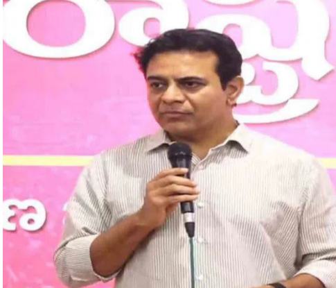
చార్జీపై కనీసం రేవంత్ 50 శాతం టిక్కెట్లు ధరలను పెంచడం రేవంత్ అనమర్గ విధానాలకు నిదర్శనం. రాజధానివాసుల నడ్డివిరిచి ప్రతినిత్యం దాదాపు కోటి రూపాయల భారం మోపాలని చూస్తున్న ముఖ్యమంత్రి హైదరాబాద్ ప్రజలపై కక్ష పెంచుకుంటున్నట్లు ఆర్థమవుతోంది. తుస్సుమన్న ప్రీ బస్సు పథకంతో దివాళా తీసిన ఆర్టీసీని గట్టికించాలనిపోయి, సామాన్య ప్రయాణికుల నడ్డి విరచాలని చూడటం క్షమించరానిది.' అని కేటీఆర్ ట్వీట్ చేశారు.

హైదరాబాద్ ప్రజలపై కక్ష పెంచుకున్నారని ఎక్కె వేదికగా మండిపడ్డారు. సీటీ బస్సు చార్జీలను ఒకటి కాదు రెండు కాదు.. ఏకంగా ఒకేసారి 10 రూపాయలు పెంచి జంట నగరంలోని పేద మధ్యతరగతి ప్రయాణికుల జేబులను కొల్లగొట్టాలని చూస్తున్న రేవంత్ రెడ్డి నిర్ణయాలు దుర్భాగ్యమని, పెరిగిన నిత్యావసర వస్తువుల ధరలతో అల్లాడుతున్న తరుణంలో.. ప్రతి ప్రయాణికుడిపై నెలకు 500 రూపాయల అదనపు భారం మోపితే బడుగుజీవులు ఎలా బతకాలో ముఖ్యమంత్రి సమాధానం చెప్పాలి. ఇప్పటికే విద్యార్థుల బస్ చార్జీలు, టీ-24 టిక్కెట్ల చార్జీలను పెంచింది చాలదన్నట్లు.. ఇప్పుడు కనీస