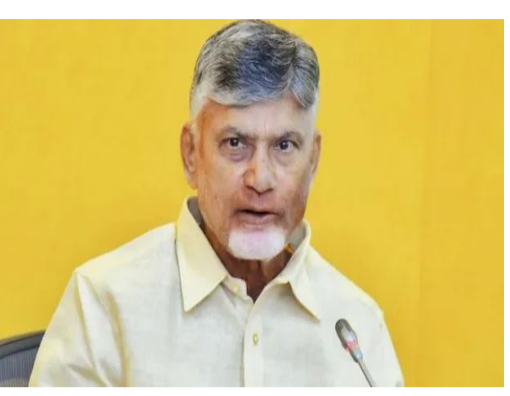
చేసేలా ప్రణాళికలు రచించాలని ముఖ్యమంత్రి మార్గనిర్దేశం

అమరావతి, అక్టోబరు5: శ్రీశైలం ప్రమాంబం మల్లికార్జున స్వామి దేవస్థానం అభివృద్ధి పై దేవదారు, అటవీశాఖలతో ఆంధ్రప్రదేశ్ రాష్ట్ర ముఖ్యమంత్రి నారా చంద్రబాబు నాయుడు (ఆదివారం) సమీక్ష సమావేశం నిర్వహించారు. ఈ సమీక్షకు దివ్యులీ సీఎం పవన్ కల్యాణ్, దేవదారుశాఖ మంత్రి ఆనం రామనారాయణ రెడ్డి, ఉన్నతాధికారులు హాజరయ్యారు. జ్యోతి ధీరం, శక్తివీరం కలిగిన దివ్యక్షేత్రంగా వెలుగుతున్న ఆలయ సమగ్రాభివృద్ధిపై చర్చించారు. ప్రతి ఏడాది లక్షల సంఖ్యలో భక్తులు వస్తున్నందున వారికి మెరుగైన సౌకర్యాల కల్పించే ప్రణాళికలపై దిశానిర్దేశం చేశారు సీఎం చంద్రబాబు. తిరుమల తరహాలోనే శ్రీశైల క్షేత్రాన్ని అభివృద్ధి చేసేలా కార్యాచరణకు ముఖ్యమంత్రి ఆదేశాలు జారీ చేశారు. ఆధ్యాత్మికంగా, పర్యాటక ప్రాంతంగా, పర్యావరణ పరంగా శ్రీశైలం ప్రాంతాన్ని అభివృద్ధి