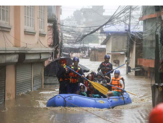
విరిగిపడింది తదితర ఉపద్రవాల సంభవించాయి. ఈ ఏడాది వర్షాలు గట్టిగా పడతాయనే అంచనా ఉన్నప్పటికీ, ఈనెల (అక్టోబర్) లో కురిసిన అకాల వర్షాల కారణంగా ఇంతటి నష్టం వాటిల్లడం ఆయన తెలిపారు. కార్యాచరణ వ్యాప్తిలో నడులు