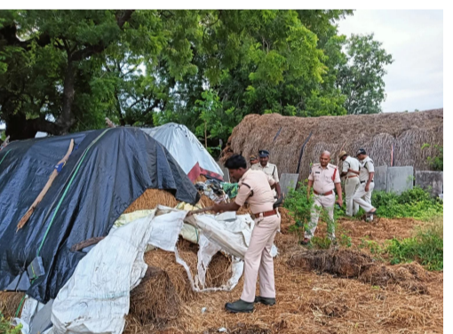
నేరచరిత్రలను, అసమానితుల ఇళ్లలో తనిఖీలు నిర్వహించారు. ఈ తనిఖీలలో సరైన ద్రువపత్రాలు లేని 16 మోటార్ సైకిళ్లు