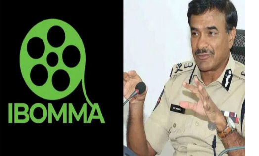
బహిష్కరణ పాటు మరో 65 పైరసీ వెబ్ సైట్లపై హైదరాబాద్ పైబర్ క్రైమ్ పోలీసులకు ఫిర్యాదు చేసింది. దీని ఆధారంగా దర్యాప్తు చేపట్టిన పోలీసులు.. దేశంలోనే అతి పెద్ద పైరసీ మూతాను అదుపులోకి తీసుకున్నారు. ఈ సందర్భంగా సీపీ సీపీ

రెండు తెలుగు రాష్ట్రాల్లో ఇప్పుడు సినిమా పైరసీ అంతం తీవ్ర చర్యలను యాంశంగా మారింది. హైదరాబాద్ పైబర్ క్రైమ్ పోలీసులు దేశంలోనే అతి పెద్ద సినిమా పైరసీ గ్యాంగ్ ను అదుపులోకి తీసుకున్నారు. ఈ సందర్భంగా పోలీసులు ఈ గ్యాంగ్ ని నిమాలను ఎలా కాపీ చేస్తుంది.. డిజిటల్ శాటిలైట్లను కూడా వీరు ఎలా ప్యాక్ చేస్తారో సీని ప్రముఖులకు వివరించారు. ఈ మూలలోని మొత్తం ఆరుగురిని అరెస్ట్ చేశారు. ఈ క్రమంలో పోలీసులు మైరెటెడ్ వెబ్ సైట్ల బహిష్కరణకు కుర్రుడా వార్షికోత్సవం ఇచ్చారు. త్వరలోనే బహిష్కరణ నిర్వాహకులను అరెస్ట్ చేస్తామని తెలిపారు. దీనిపై స్పందిస్తూ బహిష్కరణ నిర్వాహకులు చేసిన వ్యాఖ్యలు ఇప్పుడు సంవత్సరంగా మారాయి. ఇన్నాక్షన్ సీని నిర్వాహకులు, హీరోలను బెదిరిస్తూ వచ్చిన ఈ సైట్ నిర్వాహకులు.. ఇప్పుడు ఏకంగా హైదరాబాద్ పోలీసులనే బెదిరిస్తూ.. నోట్ విడుదల చేయడం సంవత్సరంగా మారింది. ఇటీవల తెలుగు ఫిల్మ్ ఛాంబర్ ఆఫ్ కామర్స్..