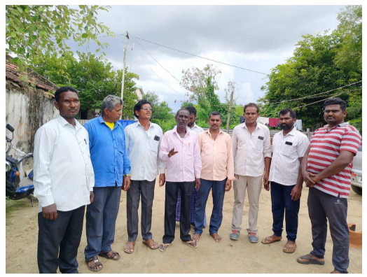
దండగలు వేస్తున్నట్లు మాకు సమాచారం అందుతుందని అంతే కాకుండా మా యూనియన్ పేరుని అవసరాల కోసం వాడుకుంటున్నారని కూడా తెలిసినందున ఇట్టి విషయాన్ని సంబంధిత అధికారులకు తెలియపరచి చట్టబద్ధ చర్యలు తీసుకోవడం

నమస్తే భారత్ :- మరెవర శ్రమి నెల ఒకటవ తారీఖున బిల్డింగ్ కార్మికులు సెలవు దినంగా పాటించాలని ఇది ఎన్నో సంవత్సరం నుంచి అనాదిగా వస్తున్న సెలవు దినమని వారన్నారు నెల మొత్తం కష్టపడి నెల మొదటి తారీకున యూనియన్ గ్రామ కమిటీల నుంచి మొదలుపెడితే రాష్ట్ర కేంద్ర కమిటీల వరకు యూనియన్ సమావేశాల్ని తమకు సంబంధించిన మంచి చెడ్డలను చర్చించుకుని మళ్లీ నెల రోజుల కార్యక్రమాన్ని ఎంపికాని పనిచేయడానికి సానుకూలంగా ఏర్పరచుకోని రోజు నెల మొదటి తారీకున కాపున బిల్డింగ్ కార్మికులందరూ ఈ విధివిధానాలను అమలు చేస్తూ ప్రతి మొదటి తారీఖున సెలవు దినంగా ప్రకటించాలని వారు కోరారు కొంతమంది యూనియన్ తో సంబంధం లేకుండా మా యూనియన్ పేరు ఉపయోగించుకుని మొదటి తారీకున పని చేస్తున్న కార్మికుల దగ్గర నుండి