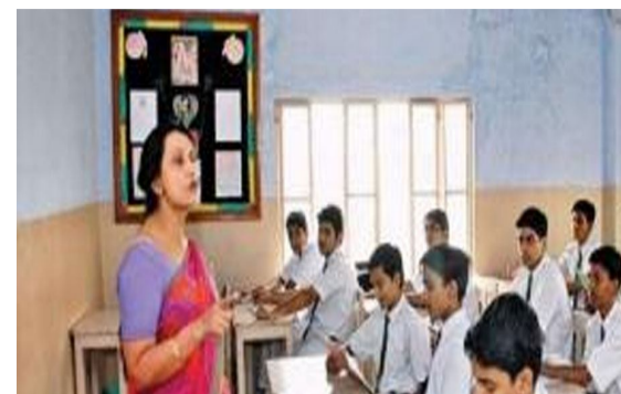
కౌన్సిలింగ్ ఇచ్చారు.ఈనెల 3 నుంచి 10వతేదీ వరకు శిక్షణ ఉంటుందనీ, అందుకు అవసరమైన ఏర్పాట్లు చేపట్టాలని

అనంతపురం: డిఎస్సీ-2025 ద్వారా ఎంపికైన కొత్త టీచర్లకు ఈ నెల 3వ తేదీ నుంచి శిక్షణ ఇవ్వనున్నారు. నియామక పత్రాలు అందజేసే సమయంలోనే అక్టోబరు 3నుంచి 13వ తేదీ వరకు శిక్షణ ఉంటుందని విద్యాశాఖ కమిషనర్ షెష్యూల్ ప్రకటించిన విషయం విదితమే. ముందే కౌన్సిలింగ్ నిర్వహించి, ఫ్లెక్స్ మెంట్ ఇచ్చి 4 నుంచి 13 వరకు శిక్షణ ఉంటుందని మళ్లీ చర్చ సాగింది. దీనిపై కమిషనర్ విజయరామరాజు తాజాగా