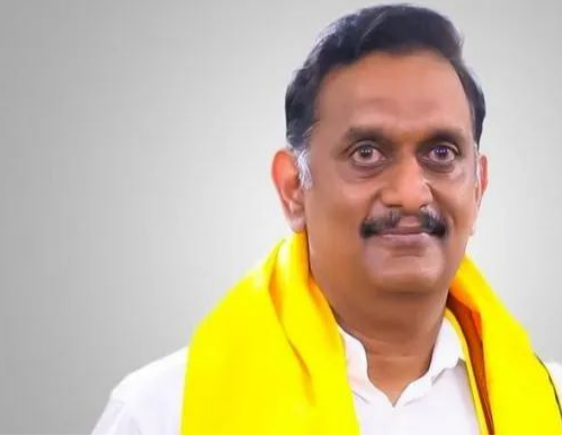
తాను భాగస్వామ్యం కావడం చాలా ఆనందంగా ఉందన్నారు. వర్షాలు పడినా.. ప్రజల ఆదరణ మాత్రం తగ్గలేదని తెలిపారు. సీసీ, సాంస్కృతిక రాజధానిగా విజయవాడ ఒక వెలుగు వెలిగిందని గుర్తు చేశారు. ఇప్పుడు ఆస్థాయిలో మళ్లీ గత వైభవం తెచ్చేలా విజయవాడ ఉత్సవ కార్యక్రమాలు ఉన్నాయని పేర్కొన్నారు. విజయవాడ ఉత్సవ కమిటీ సభ్యులు రాత్రింబవళ్లు కష్టపడి పని చేశారని స్పష్టం చేశారు. నాలుగు ప్రదేశాలలో