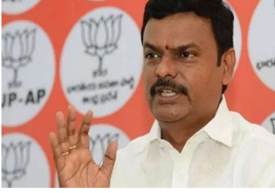
భారత దేశం అన్ని విధాలా వృద్ధి చెందిందని చెప్పుకొచ్చారు. 2014 నుంచి మోదీ స్వాధీనం అందుకుంటున్న బలంగా వేశారన్నారు. అంతర్జాతీయ యోగా డేను జూన్ 21న ప్రపంచం మొత్తం జరిపేలా మోదీ చేశారని తెలిపారు. మేకే ఇన్ ఇండియా, ఈజ్ ఆఫ్ డూయింగ్ ద్వారా అభివృద్ధికి బాటలు వేశారన్నారు. కుటీర పరిశ్రమలకు ప్రత్యేక ప్యాకేజీ లు కూడా ఇచ్చారని.. కోవిడ్ సమయంలో వ్యాక్సిన్ మనమే తయారు చేసే అనేక