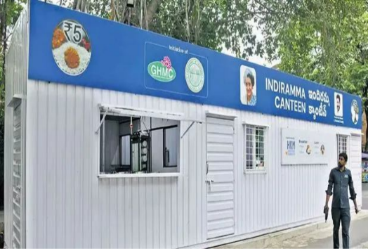
వచ్చి.. అయిపోవడంతో నిరాశగా వెనుదిరుగుతున్నారు. క్యాంపేన్లు ప్రారంభమైన రెండో రోజే ఇలాంటి పరిస్థితి తలెత్తడం

హైదరాబాద్: హైదరాబాద్ నగరంలో నివాసం ఉండే పేదలు, రోజు వారి కూలీలకు తక్కువ ధరకే కడుపు నిండా భోజనం అందించాలనే ఉద్దేశంతో కాంగ్రెస్ ప్రభుత్వం జీకాన్ఎంపీ పరిధిలో ఇందిరమ్మ క్యాంపేన్లు తెరిచింది. మధ్యాహ్నం భోజనం, ఉదయం అల్పాహారం ఏర్పాటు సరే ఇక్కడ కేవలం 5 రూపాయలకే లభిస్తుంది. ఇప్పటికే మధ్యాహ్నం అందించే భోజనానికి మంచి ఆదరణ అభిసోంది. దీన్ని దృష్టిపెట్టుకున్న తెలంగాణ సర్కార్.. మధ్యాహ్నం భోజనం మాదిరి ఉదయం టిఫిన్ కూడా రూ.5కే అందించేందుకు ముందుకు వచ్చింది. ఇందుకోసం నగరంలోని పలు ప్రాంతాల్లో ఇందిరమ్మ క్యాంపేన్లు తెరిచారు. రెండు రోజుల క్రితమే వీటిని ప్రారంభించారు. పేదల కడుపు నింపడం కోసం తీసుకువచ్చిన ఈ క్యాంపేన్లు.. వారికి మాత్రం నిరాశనే మిగులుతున్నాయి. పాపం పేదవారు టిఫిన్ కోసం ఇందిరమ్మ క్యాంపేన్ వద్దకు