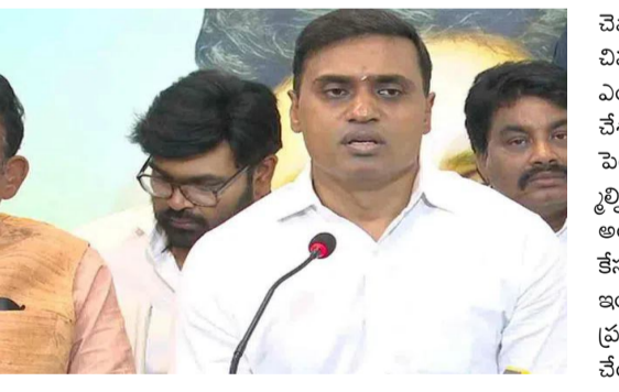
ఆనందం తప్ప ఇంకా మరేమీ లేదని విమర్శించారు. నన్ను అరెస్టు చేసి నా తల్లిదండ్రులను మనోవేదనకు గురిచేశారని

విజయవాడ : రాజమండ్రి సెంట్రల్ జైలులో తనను ఒక టెర్రరిస్ట్ మారింగా డ్రీట్ చేశారని వైసీపీ ఎంపీ విఘ్నేశ్వర్ రెడ్డి సంచలన వ్యాఖ్యలు చేశారు. ఎవరితో మాట్లాడనివ్వలేదని.. సీసీ కెమెరాలతో నిఘా పెట్టి, విజయవాడ నుంచి మనీటరీంగ్ చేశారని అన్నారు. అధికారులు కూడా తనతో మాట్లాడాలంటే భయపడే పరిస్థితి ఉండేదని. తనతో ఏ అధికారి కూడా మాట్లాడలేదని పేర్కొన్నారు. ఏపీ లిక్కర్ సాగులో రాజమండ్రి సెంట్రల్ జైలులో రిమాండ్ ఖైదీగా ఉన్న మిథున్ రెడ్డి తాజాగా జైలు నుంచి డియల్ పై విడుదల అయ్యారు. ఈ సందర్భంగా తిరుపతిలో ఆయన మీడియాతో మాట్లాడారు. తాను అక్రమ కేసులతో అరెస్టయ్యాడని అన్నారు. డి.పీ. ప్రభుత్వం తనపై తప్పుడు కేసులు పెట్టి వేధించిందని తెలిపారు. ఇలా అక్రమ కేసులు పెట్టి సాధించిందంటే ప్రశ్నించారు. పైకాచిక