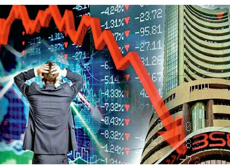
భారత్ కలిగి ఉన్న జనరల్ ఔషధాలను కూడా కవర్ చేస్తాయనే భయాలను కూడా ఉన్నాయి. వోకార్డ్, కాఫీన్ పాయింట్ వంటి చిన్న ఔషధ కంపెనీలు షేర్లు 10% వరకు పడిపోయాయి. సస్ ఫార్మా షేర్లు 52 వారాల కనిష్ట స్థాయికి చేరుకున్నాయి. స్టాక్ మార్కెట్ క్షీణతకు విదేశీ పెట్టుబడిదారులు అమ్మకాలు జరపడం కూడా ఒక ప్రధాన కారణం. శుక్రవారం విదేశీ పెట్టుబడిదారులు రూ.16,057.38 కోట్ల విలువైన దేశీయ వాటాలను విక్రయించారు. అదే సమయంలో భారతీయ పెట్టుబడిదారులు ఒక ప్రధాన కారణం. శుక్రవారం విదేశీ పెట్టుబడిదారులు రూ.16,057.38 కోట్ల విలువైన దేశీయ వాటాలను విక్రయించారు. అదే సమయంలో భారతీయ పెట్టుబడిదారులు ఒక ప్రధాన కారణం. శుక్రవారం విదేశీ పెట్టుబడిదారులు రూ.16,057.38 కోట్ల విలువైన దేశీయ వాటాలను విక్రయించారు. అదే సమయంలో భారతీయ పెట్టుబడిదారులు ఒక ప్రధాన కారణం. శుక్రవారం విదేశీ పెట్టుబడిదారులు రూ.16,057.38 కోట్ల విలువైన దేశీయ వాటాలను విక్రయించారు.

స్టాక్ మార్కెట్లలో నష్టాలు కొనసాగుతున్నాయి. ఈ కాలంలో భారత స్టాక్ మార్కెట్ తీవ్ర క్షీణతను సహించింది. ఈ క్షీణత చాలా తీవ్రంగా ఉండటంతో పెట్టుబడిదారులు కేవలం ఐదు రోజుల్లోనే రూ.16 లక్షల కోట్ల కోల్పోయారు. శుక్రవారం ఒక్క రోజే సుమారు రూ.7 లక్షల కోట్ల నష్టం వాటిల్లింది. శుక్రవారం సెన్సెక్స్ 733.22 పాయింట్లు లేదా 0.90% పడిపోయి 80,426.46 వద్ద ముగిసింది. దీనితో గత వారంలో దాదాపు 2,587 పాయింట్ల క్షీణతను సహించింది. ఇంతలో నిస్సీ 50 కూడా 236.15 పాయింట్లు లేదా 0.95% పడిపోయి 24,654.70 వద్ద ముగిసింది. అమెరికా అర్థవ్యవస్థ దౌర్జన్యం (బ్రంట్ %ఎ-1డి) వీసాల కోసం ఫిజులను పెంచాలని తీసుకున్న నిర్ణయం కారణంగా బట్టి స్టాక్లు ఒత్తిడిలో ఉన్నాయి. దీని కారణంగా బట్టి స్టాక్లు అత్యధికంగా క్షీణించాయి. దీని కారణంగా శుక్రవారం నిస్సీ బట్టి అత్యధికంగా నష్టపోయింది. టీసీఎస్, హెచ్ఎస్ఎల్ఐ, ఇన్ఫోసిస్ వంటి భారతీయ బట్టి కంపెనీలు షేర్లు శుక్రవారం పరుగులు ఆలో సెషన్లో క్షీణతను సహించి చేశాయి. నిస్సీ బట్టి ఇండెక్స్ 8% తగ్గింది. టీసీఎస్ అతిపెద్ద నష్టాన్ని చవిచూచింది. టీసీఎస్ 52 వారాల కనిష్ట స్థాయికి పడిపోయింది. అలాగే ఈ వారం మార్చి 2020 తర్వాత టీసీఎస్కు అత్యధికంగా దారుణంగా ఉంది. బట్టి స్టాక్లో ఆరు రోజుల క్షీణత మార్కెట్ క్రాష్ లో రూ.2 లక్షల కోట్లకు పైగా నష్టాన్ని కలిగించింది. ట్రాండ్, పేపెర్ల పొందిన ఔషధాల దిగుమతులపై ఆక్టోబర్ 1 నుండి 100% సుంకాన్ని బ్రంట్ ప్రకటించారు. దీని తరువాత సస్ ఫార్మా, లుమినా, అబిలింట్ ఫార్మా, గ్లాండ్ ఫార్మా, సిప్టా, సహా అనేక భారతీయ ఔషధ కంపెనీలు షేర్లు శుక్రవారం 10% వరకు తగ్గాయి. ఈ సుంకాలు ఈ కంపెనీల పోర్ట్ఫోలియోలో గణనీయమైన