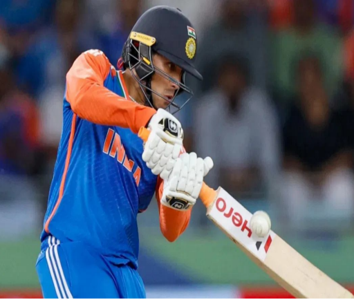
నాలుగు హాఫ్ సెంచరీలతో 106.33 సగటుతో 319 పరుగులు సాధించాడు. ఈ రికార్డును అధిగమించడానికి అభిషేక్కు కేవలం 11 పరుగులు మాత్రమే అవసరం. అంతేకాకుండా, ఒక టెస్ట్ ఆడి దేశం నుండి టీ20%×% టోర్నమెంట్ లేదా సిరీస్లో ఒక బ్యాట్లర్గా అత్యధిక పరుగులు చేసిన ఇంగ్లండ్ ఓపెనర్ ఫిల్ సాల్స్ రికార్డును కూడా అధిగమించడానికి అభిషేక్ శర్మ కేవలం 23 పరుగుల దూరంలో ఉన్నాడు. 2023లో వెస్టిండీస్ పర్యటన సందర్భంగా, సాల్స్ షేయర్ టీ20%×% మ్యాచ్లో రెండు సెంచరీలు, 119 అత్యుత్తమ

ఆసియా కప్ 2025 ఫైనల్లో దాదాపు దేశం పాకిస్తాన్తో తలపడటానికి టీమిండియా సిద్ధమవుతుంది. యంగ్ ఓపెనర్ అభిషేక్ శర్మ పలు రికార్డులను బద్దలు కొట్టే అంచనాలు నిలిచాయి. టీ20%×% క్రికెట్ దిగ్గజాలైన రోహిత్ శర్మ, విరాట్ కోహ్లి, మహ్మద్ రిజ్వాన్ వంటి అటగాళ్ల రికార్డులను అధిగమించే అవకాశం అతనికి దక్కింది. టోర్నమెంట్కు ముందు, ఇండియన్ ప్రీమియర్ లీగ్ (ఐపీఎల్)లో సెన్సెజెర్వ్ హైదరాబాద్ తరఫున ఆస్ట్రేలియన్ స్పిన్ ట్రావిస్ హెడ్తో కలిసి అదృతమైన ప్రదర్శనలతో అభిషేక్ శర్మపై చాలా అంచనాలు ఉండేవి. ఆసియా కప్లో ఇప్పటివరకు ఆడిన ఆరు మ్యాచ్లలో అభిషేక్ శర్మ 51.50 సగటుతో, 204.63 డ్రైట్ రేట్తో 309 పరుగులు సాధించి టాప్ రన్-గెటర్గా నిలిచాడు. ఇందులో మూడు హాఫ్ సెంచరీలు ఉన్నాయి. అన్నీ సూపర్ ఫోర్ దశలో పరుగులు వచ్చాయి. అతని అత్యుత్తమ స్కోరు 75 పరుగులు. అభిషేక్ శర్మ ఇప్పుడు ఒక మల్టీ-నేషన్ టీ20%×% టోర్నమెంట్లో ఒక భారతీయుడు చేసిన అత్యధిక పరుగుల రికార్డును బద్దలు కొట్టడానికి కేవలం 11 పరుగుల దూరంలో ఉన్నాడు. 2014 టీ20 ప్రపంచ కప్లో విరాట్ కోహ్లి షేయర్ ఆఫ్ ది టోర్నమెంట్ అవార్డును గెలుచుకున్నాడు. ఆ టోర్నమెంట్లో కోహ్లి ఆరు ఇన్నింగ్స్లో