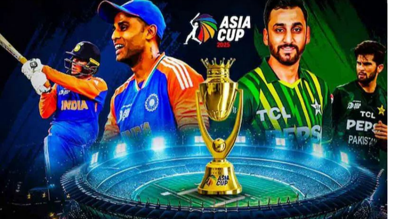
అమర్నాథ్, గవాస్కర్, కపిలేదేవ్, గుండప్ప విశ్వనాథ్, బేడీ, చంద్రశేఖర్, ప్రసన్న లాంటి వారు పాక్తో పోరాడారు. ఐపీఎల్ ఆగమనంతో భారత్ క్రికెట్ రూపుదిద్దుకోవడం ముఖ్యం. కోహ్లి, రోహిత్, సూర్యకుమార్ లాంటి క్రికెట్టర్లు ఆటలో భారత్ చిరస్మరణీయ విజయాలను సాధించింది. అంతమాత్రాన పాక్పై విజయాన్ని భూతద్దంలో చూడటం సరికాదు. ఇక్కడ భారత్ ప్రేక్షకులు ఒకటి గుర్తుంచుకోవాలి. బెన్సన్ హెడ్జెస్ పరల్లేక్వీ తర్వాత దశాబ్దం పాటు పాక్ చేతిలో ప్రతీసారి ఓటమిపాలయ్యాయి. షార్దాలో మియాందాద్ ఆఖరి బంతికి సిక్స్ కొట్టి పాక్ను గెలిపించడం ఎవరం మర్చిపోరాదు. ఆ తర్వాత కెనడాలో జరిగిన డ్వైవైక్వీ సిరీస్లో పోస్టోని దేబిషే మహాంతి సూపర్ బౌలింగ్తో పాక్ను చేసేకుంది. ఆ తర్వాత 1996 వరల్డ్ కప్లో పాక్పై జడ్జి అదృతం బ్యాట్లో ప్రదర్శించి అభిమానుల మదిల ఇప్పటికీ మెదలుతూనే ఉంటుంది. పాకిస్తాన్లో లంక జట్టుపై ఉగ్రదాడి తర్వాత ఏ జట్టు అక్కడ ఆడేందుకు ముందుకు రాలేదు. 1992 ప్రపంచ కప్ తర్వాత పాక్ మళ్లీ గెలుచుకుంది. ఇతర క్రికెట్లో భారత్పై పాక్ గెలుస్తున్నా.. క్రికెట్లో మాత్రం కొందరు యాంకర్లు యుద్ధాన్ని సృష్టించే ప్రయత్నం చేస్తున్నారు. ఈ మధ్య మైదానంలో రఫూఫ్, ఫర్హాన్ రెచ్చగొట్టే విన్నాసాలు ఈ క్రికెట్ మచ్చ తెచ్చాయి. భావోద్వేగాలు గురయ్యేది ప్రేక్షకులు తప్ప.. నిజమైన షేయర్లకు రాగొద్దేమి కాదు. గతంలో కత్తులు దూసుకున్న ఇమ్రాన్ ఖాన్, మియాందాద్, జహీర్ అబ్దుల్ మియాందాద్, గవాస్కర్, సిద్ధు, కపిలేదేవ్, గంగూలి మధ్య మంచి సంబంధాలు ఉన్నాయి. గతంలో ఒకసారి పాక్ను తీవ్రంగా వ్యతిరేకించిన బాల్ థ్రాస్టర్ 9% మియాందాద్ ను తన ఇండికి ఆహ్వానించాడంటే ఆ అభిమాని ఎలాంటిదో అర్థం చేసుకోవచ్చు. ప్రపంచంలో ఎన్నో దేశాలు యుద్ధాల్లో తలపడ్డాయి. వాటిని కెనడాలో జరిగిన డ్వైవైక్వీ సిరీస్లో పోస్టోని చాలాసంకేపడం పోరాడాయి. ఏ జట్టు మంచి ఆటను ప్రదర్శిస్తే ఆ రోజు విజయం వారిని వరిస్తుంది. ఆదివారం మ్యాచ్లో ఎవరు గెలిచి, ఓడినా క్రికెట్లో అంకితం కాదు లి. అనవసర భావోద్వేగాలు రెచ్చగొట్టవద్దు. క్రికెట్ ఇప్పుడు జెంటిల్మన్ గేమ్ కాదు.. ఇప్పుడు మర అంతం. మ్యాచ్లో అనవసర విషయాలు చొప్పించి, ఉద్రిక్తంగా రెచ్చగొట్టి వచ్చి గడు పుతున్నారు. వారి నుంచి దూరంగా కేవలం క్రికెట్ను ఆస్వాదిస్తూ ఎవరు గెలిచినా ఆటకు జై కొట్టాలి. ఇది ఆట మాత్రమే, యుద్ధం కాదు.