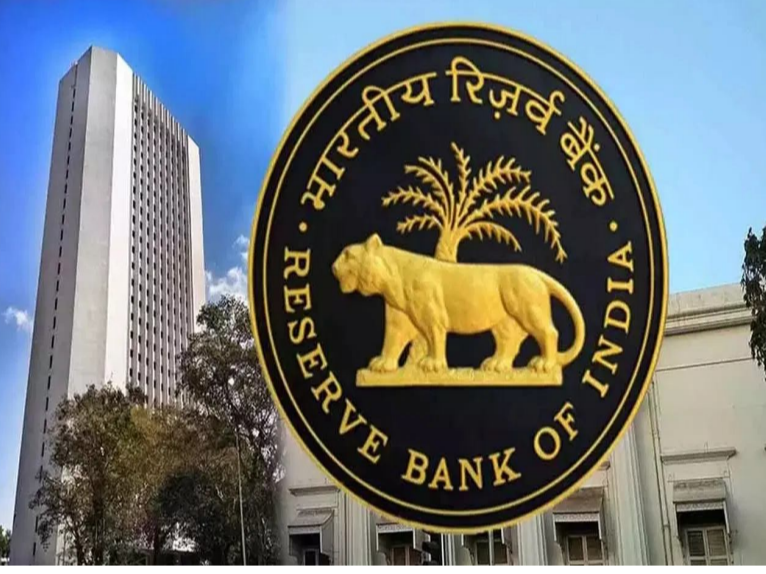
కంపెనీ అంతర్గత ఫిర్యాదుల పరిష్కార వ్యవస్థలో తీవ్రమైన లోపాన్ని ప్రతిబింబిస్తుంది. లావాదేవీలపై ప్రభావం లేదు: ఈ జరిమానా పూర్తిగా నియంత్రణ సమృద్ధి లోపాలపై ఆధారపడి ఉంటుందని ఆర్బిఐ స్పష్టం చేసింది. కంపెనీ తన కస్టమర్లతో కుదుర్చుకున్న ఏవైనా లావాదేవీలు, ఒప్పందాలు లేదా ఒప్పందాలు చెల్లుబాటు చేయాలని ఇది ప్రభావితం చేయదు. దీని అర్థం కస్టమర్లు చేసుకున్న లావాదేవీలు సురక్షితంగా ఉంటాయి. ఈ జరిమానాతో పాటు బయటపడితే కంపెనీపై మరిన్ని నియంత్రణ చర్యలు తీసుకోవచ్చని కూడా సెంట్రల్ బ్యాంక్ పేర్కొంది. ఈ నిర్ణయం ఆర్థిక సంస్థల పర్యవేక్షణ, నియంత్రణ కఠినతను ప్రతిబింబిస్తుంది. ఇది ఆర్థిక సంస్థల పారదర్శకత, జవాబుదారీతనాన్ని నిర్ధారించడం లక్ష్యాలు పెట్టుకుంది. కంపెనీకి పెద్ద సందేశం: జరిమానా ముఖ్యమైనది కాకపోయినా దాని సందేశం ముఖ్యమైనది. ఒప్పందాలు లేదా ఒప్పందాలు చెల్లుబాటు చేయాలని ఇది ప్రభావితం చేయదు. దీని అర్థం కస్టమర్లు చేసుకున్న లావాదేవీలు సురక్షితంగా ఉంటాయి. ఈ జరిమానాతో పాటు బయటపడితే కంపెనీపై మరిన్ని నియంత్రణ చర్యలు తీసుకోవచ్చని కూడా సెంట్రల్ బ్యాంక్ పేర్కొంది. ఈ నిర్ణయం ఆర్థిక సంస్థల పర్యవేక్షణ, నియంత్రణ కఠినతను ప్రతిబింబిస్తుంది. ఇది ఆర్థిక సంస్థల పారదర్శకత, జవాబుదారీతనాన్ని నిర్ధారించడం లక్ష్యాలు పెట్టుకుంది.

నాన్-బ్యాంకింగ్ ఫైనాన్షియల్ కంపెనీ ముత్తూట్ ఫిన్ కార్డ్ లిమిటెడ్ పై రిజర్వ్ బ్యాంక్ ఆఫ్ ఇండియా రూ.2.7 లక్షల జరిమానా విధించింది. అంతర్గత అంబుస్ మెన్ కు సంబంధించిన నియంత్రణ అడికాలను కంపెనీ పాటించినందుకు కేంద్ర బ్యాంకు ఈ చర్య తీసుకుంది. మార్చి 31, 2024 నాటికి కంపెనీ ఆర్థిక స్థితి ఆధారంగా ఈ జరిమానా విధించినట్లు శుక్రవారం విడుదల చేసిన ఒక ప్రకటనలో తెలిపింది. షోకాట్ నోటీసు కూడా జారీ: తనిఖీ సమయంలో కంపెనీ అనేక కీలక నియంత్రణ నిబంధనలను పాటించడం లేదని ఆర్బిఐ తెలిపింది. తదనంతరం ఉల్లంఘనలకు జరిమానా ఎందుకు విధించకూడదో అడుగు తూ కంపెనీకి షో-కాట్ నోటీసు జారీ చేసింది. ముత్తూట్ ఫిన్ కార్డ్ తన కేసును లిఖితపూర్వకంగా, వ్యక్తిగత విచారణలో సమర్పించింది. అయితే కంపెనీ లోపాలు తీవ్రమైనవిగా ఆర్బిఐ గుర్తించింది. అలాగే జరిమానా విధించాలని ఆడికారింబింది. పోస్టోనిలో అర్థవ్యవస్థ రాబడి అందించే 5 బెన్స్ స్కీమ్ ఇవ్వాలని పరిష్కార వ్యవస్థలో తోపాటు కంపెనీ అంతర్గత ఫిర్యాదుల పరిష్కార వ్యవస్థ ద్వారా పాక్షికంగా లేదా పూర్తిగా తీరనివిని ఫిర్యాదులను అంతర్గత అంబుస్ మెన్ కు స్వయంచాలకంగా చేరవేసే వ్యవస్థను ముత్తూట్ ఫిన్ కార్డ్ ఏర్పాటు చేయలేదని ఆర్బిఐ తన ఉత్తర్వులో పేర్కొంది. నిబంధనల ప్రకారం.. కస్టమర్లకు న్యాయమైన విచారణ జరిగేలా చూసుకోవడానికి అటువంటి ఫిర్యాదులను స్వయంచాలకంగా తదుపరి స్థాయికి చేరవేయాలి. ఈ మినహాయింపు