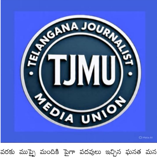
వరకు ముప్పై మందికి పైగా వదవులు ఇచ్చిన ఘనత మన