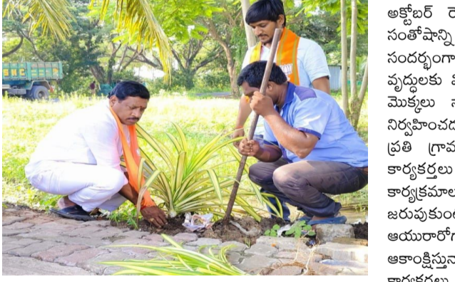
నరేంద్ర మోడీ పుట్టినరోజు వేడుకలను సెప్టెంబర్ 17 నుండి