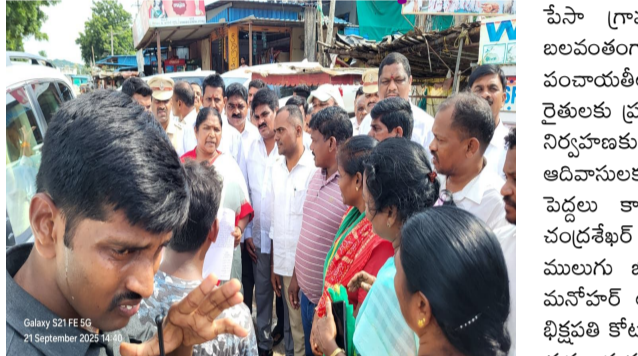
నియమించాలి మేడారం గ్రామ పరిధిలో రైతులు భూములు