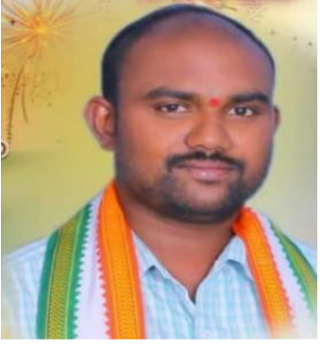
నారాయణపేట్ జిల్లా / నమస్తే భారత్ సెప్టెంబర్ 21