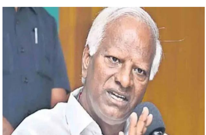
తెలంగాణ స్వీకర్ గడ్డం ప్రసాద్ కుమార్ శుక్రవారం నోటీసులు

వరంగల్, సెప్టెంబర్ 19: ఎమ్మెల్యేగా గెలిపిస్తే.. అభివృద్ధి చేస్తానని స్టేషన్ ఫున్చూర్ నియోజకవర్గ ప్రజలకు తాను మాట ఇచ్చానని ఎమ్మెల్యే కడియం శ్రీహరి వెల్లడించారు. తనను ప్రజలు నమ్మి ఎమ్మెల్యేగా గెలిపించారని ఆయన పేర్కొన్నారు. ఆ సెంటిమెంట్ వ్యక్తం చేస్తూ బీఆర్ఎస్ పార్టీ ఓటమితో ఈ నియోజక వర్గానికి అన్యాయం జరుగుతుందని తాను భావించానని తెలిపారు. ఈ నేపథ్యంలో కాంగ్రెస్ తరఫున పని చేస్తేనే నియోజకవర్గ అభివృద్ధి సాధ్యమని అనుకున్నానని చెప్పారు. దాంతో ఏడాదిన్నరగా కాంగ్రెస్ పార్టీతో కలిసి తాను పని చేస్తున్నానని ఎమ్మెల్యే కడియం శ్రీహరి స్పష్టం చేశారు. దేవారుల కాల్పులు బాగు చేయాలని సీఎం రేవంత్ కు కోరానన్నారు. అలాగే స్టేషన్ ఫున్చూర్ అభివృద్ధి పనులకు సీఎం రేవంత్ రెడ్డి అందగా ఉన్నారని పేర్కొన్నారు. నియోజకవర్గ అభివృద్ధికి సీఎం రేవంత్ రెడ్డి నిధులు సైతం అందించారని చెప్పారు. పార్టీ ఫిరాయింపులకు పాల్పడిన ఎమ్మెల్యేలకు