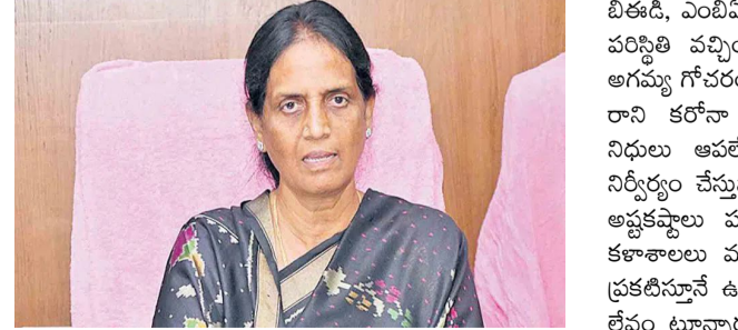
లేక మాత పదే స్థాయికి వచ్చాయి. హాజరు శాతం,ఉత్తీర్ణత అంటూ కొద్దిలు పెడుతూ పేద, మధ్యతరగతి విద్యార్థులను చదువుకు దూరం చేసే ప్రయత్నం జరుగుతుందన్నారు.కాంగ్రెస్ ప్రభుత్వ నిర్లక్ష్య కారణంగా రాష్ట్రవ్యాప్తంగా డిగ్రీ, పీజీ, ఫార్మసి,