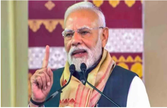
దేశ వ్యతిరేకలకు ఆ పార్టీ రక్షణ కవచంగా మారినది, వారితో కాటేజీ, జీఎన్ఎమ్ పాఠశాలను ప్రారంభించారు.

అస్సాం: ప్రధాని సరేంద్ర మోదీ ఈశాన్య రాష్ట్రాల పర్యటనలో భాగంగా ఆదివారం అస్సాం లో పర్యటించారు. దరంగ్ జిల్లాలో బీజేపీ శ్రేణులు ఏర్పాటు చేసిన బహిరంగసభలో ఆయన మాట్లాడుతూ.. కాంగ్రెస్ పై తీవ్ర విమర్శలు చేశారు. 1962లో చైనాతో యుద్ధం తర్వాత అప్పుడు ప్రధానిగా ఉన్న నెహ్రూ ఈశాన్య ప్రాంత ప్రజలకు చేసిన గాయాలు ఇప్పటికీ మానిపోలేదని అన్నారు. ఈ తరం కాంగ్రెస్ ఆ గాయాలపై ఉప్పు చల్లుతోందని విమర్శించారు. కాంగ్రెస్ తన రాజకీయాల కోసం భారత్ పై వ్యతిరేక భావజాలం ఉన్న వ్యక్తులతో జట్టు కట్టించి ప్రధాని మండిపడ్డారు. అవరేషన్ సిందూర్ సమయంలో కూడా ఇది బయటపడిందన్నారు. పాకిస్తాన్ లోని ఉగ్రవాదులను మన సైన్యం మట్టుబెట్టిందని, కానీ హస్తం పార్టీ మన సైన్యానికి కాకుండా దాయాది దేశంలోని సైన్యానికి మద్దతిస్తోందని విమర్శించారు. పాకిస్తాన్ అబద్ధాలు కాంగ్రెస్ కాంగ్రెస్ తన రాజకీయాల కోసం భారత్ పై వ్యతిరేక అజెండాలుగా మారుతున్నాయని ఎద్దేవా చేశారు. ప్రస్తుతం అక్రమణదారులకు,