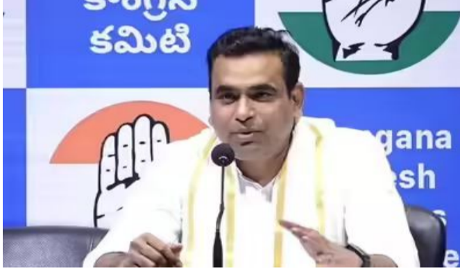
భావిస్తున్నారని చెప్పకొచ్చారు. రాజకీయ ప్రయోజనం తప్ప ప్రజల మీద బీఆర్ఎస్ నేతలకు ప్రేమ లేదని పేర్కొన్నా రు.రాజకీయ దురుద్దేశంతో కేటీఆర్ ప్రభుత్వంపై నిందలు

హైదరాబాద్: గ్రూప్-1 పరీక్షలపై మాజీ మంత్రి కేటీఆర్ చేసిన వ్యాఖ్యలను ఎంపీ చామల కిరణ్ కుమార్ రెడ్డి ఖండించారు. గ్రూప్-1 ఉద్యోగాలు కాంగ్రెస్ ప్రభుత్వంలో రాకూడదని కేటీఆర్ కుడుకు పన్నుతున్నారని ఆరోపించారు. పరీక్షలలో 563 అభ్యర్థుల దగ్గర 3 కోట్ల రూపాయల లెక్కన తీసుకొని ప్రభుత్వం వాళ్ళను ఎంపిక చేసేందని అబద్ధాలు చెబుతున్నారని మండిపడ్డారు. గత బీఆర్ఎస్ హయాంలో ఒక్క ఉద్యోగం కూడా ఇవ్వలేదని విమర్శించారు.సీఎం రేవంత్ రెడ్డి నిరుద్యోగం కోసం చిత్రశుద్ధితో పని చేస్తున్నారని ఎంపీ చామల కిరణ్ కుమార్ రెడ్డి తెలిపారు. తల్లిదండ్రుల, పిల్లల భవిష్యత్తును దృష్టిలో ఉంచుకుని ముందుకెళ్తున్నామని పేర్కొన్నారు. న్యాయనిపుణుల సలహాల తీసుకుని, ఎట్టి పరిస్థితుల్లో కూడా అడ్డంకులు రావద్దన్న సదుద్దేశంతో గ్రూప్-1 పరీక్షలు నిర్వహించామని గుర్తుచేశారు. 563 మంది పిల్లల తల్లిదండ్రులకు మూడు కోట్ల పెట్టే స్టోపత ఉంటుందా..? అని ఆయన ప్రశ్నించారు. బీఆర్ఎస్ పార్టీకి ఓటేయని ప్రజలు బాధపడుతూ ఉండాలని బీఆర్ఎస్ నేతలు