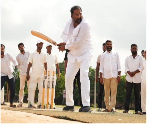
గురువులు సమాజానికి మార్గదర్శకులు - క్రీడలు ఆరోగ్యానికి ప్రతీక : మంత్రి శ్రీమతి