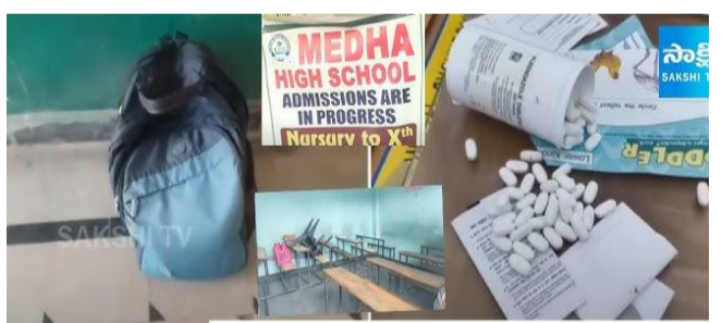
గుర్తించారు. పాటిని స్వాధీనం చేసుకున్నారు. మేధా పాఠశాలకు చెందిన వాత భవనంలో మత్తు పదార్థాల తయారీ జరుగుతున్నట్లు గుర్తించారు. ఈ కేసులో కొంతమందిని అదుపులోకి తీసుకుని ఈ విషయమై విచారిస్తున్నట్లు తెలిసింది. వారి వద్ద నుంచి 7 కిలోల అల్పాక్షరంతో పాటుగా 20 లక్షల రూపాయల నగదు, కల్పల్ కలిపే ఓ పాడర్ను ఈగల్ తీమ్ స్వాధీనం చేసుకుంది.ఈ వ్యవహారంలో మేధా స్కూల్ ప్రిన్సిపల్

హైదరాబాద్: హైదరాబాద్లో కలకలం రేపిన ఓల్డ్ బోయ్స్ పల్లె మేధా స్కూల్ వ్యవహారంలో కీలక పరిణామం చోటుచేసుకుంది. మేధా పాఠశాల అనుమతులను తెలంగాణ విద్యాశాఖ రద్దు చేసింది. మేధా పాఠశాలలో గుట్టుపప్పుడు కాకుండా అల్పాక్షరం తయారీ చేసేస్తూ వైసీపీ వెలుగు చూసిన సంగతి తెలిసిందే. ఈ కేసులో పోలీసులు ఇప్పటికీ నిందితులను అదుపులోకి తీసుకున్నారు. తాజాగా మేధా స్కూలుకు ఉన్న అనుమతులను తెలంగాణ విద్యాశాఖ రద్దు చేసింది. మేధా పాఠశాలలో చదువుతున్న విద్యార్థులకు ఇబ్బందులు కలగకుండా.. వారిని వేరే పాఠశాలలో చేర్పించేందుకు అధికారులు చర్యలు తీసుకుంటున్నారు.వాహనదారులకు బిగ్ అల్ట్రా.. బైక్ల నుంచి కార్ల వరకూ.. ఇకపై అవి తప్పనిసరి.బోయ్స్ పల్లె పోలీస్ స్టేషన్ పరిధిలోని మేధా పాఠశాలపై ఈగల్ తీం దాడులు నిర్వహించిన సంగతి తెలిసింది. స్కూల్లో గుట్టుపప్పుడు కాకుండా డ్రగ్స్ తయారీ చేస్తున్నారంటూ పోలీసులకు సమాచారం అందింది. దీంతో ఈగల్ తీమ్ దాడులు నిర్వహించింది. ఈ తనిఖీల్లో స్కూల్లో అల్పాక్షరం తయారు చేసే మెషిన్లను పోలీసులు