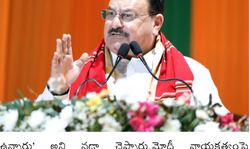
ఉన్నారని అని నర్సా చెప్పారు. మోడీ నాయకత్వంపై ప్రశంసలు ప్రధానమంత్రి నరేంద్ర మోడీ నాయకత్వంపై నర్సా

విశాఖపట్టు: భారతీయ జనతా పార్టీ 14 కోట్ల మంది సభ్యత్వంతో ప్రపంచంలోనే అతిపెద్ద పార్టీగా నిలిచిందని పార్టీ జాతీయ అధ్యక్షుడు, కేంద్ర ఆరోగ్య, కుటుంబ సంక్షేమ శాఖ మంత్రి జీపీ నర్సా తెలిపారు. ఈ 14 కోట్ల మందిలో 2 కోట్ల మంది యాక్టివ్ మెంబర్స్ ఉన్నట్లు చెప్పారు. ఆంధ్రప్రదేశ్ లోని విశాఖపట్టు లో ఆదివారంనాడు జరిగిన పార్టీ రాష్ట్రీయ అయిన ఈ విషయాలు తెలిపారు. ప్రపంచంలోనే అతిపెద్ద పార్టీ మనది. ఇందులో 14 కోట్ల మంది సభ్యులు ఉన్నారు. దేశంలోని 20 రాష్ట్రాల్లో ఎన్నో ప్రభుత్వాలు ఉన్నాయి. 13 రాష్ట్రాల్లో బీజేపీ ప్రభుత్వం ఉంది. దేశానికి ప్రాతినిధ్యం వహిస్తున్న అతి పెద్ద పార్టీ కూడా బీజేపీనే. పార్టీకి 240 మంది ఎంపీలు ఉన్నారు. సుమారు 1,500 మంది ఎమ్మెల్యేలు, 170 కి పైగా ఎమ్మెల్యేలు