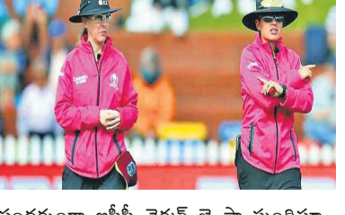
సందర్భంగా ఐసీసీ చైర్మన్ జై షా స్పందిస్తూ..

దుబాయ్: ఈ నెల 30 నుంచి భారత్, శ్రీలంక సంయుక్తంగా ఆతిథ్యమివ్వనున్న మహిళల వన్డే ప్రపంచకప్ లో అంపైరింగ్ బాధ్యతలను పూర్తిగా మహిళలే నిర్వహించనున్నారు. వన్డే ప్రపంచకప్ టోర్నీ చరిత్రలో మునుపెన్నడూ లేని విధంగా రాబోయే ఎడిషన్ లో ఫీల్డ్ అంపైర్లు, మ్యాచ్ రిఫరీలు అంతా మహిళలే ఉండనున్నారు. ఈ మేరకు ఐసీసీ గురువారం ఒక ప్రకటనలో ఈ విషయాన్ని వెల్లడించింది. ఈ