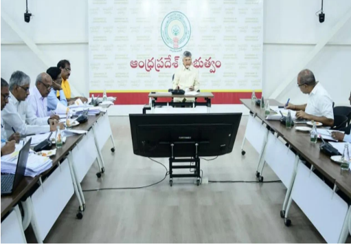
రెండు రోజుల్లో జరగనున్న కలెక్టర్ల సదస్సులో కీలక నిర్ణయాలు తీసుకోనున్నారు సీఎం చంద్రబాబు. ఈ సందర్భంలోనే రాష్ట్రంలో

గత కొద్ది రోజులుగా రాష్ట్రంలో పలువురు ఐఎస్ఎల్, ఐఎఫ్ఎస్ఎల్, ఐపీఎస్ లు బదిలీలు జరుగుతున్న సంగతి తెలిసి వుంటే. తాజాగా రాష్ట్రంలో 12 జిల్లాలకు కొత్తగా కలెక్టర్లుగా నియమితులైన అధికారులతో సీఎం చంద్రబాబు సమావేశం అయ్యారు. సీఎం చంద్రబాబు సామాన్యంగా ఉన్నట్లే కలెక్టర్లు కూడా ప్రజలతో సామాన్యంగా ఉండాలని ఆదేశాలు కూడా జారీ చేశారు. ఎవరైనా ఆరోపణలు చేస్తే వెంటనే స్పందించాలని కలెక్టర్లకు సూచించారు. ఎల్లప్పుడూ రూల్స్ అంటూనే కాకుండా మానవీయ కోణంలో కూడా ఆలోచించి అధికారులు పనిచేయాలన్నారు. ఇదిలా ఉండగా ఈనెల 15, 16 తేదీల్లో మరోసారి సీఎం చంద్రబాబు కలెక్టర్లతో సమావేశం కానున్నారు. సవిచారం 5వ ట్రాక్ మొదటి అంతస్తులో రెండు రోజుల పాటు కలెక్టర్ల కాన్ఫరెన్స్ జరగనుంది. ఈ సందర్భంలో సీఎం చంద్రబాబు నాయుడు కలెక్టర్ లకు దిశానిర్దేశం చేయనున్నారు. అయితే