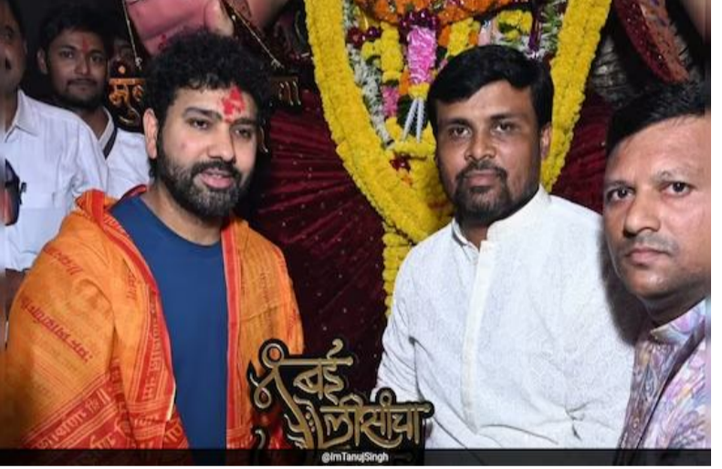
కూడా వార్తలు వస్తున్నాయి. రోహిత్ సన్నబడిన ఫోటోలు మీడియాలో వైరల్ అవుతున్నాయి

టీమిండియా దిగ్గజ అటగాడు, వన్డే కెప్టెన్ రోహిత్ శర్మ తాజాగా ముంబైలోని వన్డేలో సందడి చేశాడు. గణపతి పూజల కోసం ఓ మండపానికి వెళ్లిన రోహిత్ ను అతడి అభిమానులు చుట్టముట్టారు. రోహిత్ కారును కదలనిపడలేదు. దీంతో రోహిత్ కారు సన్ రూఫ్ నుంచి బయటకు వచ్చి అభిమానులకు అభివారం చేశాడు. దీంతో అభిమానులు.. 'ముంబైకా రాజా' అంటూ నినాదాలు చేశారు. ఈ వీడియో ప్రస్తుతం సోషల్ మీడియాలో వైరల్ గా మారింది. గత నాలుగు నెలలుగా విశ్రాంతి తీసుకుంటున్న రోహిత్ శర్మ అక్టోబర్లో ఆస్ట్రేలియాలో జరగబోయే వన్డే సిరీస్ కోసం సన్నద్ధమవుతున్నాడు. ఇటీవల బెంగళూరులోని సెంటర్ ఆఫ్ ఎక్స్లెన్స్ లో ఫిట్నెస్ పరీక్షకు హాజర్ పాసయ్యాడు. అంతే కాదు.. గత మూడు నెలల కాలంలో రోహిత్ శర్మ ఏకంగా 20 కిలోల బరువు తగ్గినట్లు