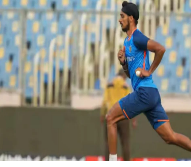
సాధించిన అత్యంత వేగవంతమైన పేసర్ గా నిలుస్తాడు. ప్రపంచవ్యాప్తంగా రెడీవ్ ఖాన్ (అఫ్గానిస్తాన్), సందీప్ లమిచానే (నేపాల్), వసీం హసనరా (శ్రీలంక) మాత్రమే అతని కంటే ముందు ఈ ఘనత సాధించారు. అర్వీవీప ఈ ఘనత సాధించిన నాల్గవ ఫ్యాన్ బౌలర్ గా నిలుస్తాడు. టీమ్ ఇండియాకు కీలకమైన అటగాడు.. అర్వీవీప అరంగేట్రం చేసినప్పటి నుంచి, అతను ముఖ్యమైన సందర్భాలలో టీమ్ ఇండియాకు ప్రధాన బౌలర్ గా నిలిచాడు. అతను ఆడిన 63 టీ20ల మ్యాచ్లలో 18.3

ఆసియా కప్ 2025 సెప్టెంబర్ 9 నుంచి యూఏఈలో ప్రారంభమవుతుంది. భారత జట్టు తమ తొలి మ్యాచ్ను సెప్టెంబర్ 10న ఆతిథ్య జట్టుతో ఆడనుంది. ఈ టోర్నమెంట్లో పేసర్ అర్వీవీప సింగ్పై అందరి రృప్తి ఉంటుంది. ఎందుకంటే అతను టీ20 అంతర్జాతీయ మ్యాచ్లలో ఒక ముఖ్యమైన రికార్డును చేరువలో ఉన్నాడు. ఇప్పటికే 99 వికెట్లు తీసిన అర్వీవీప.. మరో ఒక వికెట్ సాధిస్తే, ఈ ఫార్మాట్లో 100 వికెట్లు తీసిన మొదటి భారతీయ బౌలర్ గా చరిత్ర సృష్టిస్తాడు. భారత టీ20ల వికెట్ల చార్జ్లో అర్వీవీప సింగ్ తర్వాత యుజ్వింద్ చాహాల్ 96 వికెట్లతో, హర్షిత్ శాంధ్య (94), జస్ప్రీత్ బుధ్రా (89) ఉన్నారు. మూడు అంతిమ మార్చ్ను చేరుకోవడం ద్వారా అర్వీవీప.. భారత బౌలింగ్ చార్జ్లో తన స్థానాన్ని పదింప చేసుకుంటాడు. ఈ రెన్జి హ్యాండ్ ఫ్యాన్ బౌలర్లకు మరో అరుదైన రికార్డు సాధించే అవకాశం కూడా ఉంది. ఈ ఆసియా కప్లో అతను 100 వికెట్ల మార్చ్ను చేరుకుంటే, ప్రపంచంలోనే ఈ ఘనత