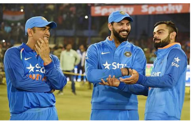
ఇక్కడ నిజమైన స్నేహాలు ఉండవు. డబ్బు, విజయం, పేరు ప్రఖ్యాతలకే విలువ ఎక్కువ. కెరీర్ ఆరంభంలో యువీ అంటే ఎంతో ఇష్టపడిన కోహ్లి ఆ తర్వాత మారిపోయాడు. కోహ్లి కెప్టెన్గా ఉన్నప్పుడు యువీకి పెద్దగా అవకాశాలు కల్పించలేదు. కోహ్లి సపోర్ట్ చేసి

డాకింగ్ బ్యాటర్ యువరాజ్ సింగ్ టీమిండియా క్రికెటర్ చరిత్రలో ఓ దిగ్గజ అటగాడు. భారత్ టీ-20 ప్రపంచకప్, వన్డే ప్రపంచకప్ గెలవడంలో కీలక పాత్ర పోషించాడు. ఎంతో మంది అభిమానులను సంపాదించుకున్నాడు. మహేంద్ర సింగ్ ధోనీ తో కలిసి టీమిండియాకు ఎన్నో చారిత్రాత్మక విజయాలు అందించాడు. అయితే యువరాజ్ తగినంత గుర్తింపు రాకపోవడం కి ధోనీనే కారణమని యువరాజ్ తండ్రి యోగరాజ్ సింగ్ తరచుగా ఆరోపిస్తుంటారు. తాజాగా ధోనీతో పాటు విరాట్ కోహ్లి పై కూడా యోగరాజ్ సంవత్సరం ఆరోపణలు చేశారు. 'ఒకరు ఎదుగుతుంటే వెన్నుపోటు పొడిచే వారు ఎందరో ఉంటారు. యువరాజ్ సింగ్ అంటే చాలా మంది భయపడ్డారు. తమ స్థానం ఎక్కడ లాగేసుకుంటాడో అని వారికి భయం. యువరాజ్ చాలా గొప్ప క్రికెటర్. అందుకే అతడిని హాని స్వయం జట్టులోని వారో భయపడి వెన్నుపోటు పొడిచారు. ధోనీతో సహా చాలా మందికి యువీ అంటే భయం' అని యోగరాజ్ తాజాగా ఇచ్చిన ఓ ఇంటర్వ్యూలో పేర్కొన్నారు.