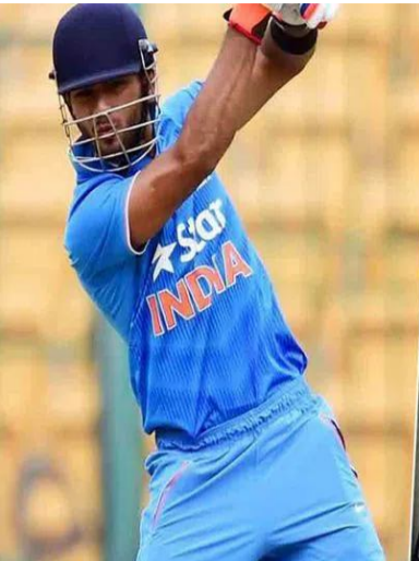
క్రికెట్లో ఢిల్లీ, ఉత్తరాఖండ్ జట్టు తరఫున ఆడాడు. రంజీ ట్రోఫీ, విజయ్ హజారీ ట్రోఫీ, సయ్యద్ ముస్తాక్ అలీ ట్రోఫీ వంటి టోర్నమెంట్లలో పాల్గొన్నాడు. ఇక దేశవాళీ క్రికెట్లో నిలకడగా రాణించినప్పటికీ, సీనియర్ భారత జట్టులో స్థానం దక్కించుకోలేకపోయాడు. దీంతో, 2021లో భారత క్రికెట్ నుంచి