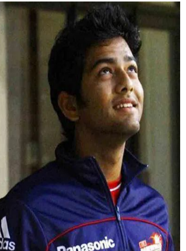
రిటైర్మెంట్ ప్రకటించి, అమెరికాకు వెళ్ళాడు. ప్రస్తుతం ఉస్మత్ చంద్ అమెరికాలో మేజర్ లీగ్ క్రికెట్ లాన్ ఎంజెర్వే నైట్ డ్రెడెర్స్ వంటి జట్టు తరఫున ఆడుతున్నాడు. ఇండియన్ ప్రీమియర్ లీగ్ (ఐపీఎల్)లో ఢిల్లీ క్యాపిటల్స్, రాజస్థాన్ రాయల్స్, మరియు ముంబై ఇండియన్స్ జట్టుకు ప్రాతినిధ్యం వహించాడు.