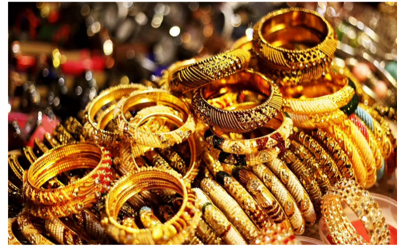
ధరలు పెరిగితా చేస్తున్నాయని స్టాక్ మార్కెట్ నిపుణులు చెబుతున్నారు.

భారత్లో బంగారం ధరలు క్రమంగా పెరుగుతున్నాయి. పండుగ సీజన్తో పాటు అంతర్జాతీయ పరిణామాలు కూడా బంగారం ధరలకు రెక్కలాచేలా చేస్తున్నాయి. గుర్ బిట్లర్ వెబ్సైట్ ప్రకారం, నేడు దేశంలో 24 క్వారెట్ల 10 గ్రాముల బంగారం ధర స్వల్పంగా పెరిగి రూ. 1,03,320కు చేరుకుంది (%+శీల్స్ = ఫ్లవ్ శీతాబ్దం 30). ఇక 22 క్వారెట్ల 10 గ్రాముల బంగారం ధర రూ. 94,710, 18 క్వారెట్ల 10 గ్రాముల బంగారం ధర రూ. 77,490గా ఉంది. కిలో వెండి ధర రూ. 1,19,800కు చేరుకుంది. ఫ్రాన్స్లో ధర కూడా స్వల్పంగా పెరిగి రూ. 38,160కు చేరింది. దేశంలో పండుగ సీజన్తో పాటు భౌగోళిక రాజకీయ అనిశ్చిత పరిస్థితులు, యూఎస్ ఫెడరల్ రిజర్వ్ పట్టి రేట్లలో కోత విధిస్తుందన్న అంచనా బంగారం