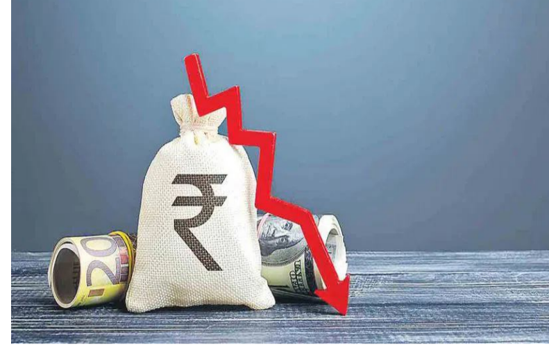
దిగుమతులు ఇంకా భారం కానున్నాయి మరి. దీంతో ద్రవ్యోల్బణం భయాలు వెంటాడుతున్నాయి. చివరకు దేశ ఆర్థిక వృద్ధిరేటు బలహీనపడేలా పరిస్థితులు వెళ్తున్నాయి. ఫారెన్ కరెన్సీ నిల్వలు డౌన్ డేవ్ కంట్రోల్స్ ఫారెన్ కరెన్సీ నిల్వలు మరింత క్షీణించాయి. ఈ నెల 22తో ముగిసిన వారంలో 4.386 బిలియన్ దాలర్లు పడిపోయాయి. దీంతో 690.72 బిలియన్ దాలర్లకు భారత్లో దాలర్ నిల్వలు దిగజారి నట్లు ఆర్బిఐ శుక్రవారం తెలిపింది.

దాలర్తో పోల్చితే మరో 51 పైసలు పతనం ముందై, ఆగస్టు 29 : రూపాయి మారకం విలువ మునుపెన్నడూ లేనివిధంగా అల్ట్రైమ్ కనిష్ఠానికి దిగజారింది. శుక్రవారం ట్రేడింగ్లో తొలిసారి 88 మార్కులు దాటేసింది. ఈ క్రమంలోనే దాలర్తో పోల్చితే దేశీయ కరెన్సీ వాల్యూ 51 పైసలు పడిపోయి 88.09 వద్దకు చేరింది. దీంతో ఈ ఏడాది ఆగస్టు 5వ నమోదైన కనిష్ఠ స్థాయి (87.88) కనుమరుగై పోయినట్లైంది. ఇక ఒకనాడే దశలోనైతే 88.33 వద్దకు క్షీణించడం గమనార్హం. ఈ ఏడాది ఫిబ్రవరి 10న 87.95 స్థాయికి పడిపోగా.. మళ్లీ ఇప్పుడే అంతకంటే ఎక్కువగా దిగజారింది. అయితే ట్రంప్ టారిఫ్లు, భారత్-అమెరికా మధ్య వాణిజ్య ఒప్పందంపై కొనసాగుతున్న ఉత్పంఠ, దేశం నుంచి తరలిపోతున్న విదేశీ కరెన్సీ నిధులు.. ఇవన్నీ కూడా మార్కెట్ సెంటిమెంట్ను దెబ్బతీశాయని నిపుణులు ట్రేడింగ్ సరళిని విశ్లేషిస్తున్నారు. దిగుమతులు భారం అసలే ట్రంప్ టారిఫ్లతో ఉక్కిరిబిక్కిరవుతున్న భారత్ను.. రూపాయి విలువ పతనం మరింతగా కుంగదీస్తున్నది.