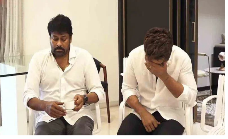
నానమ్మ మృతి చెందిన విషయం తెలుసుకున్న అల్లు అర్జున్ ముంబైలో తన సినీమా మాటింగ్ను మధ్యలో ఆపి హుటాహుటిన హైదరాబాద్ వచ్చారు. భిలాఫులు పెద్ద సంఖ్యలో అల్లు నివాసానికి అనంతరం నానమ్మ మృతదేహాన్ని చూసి కన్నీటిపర్యంతమయ్యారు. ఈ క్రమంలోనే అల్లు అరవింద్ ఇంటికి చేరుకున్న మేగాస్టార్ చిరంజీవి, ఆయన