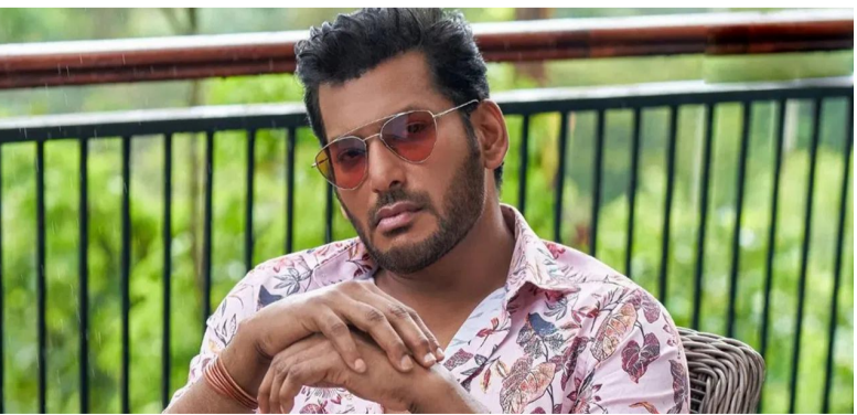
దీంతో ఇప్పుడు విశాల్ పెళ్లి తేదీ, అతడి ావడానికి నెటిజన్స్ తెగ ఆసక్తి చూపిస్తున్నారు. పరస్మల్ లైఫ్, ఆస్తుల గురించి తెలుసు

తమిళ చిత్రపరిశ్రమలోని స్టార్ హీరోలలో విశాల్ ఒకరు. ఎక్కువగా యాక్షన్ సినిమాలతో పరుగు హిట్స్ అందుకున్నారు. దాదాపు 24 ఏళ్లుగా సినీరంగంలో చక్కటి తిప్పుతున్న విశాల్.. కొన్ని నెలలుగా సినిమాలకు దూరంగా ఉంటున్నారు. ఈ క్రమంలో నటి సాయి ధన్వికను పెళ్లి చేసుకోబోతున్నట్లు ఇటీవల అధికారికంగా ప్రకటించారు. వీరిద్దరి వివాహం ఈ ఏడాది చివర్లో జరగనున్నట్లు తెలుస్తోంది. ఈ క్రమంలో ఆగస్ట్ 29న ఇరు కుటుంబ సభ్యుల సమక్షంలో ఇద్దరి నిశ్చితార్థ వేడుక ఘనంగా జరిగింది. ఇందుకు సంబంధించిన ఫోటోస్ తన ఇన్ స్టాలో విశాల్ షేర్ చేయడంతో క్షణాల్లో వైరల్ గా మారాయి.