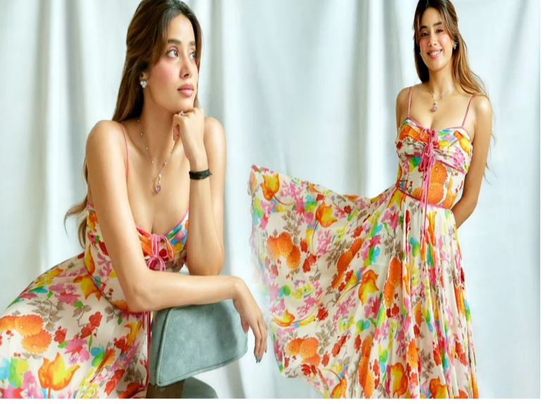
చిన్నది. ఇదెక్కడి డిప్లీస్ రా మామ..! ఈ సీనియర్ హీరోయిన్ భర్త టాలీవుడ్ హీరోనా..!! ఏ ఏ సినిమాలు చేశాడంటే తాజాగా ఈ ముద్దుగుమ్మ కొన్ని ఆనక్షికర కామెంట్స్ చేసింది. గతంలో నేను చాలా సార్లు నాకు పెళ్లియందని అబద్ధం చెప్పా.. వేరే దేశాలకు వెళ్ళినప్పుడు నేను ఎక్కడైనా ఇలా అబద్ధాలు చెప్పంటా.. అమెరికా అందాలకు యమా క్రేజ్ ఉంది. అందాల ఆరబోస్తూ కుర్రాళ్లను కప్పిస్తుంది ఈ

అలనాటి అందాల తార శ్రీదేవి కూతురు జాన్వీ కపూర్ ప్రస్తుతం పరుసగా సినిమాలు చేస్తూ ఇండస్ట్రీలో హీరోయిన్ గా రాణిస్తుంది. దగ్గరే సినీమాతో ఇండస్ట్రీలో అడుగు పెట్టి పరుసగా సినిమాలు చేస్తూ ప్రేక్షకులను అలరిస్తుంది జాన్వీ కపూర్. మొన్నటివరకు హిందీలో పరుసగా సినిమాలు చేసి ఆకట్టుకుంది ఈ బ్యూటీ. కమర్షియల్ సినిమాలతో పాటు తేడీ ఓరియంటెడ్ మూవీస్ లోనూ సటిస్టు ప్రేక్షకులను ఆకట్టుకుంది. ఎప్పటికప్పుడు ప్రయోగాత్మక సినిమాలు చేస్తూ అభిమానులను ఆకట్టు కుంటుంది. విభిన్నమైన కథలను ఎంచు కుంటూ సినిమాలు చేస్తున్నప్పటికీ ఆశించిన స్టాయిల్ నక్సెస్ కాలేకపోతుంది ఈ చిన్నది. పెట్టింది రూ. 5కోట్లు.. వచ్చింది రూ. 60 కోట్లు.. ఇప్పటికీ ఓటీటీలో దుమ్మురేపుతున్న చిన్న సినిమా ఇక గత ఏడాది ఎన్టీఆర్ కు జోడీగా దేవర్ సినిమాలో నటించింది. కొరటాల శివ దర్శకత్వంలో తెరకెక్కిన ఈ సినిమా మంచి విజయాన్ని అందుకుంది. ఈ సినిమాతో తెలుగులోకి అడుగుపెట్టింది జాన్వీ. త్వరలోనే దేవర్ 2 రాసుంది. అలాగే మోహన్ సార్ గా రావే చరణ్ సరసన కూడా నటిస్తుంది జాన్వీ కపూర్. బుచ్చిబాబు దర్శకత్వంలో పెట్టిలో హీరోయిన్ గా నటిస్తుంది. ఇక సోషల్ మీడియాలో జాన్వీ అందాలకు యమా క్రేజ్ ఉంది. అందాల ఆరబోస్తూ కుర్రాళ్లను కప్పిస్తుంది ఈ