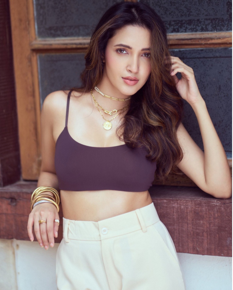
వివరి సినీమా సాహెలో ఐటెంసాంగ్ ఏ రోజ్ ఫైనల్ చేస్తున్నాడు. మరి ఎన్నో అంచనాలలో హిట్ అయ్యిందో అందరికీ తెలియదే. ఈ సినిమా రికార్డులను సృష్టిస్తుందో చూడాలి.