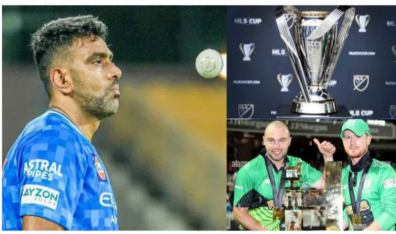
కామకొని ఉన్నాడు. ఇంగ్లండ్ గడ్డపై జరుగుతున్న డి హండ్రెడ్ లీగ్లోని జట్టు అశ్విన్తో ఒప్పందం కోసం తపివేతులు చూస్తున్నారు. అమెరికాలో జరుగుతున్న మేజర్ లీగ్ క్రికెట్ ప్రాంతాలను, యూఈఎల్లోని బందోలీ20, దక్షిణాఫ్రికాలో కొనసాగుతున్న ఎస్ఎం20 లీగ్ జట్లు కూడా ఈ వెటర్న్ షేయర్ను సొంతం చేసుకోవాలని అనుకుంటున్నాయి. ఇవేమీ కుదరకంటే, ఆస్ట్రేలియా పర్యటన మధ్యలోనే

అంతర్జాతీయ క్రికెట్కు.. బహిష్కరణ వీడ్కోలు పలికిన రవిచంద్రన్ అశ్విన్ తరువరి ఏ నిర్ణయం ఏంటి? అని అభిమానుల్లో ఆసక్తి నెలకొంది. బహిష్కరణ అత్యధిక వికెట్ల వీరుల జాబితాలో బందోలీ స్థానంలో ఉన్న యేక ఇకపై ఏ లీగ్లో ఆడుతాడు? అనేది త్వరలోనే తెలియనుంది. ఈ వెటర్న్ షేయర్ మాత్రం విదేశీ టీ20 లీగ్లపై ఆసక్తి చూపిస్తున్నట్లు సమాచారం. 16 ఏళ్ల బహిష్కరణ తర్వాత ఫోర్మాట్ ఫార్మాట్ గురించి అణచివేయబడుతున్న అశ్విన్ పలు విదేశీ ప్రాంతాలను ఆకర్షిస్తున్నాడు. మ్యాచ్ విన్సర్ అయిన ఈ స్పిన్ అల్ట్రావీరస్ దక్కించుకునేందుకు పలు జట్లు పోటీపడుతున్నాయి. వీటిలో హండ్రెడ్ లీగ్ మెంబర్ లీగ్ క్రికెట్, ఇంటర్నేషనల్ టీ20, ఎస్ఎం20.. వంటివి అశ్విన్తో ఒప్పందం కుదుర్చుకునేందుకు పావులు కదుపుతున్నాయి. భారత జట్టు తరపున, బహిష్కరణ బంధు జట్టు తరపున చిరస్మరణీయ ప్రదర్శన చేసిన బొలర్ అశ్విన్. కర్నాటక బ్యాట్లర్లను ట్రాక్ చేయడం అతను ఇకపై విదేశాల్లో తన స్పిన్ మ్యాజిక్ చూపించాలని భావిస్తున్నాడు. ఈ తపివే తంబీ రికార్డులు తెలిసి అతడిపై కోట్లు కుప్పరించేందుకు పలు విదేశీ లీగ్ జట్లు యజమానులు