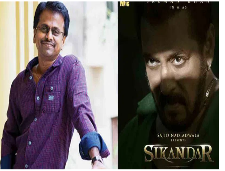
ల్యూర్ కు నేనొక్కడినే బాధ్యుడిని కాదన్నాడు. అయితే గజనీ లాంటి సక్సెస్ ఫుల్ సినిమాకు ఇలాంటి అభిప్రాయం వ్యక్తం చేస్తా..? అని అడుగగా.. గజనీ రీమేక్ సినిమా. అమీర్ ఖాన్ తో చాలా సంతోషంగా ఉన్నాను. నేను ఇప్పటికే ఆ సినిమా మీద పనిచే

ఏఆర్ మురుగదాస్, సల్మాన్ ఖాన్ కాంబోలో వచ్చిన చిత్రం సికిందర్. భారీ అంచనాల మధ్య విడుదలైన ఈ చిత్రం బాక్సాఫీస్ వద్ద ఢీలా పడిపోయింది. ప్రస్తుతం శివకార్తీకేయన్ హీరోగా నటిస్తోన్న మురుగదాస్ చిత్రాన్ని డైరెక్ట్ చేస్తున్నాడు ఏఆర్ మురుగదాస్. ఈ మూవీతో ఎలాగైనా ట్రేక్ అందుకోవాలని చూస్తున్న మురుగదాస్ ప్రస్తుతం ప్రమోషన్లలో బీజీగా ఉన్నాడు. కాగా సికిందర్ సినిమా ఫయిల్యూర్ పై ఆసక్తికర కామెంట్స్ చేశాడు మురుగదాస్. సికిందర్ గురించి మాట్లాడుతూ.. కథామూలం నాకు చాలా దగ్గరగా ఉంటుంది. సికిందర్ చాలా మంచి కథ. సాధారణంగా మనం రిలేషన్ షిప్ కు అంతగా విలువ ఇవ్వం. కానీ మన స్నేహితుల్లో ఒకడు కనిపించకపోతే.. ఏం జరిగి ఉంటుందని ఆలోచించడం మొదలు పెడతాం. అదేవిధంగా భార్య చనిపోయిన తర్వాత చాలా విషయాలు పూర్తిగా మారిపోతాయి. మన గ్రామమంతా కుటుంబంలా మారిపోతుంది. సినిమా గురించి నేను ఆలోచించిన విధానం వేరు.. కానీ సినిమా ఎలా రెడీ అయిందనేది పూర్తిగా భిన్నమైంది. నేను సరీగా మాపించలేకపోయా.. సినిమా గురించి నేను ఆలోచించినసినిమా ఫయి