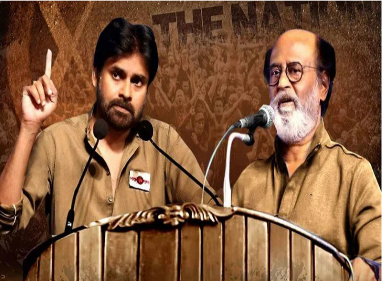
నిలుస్తోందని పేర్కొన్నారు. సినీ రంగంలో 50 సంవత్సరాలు పూర్తిచేసుకున్న రజనీకాంత్ మంచి విభిన్న పాత్రలతో అభిమానులను అలరించాలని కోరుకుంటున్నాను. ఆయూర్ రోగాలతో, ఆనందంగా, సంతోషంగా జీవితాన్ని గడపాలని భగవంతుని ప్రార్థిస్తున్నాను" అని ఏపీ డిప్యూటీ సీఎం పవన్ కల్యాణ్ అన్నారు. దీనికి రజనీకాంత్ స్పందిస్తూ.. ప్రత్యేకతగా ఏపీ ఉప ముఖ్యమంత్రి, నా సోదరుడు, పొలిటికల్ తుపాను పవన్ కల్యాణ్ కి నా

సూపర్ స్టార్ రజనీకాంత్ సినీ రంగ ప్రవేశం చేసి 50 సంవత్సరాలు పూర్తి చేసుకున్న సందర్భంగా, ఆంధ్రప్రదేశ్ డిప్యూటీ సీఎం పవన్ కల్యాణ్ పూర్వదూర్వకంగా అభినందనలు తెలియజేశారు. "తరాలు మారినా.. రజనీకాంత్ అంటే సినీ ప్రియుల్లో అద్భుతమైన ఆసక్తి, ఉత్సాహం అలాగే కొనసాగుతూనే ఉంది. అతను తన నటనతో, స్టైల్ తో, ప్రేక్షకుల మదిలో చెరగని ముద్ర వేసుకున్నాడు" అంటూ పవన్ పేర్కొన్నారు. తమిళనాడులోని చెన్నైలో రజనీకాంత్ సినీమా రిలీజ్ సమయంలో ఢిల్లీలో ఉండే ఉత్సాహాన్ని ఎన్నోసార్లు చూశానని పవన్ గుర్తు చేసుకున్నారు. "వెండి తెరపై 'సూపర్ స్టార్ రజనీ' అని టైటిల్ వేయగానే ప్రేక్షకుల్లో ఉప్పొంగి ఉత్సాహం చూడగర్పింది" అని చెప్పారు. ప్రతినియకుడిగా కెరీర్ ప్రారంభించిన రజనీకాంత్, కథానాయకుడిగా అగ్రస్థానాన్ని సాధించారని, నటనలో తనదైన ప్రత్యేకతను చూపించి ఎంతోమంది నటులకు ఆదర్శంగా నిలిచారని పవన్ కల్యాణ్ కొనియాడారు. సడకలో, సంభాషణల్లో, హాస్యాల్లో ఉన్న రైవిధ్యం, ఆయన ప్రత్యేకతగా అభివర్ణించారు. రజనీకాంత్ నటుడిగా మాత్రమే కాదు, మహాపాత్ర బాబాజీ భక్తుడిగా, ఆధ్యాత్మిక సాధనలో ముందుండే వ్యక్తిగా తనకంటే గౌరవంగా భావిస్తున్నారని పవన్ అన్నారు. యోగా, ధ్యానం వంటి ఆధ్యాత్మిక పంథాలో ఆయన చూపే ఆసక్తి చాలామందికి ప్రేరణగా