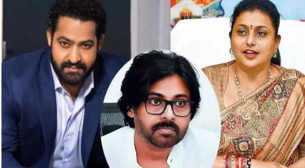
హరిహర వీరసలై సినిమాను జనాలు చూడలేదు కదా అని సెటైర్ వేశారు. స్వయానా పవన్ కల్యాణ్ అభిమానులే ఆ సినిమా చూసేందుకు థియేటర్ కు వెళ్లలేదని సెటైర్లు వేశారు.