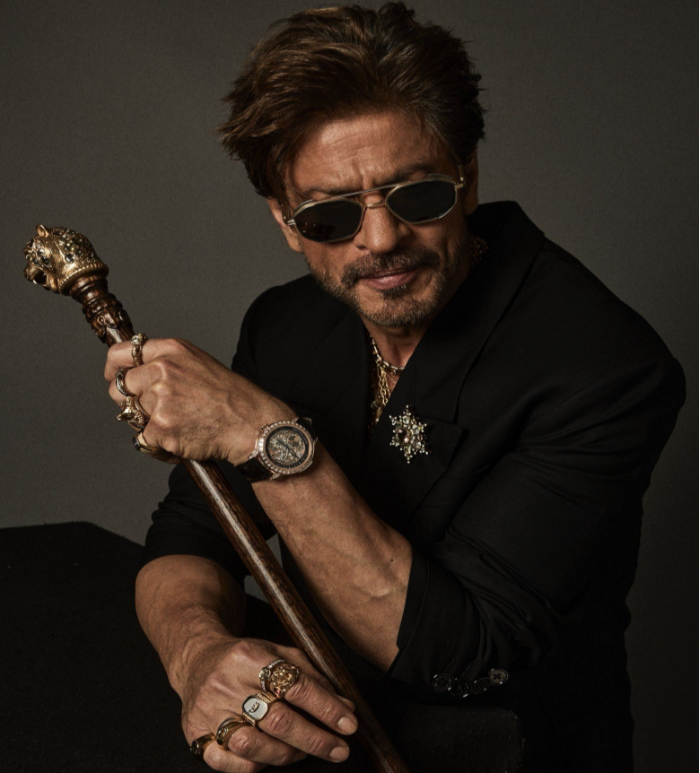
షారుఖ్ ఖాన్ ఇటీవల ఒక సినీమా షూటింగ్ లో గాయపడి ప్రస్తుతం రెస్ట్ తీసుకుంటున్న విషయం తెలిసిందే. కొన్నిరోజులుగా షూటింగ్ లేకా ఇంట్లో ఫ్యామిలీతో గడుపుతున్న షారుఖ్ తాజాగా అభిమానులతో ముచ్చటించడానికి ఎక్స్ వేడిగా ఆన్లైన్ షారుఖ్ అనే లైవ్ సెషన్ పెట్టాడు. ఇందులో షారుఖ్ అభిమానులు అడిగిన ప్రశ్నలకు సమాధానం చెప్పడంతో పాటు తన అవకాశాన్ని ప్రాజెక్టులకు సంబంధించి అప్డేట్లను పంచుకున్నాడు. ఈ సెషన్ లో ఒక అభిమాని అడుగుతూ.. షారుఖ్ సర్ మీరు జ్యోతిష్ పుస్తకం చూశారా? అని అడుగుతాడు. దీనికి షారుఖ్ బదులిస్తూ.. మీకు రేపు మంచి రోజు అని చెప్పినంత వరకు సమ్మతాను. మీకు చాలా డబ్బు వస్తుంది చెప్పినంత వరకు సమ్మతాను. అంటూ షారుఖ్ నవ్వులు పూయించాడు. మరో అభిమాని షారుఖ్ ని అడుగుతూ.. మీ తదుపరి చిత్రం ఏంటి అని అడుగగా.. కేవలం కింగ్ సినీమా మాత్రమే. మిగిలినా? అంటూ బదులిచ్చాడు.

బాలీవుడ్ బాద్ షా షారుఖ్ ఖాన్ ఇటీవల కింగ్ సినీమా షూటింగ్ లో గాయపడి ప్రస్తుతం రెస్ట్ తీసుకుంటున్న విషయం తెలిసిందే. కొన్నిరోజులుగా షూటింగ్ లేకా ఇంట్లో ఫ్యామిలీతో గడుపుతున్న షారుఖ్ తాజాగా అభిమానులతో ముచ్చటించడానికి ఎక్స్ వేడిగా ఆన్లైన్ షారుఖ్ అనే లైవ్ సెషన్ పెట్టాడు. ఇందులో షారుఖ్ అభిమానులు అడిగిన ప్రశ్నలకు సమాధానం చెప్పడంతో పాటు తన అవకాశాన్ని ప్రాజెక్టులకు సంబంధించి అప్డేట్లను పంచుకున్నాడు. ఒక అభిమాని షారుఖ్ ని అడుగుతూ.. సర్ మీ కొడుకు ఆర్కే ని హీరోగా ఎప్పుడు లాంచ్ చేస్తారు? అతడిని సూపర్ హీరోగా చూడాలని ఉంది అంటూ అడుగగా.. షారుఖ్ సమాధానమిస్తూ.. అతడు దర్శకుడు అవ్వాలి అనుకుంటున్నాడు. 'బాస్టర్డ్ ఆఫ్ బాలీవుడ్' తో అతడు దర్శకుడిగా ప్రేక్షకుల ముందుకు రాబోతున్నాడు. ఆర్కే ని దర్శకుడిగా చూసినప్పుడు మీ ప్రేమను పంచండి.. ఇప్పుడే నా ఇంట్లో కాంపీటీషన్ అవసరం లేదు అంటూ షారుఖ్ నవ్వులు పూయించాడు. మరో అభిమాని అడుగుతూ.. జిమ్ లో గాయపడటం మిమ్మల్ని ఎక్కువ బాధ పెడుతుందా లేక ట్విట్టర్ లో ట్రోల్స్ చదవడం ఎక్కువ బాధ పెడుతుందా? అంటూ అడుగగా.. షారుఖ్ సమాధానమిస్తూ.. దంబెల్స్, యాక్సెస్ నా ఎముకలు విరగొట్టగలవు 75% కానీ విమర్శలు నన్ను బాధపెట్టలేవు. ఎందుకంటే నేను నా మనసులోని సంగీతాన్ని వివసంలో చాలా బిజీగా ఉన్నాను. అంటూ షారుఖ్ తెలిపాడు. ఇటీవల నేషనల్ అవార్డు రావడంపై మీ ఫీలింగ్ ఎలా ఉందని మరో అభిమాని అడుగగా.. షారుఖ్ సమాధానమిస్తూ.. నాకు చాలా ఆనందంగా ఉంది. నేను ఈ దేశానికి రాజులా భావిస్తున్నాను. అవార్డు వచ్చాక అంతో గౌరవం పెరిగింది, అలాగే మరింత కష్టపడి, రాజీంచాలనే బాధ్యత కూడా పెరిగిందంటూ షారుఖ్ చెప్పుకోవచ్చు. బాలీవుడ్ ఆగ్ర నటుడు