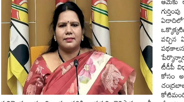
పులివెందుల నుంచి అమరావతికి రావచ్చని తెలిపారు. కానీ