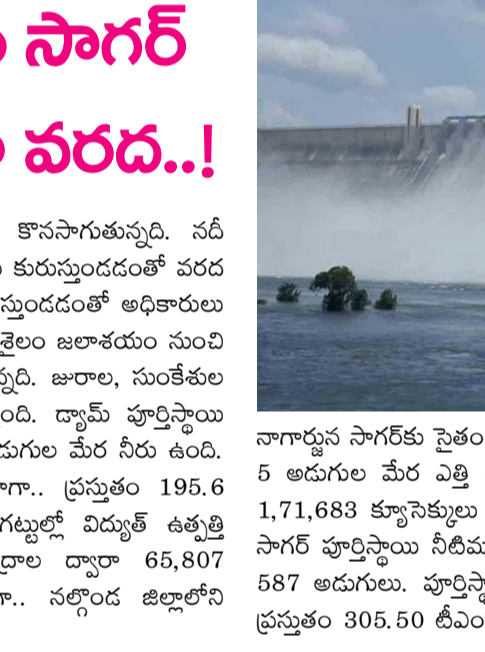
నాగార్జున సాగర్ కు సైతం వరద వచ్చి చేరుతున్నది. దాంతో అధికారులు 22 గేట్లను 5 అడుగుల మేర ఎత్తి నీటిని విడుదల చేస్తున్నారు. ప్రస్తుతం సాగర్ కు ఇన్ ఫ్లో 1,71,683 క్యూసెక్కులు కాగా.. అవుట్ ఫ్లో 2,12,753 క్యూసెక్కులుగా ఉన్నది. సాగర్ పూర్తిస్థాయి నీటిమట్టం 590 అడుగులు కాగా.. సాగర్ ప్రస్తుత నీటిమట్టం 587 అడుగులు. పూర్తిస్థాయి నీటి నిల్వ సామర్థ్యం 312.04 టీఎంసీలు కాగా.. ప్రస్తుతం 305.50 టీఎంసీలు నీరు నిల్వ ఉంది.

హైదరాబాద్ ఆగస్టు 17: కృష్ణా ప్రాజెక్టులకు వరద కొనసాగుతున్నది. నదీ పరీవాహక ప్రాంతాలతో పాటు ఎగువ ప్రాంతాల్లో వర్షాలు కురుస్తుండడంతో వరద పోతున్నట్లు తెలుస్తోంది. శ్రీశైలం జలాశయానికి భారీగా వరద వస్తుండడంతో అధికారులు మూడు గేట్లను ఎత్తి నీటిని దిగువకు వదులుతున్నారు. శ్రీశైలం జలాశయం నుంచి ప్రస్తుతం 79,269 క్యూసెక్కుల వరద సాగర్ వైపు వెళ్తున్నది. జూలాల, సుంకేతుల నుంచి ప్రాజెక్టుకు 1,18,410 క్యూసెక్కుల వరద వస్తుంది. డ్యామ్ పూర్తిస్థాయి నీటిమట్టం 885 అడుగులు కాగా.. ప్రస్తుతం 881.4 అడుగుల మేర నీరు ఉంది. పూర్తిస్థాయినీటి నిల్వ సామర్థ్యం 215.8 టీఎంసీలు కాగా.. ప్రస్తుతం 195.6 టీఎంసీలు నీరు నిల్వ ఉంది. శ్రీశైలం, కుడి, ఎడమ గట్టుల్లో విద్యుత్ ఉత్పత్తి కొనసాగుతున్నది. రెండు జల విద్యుత్ ఉత్పత్తి కేంద్రాల ద్వారా 65,807 క్యూసెక్కుల వరద కిందకు వెళ్తోంది. ఇదిలా ఉండగా.. నల్గొండ జిల్లాలోని