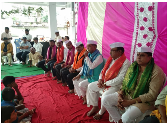
విద్యార్థులు ఆట పాటలలో సైతం రాణించాలని ఆయన