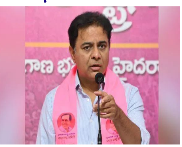
పరిస్థితికి కారణమన్న ఆర్థిక నిపుణుల సూచనలపై ప్రభుత్వం దృష్టి పెట్టాలని సూచించారు. సీఎం రేవంకే రెడ్డి నేతృత్వంలోని కాంగ్రెస్ ప్రభుత్వం ఆర్థిక కార్యకలాపాలను పూర్తిగా నిర్లక్ష్యం చేసిందని కేటీఆర్ మండిపడ్డారు. ఒకప్పుడు దేశంలోనే అత్యంత వేగంగా అభివృద్ధి చెందుతున్న తెలంగాణ ఇప్పుడు

హైదరాబాద్: పరుసగా రెండు నెలల పాటు తెలంగాణ ప్రవృత్తులకు మైసూర్లోకి పోవడం రాష్ట్ర ఆర్థిక వ్యవస్థ పతనానికి సుష్టమైన నిదర్శనమని బీఆర్ఎస్ వర్కింగ్ ప్రెసిడెంట్ కే. తారక రామారావు విమర్శించారు. కేటీఆర్ నాయకత్వంలో తొమ్మిదేండ్ల పాటు దేశానికి ఆదర్శంగా నిలిచిన తెలంగాణ రాష్ట్రం, కేవలం ఎనిమిది నెలల కాంగ్రెస్ పాలనలో ఆర్థికంగా చితికిపోయిందని తీవ్ర ఆవేదన వ్యక్తం చేశారు. రేవంకే నేతృత్వంలోని కాంగ్రెస్ ప్రభుత్వం అవలంబిస్తున్న అస్పష్ట ఆర్థిక విధానాలతోనే తెలంగాణకు ఈ దుస్థితి వచ్చిందని ఆరోపించారు. తెలంగాణ చరిత్రలో తొలిసారిగా జూన్, జులై నెలల్లో ప్రవృత్తులకు మైసూర్లో నమోదైనట్లు జులైలో రాష్ట్ర ప్రవృత్తులకు - 0.44శాతం ఉండగా, జూలై నెలకు 0.2.10శాతం ఉందని గుర్తు చేశారు. జూన్లో రాష్ట్రంలో -0.93శాతం ఉంటే, దేశవ్యాప్తంగా 0.155శాతంగా ఉందని చెప్పారు. గ్రామీణ ప్రాంతాల్లో డిఫ్లెషన్ (ప్రవృత్తులకు తగ్గదల) మరింత తీవ్రంగా ఉందని కేటీఆర్ తెలిపారు. ప్రవృత్తులకు తగ్గదల సానుకూల సంకేతాలు కావచ్చు అయిన.. రాష్ట్ర ఆర్థిక వ్యవస్థకు ఇది ప్రమాదకరం సంకేతమని హెచ్చరించారు. ప్రజలు అత్యవసరాలకు మాత్రమే ఖర్చు చేస్తున్నారని, వ్యాపార, వాణిజ్య, పారిశ్రామిక రంగాలన్నీ స్తంభిల్చిపోయాయన్నారు. కొత్త ఉద్యోగాల కల్పన లేకపోవడం, ఆర్థిక కార్యకలాపాలు మందగించడమే ఈ