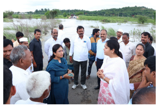
అధికారులు తదితరులు పాల్గొన్నారు.